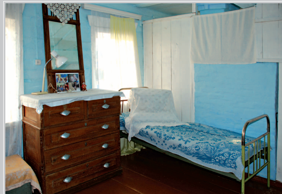
72 (18) Интерьер отчего дома В.Г. Распутина. Село Аталанка Усть-Удинского района Иркутской области. Фото 2015 г.