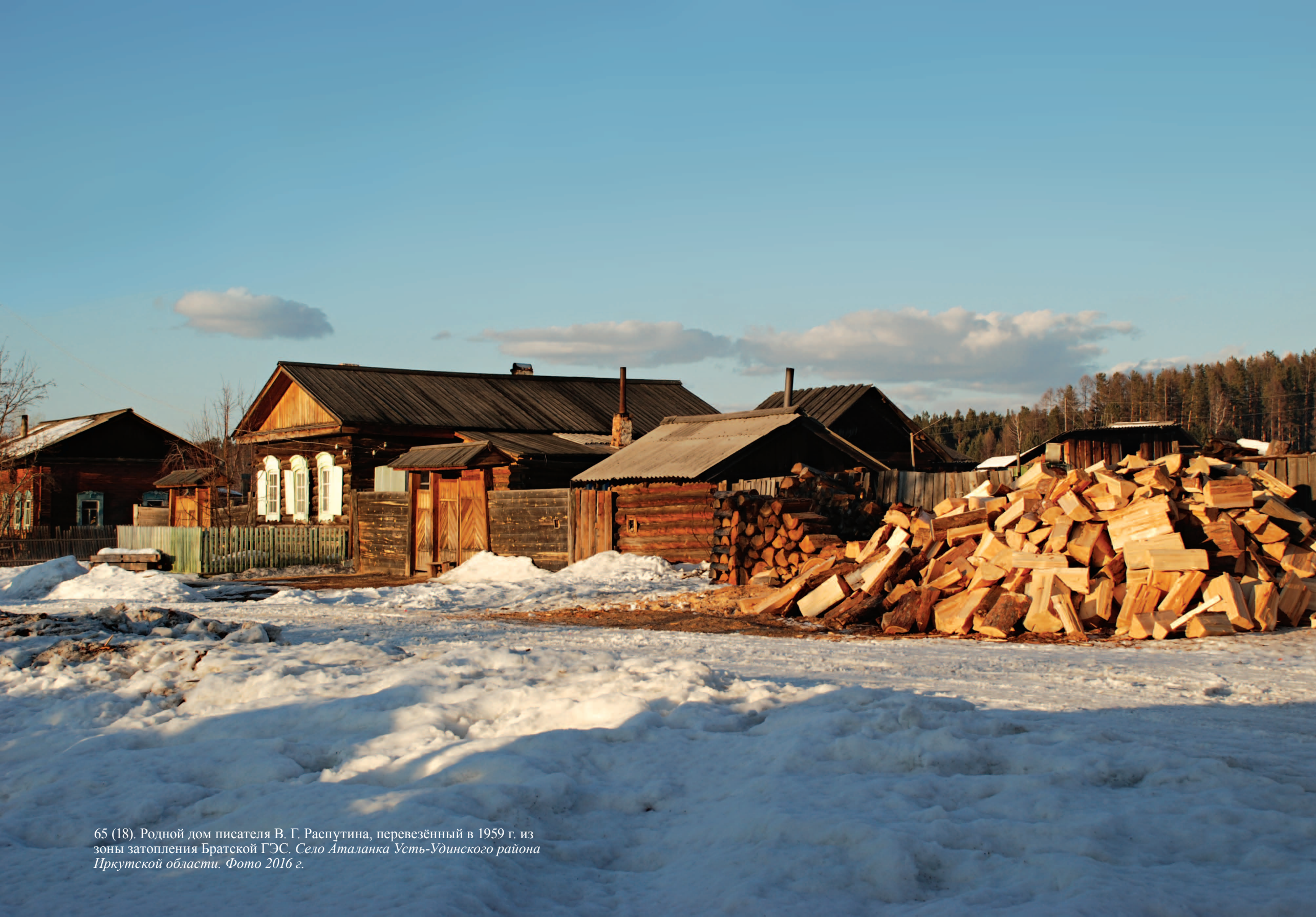
65 (18). Родной дом писателя В. Г. Распутина, перевезённый в 1959 г. из зоны затопления Братской ГЭС. Село Аталанка Усть-Удинского района Иркутской области. Фото 2016 г.