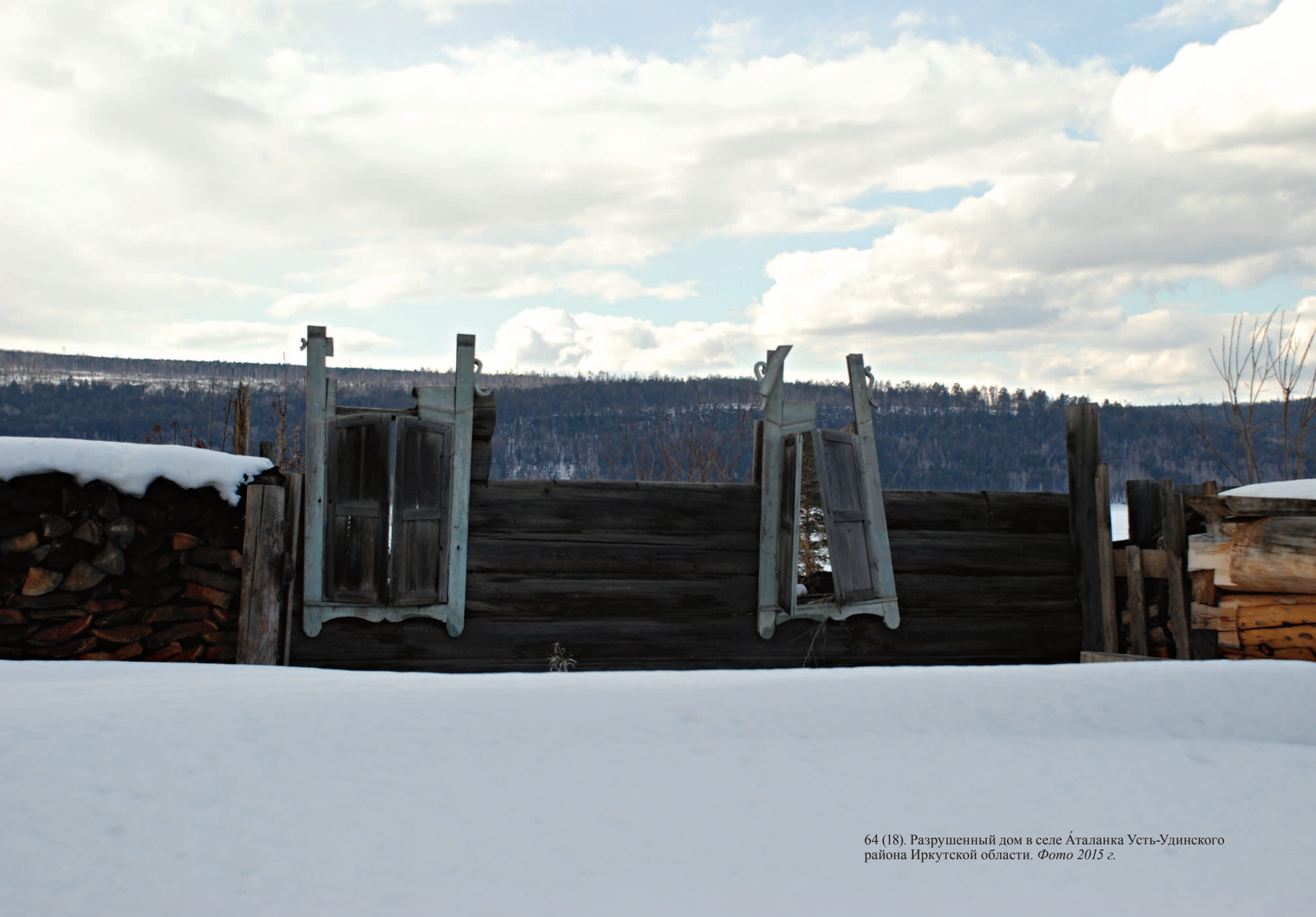
64 (18). Разрушенный дом в селе Аталанка Усть-Удинского района Иркутской области. Фото 2015 г.