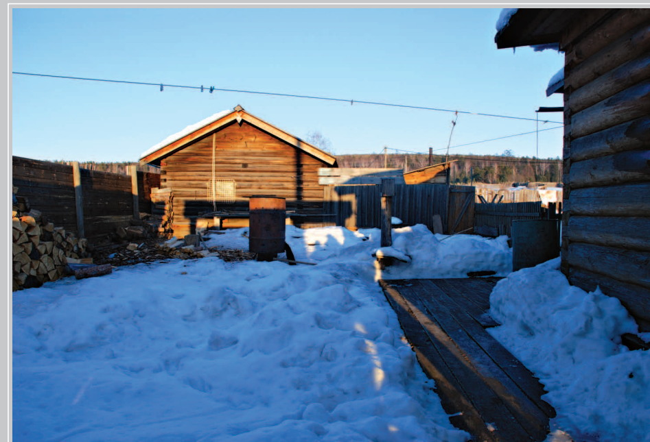
69 (18). Двор дома В. Г. Распутина в селе Аталанка Усть-Удинского района Иркутской области. Фото 2015 г.