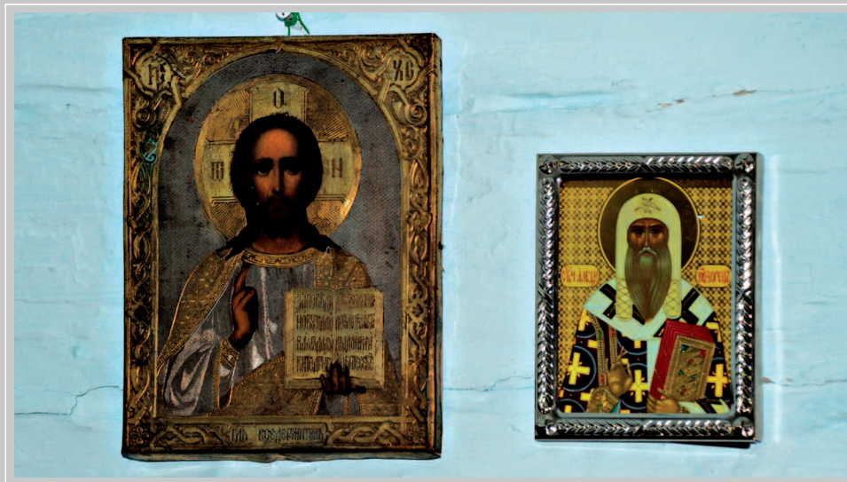
66 (18). Иконы в доме писателя В.Г. Распутина: «Господь Вседержитель» (конец XIX — начало XX в.) и «Святитель Алексей, митрополит Московский» (XX в.). Село Аталанка Усть-Удинского района Иркутской области. Фото 2015 г.