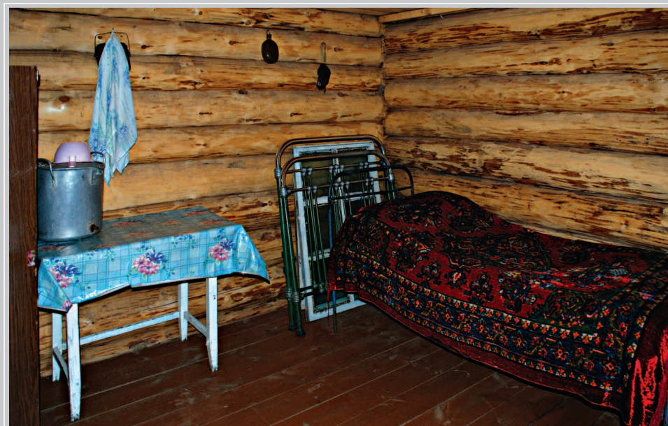
71 (18). Сени в родном доме писателя В.Г. Распутина. Село Аталанка Усть-Удинского района Иркутской области. Фото 2015 г.