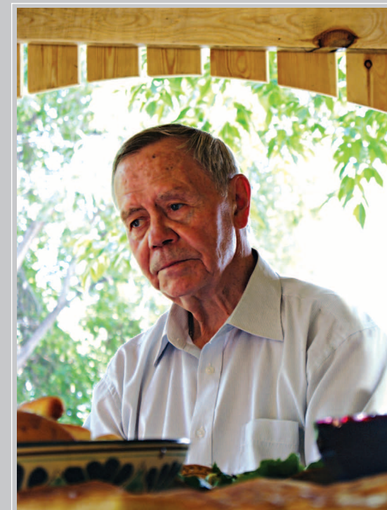
68 (18). Писатель Валентин Григорьевич Распутин. Фото 2013 г.