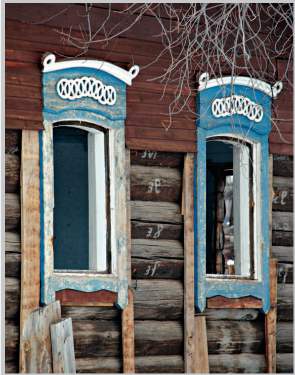
61 (18). Окна дома с резными наличниками. Село Аталанка Усть-Удинского района Иркутской области. Фото 2015 г.