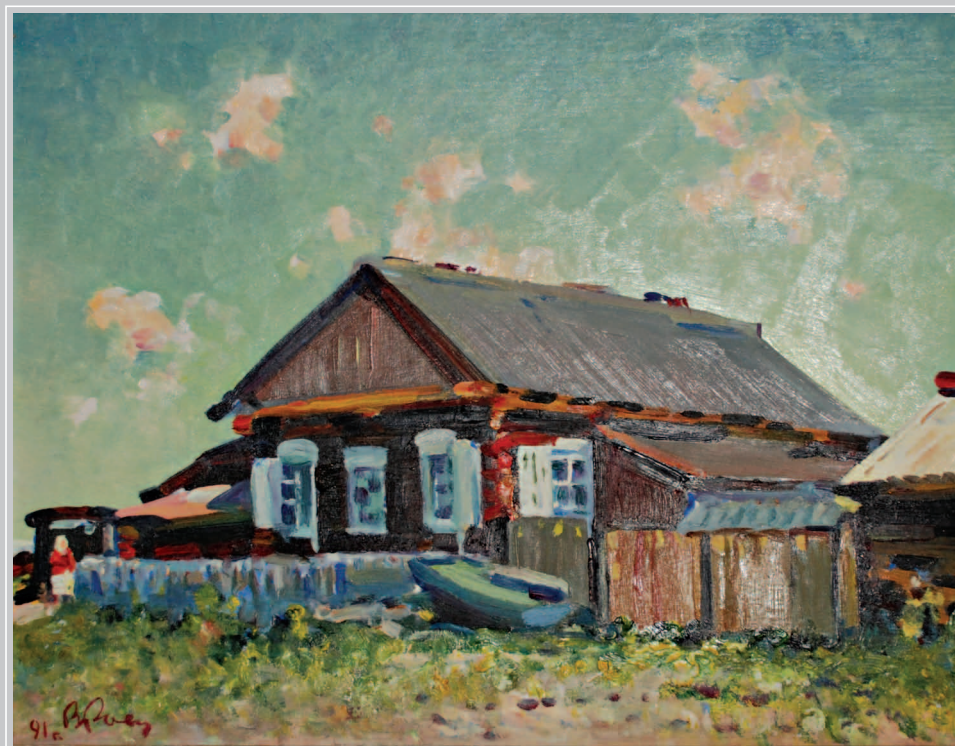
67 (18). Картина художника В. Роголя «Дом В. Г. Распутина», находящаяся в родном доме писателя. Село Аталанка Усть-Удинского района Иркутской области. Фото 2015 г.