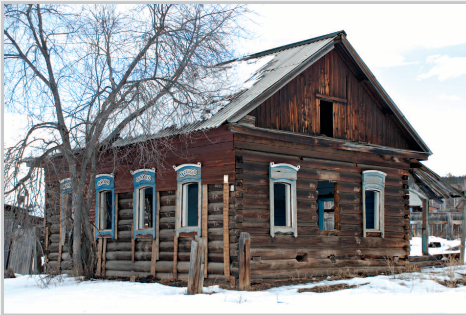
62 (18). Дом с двускатной крышей. Село Аталанка Усть-Удинского района Иркутской области. Фото 2015 г.