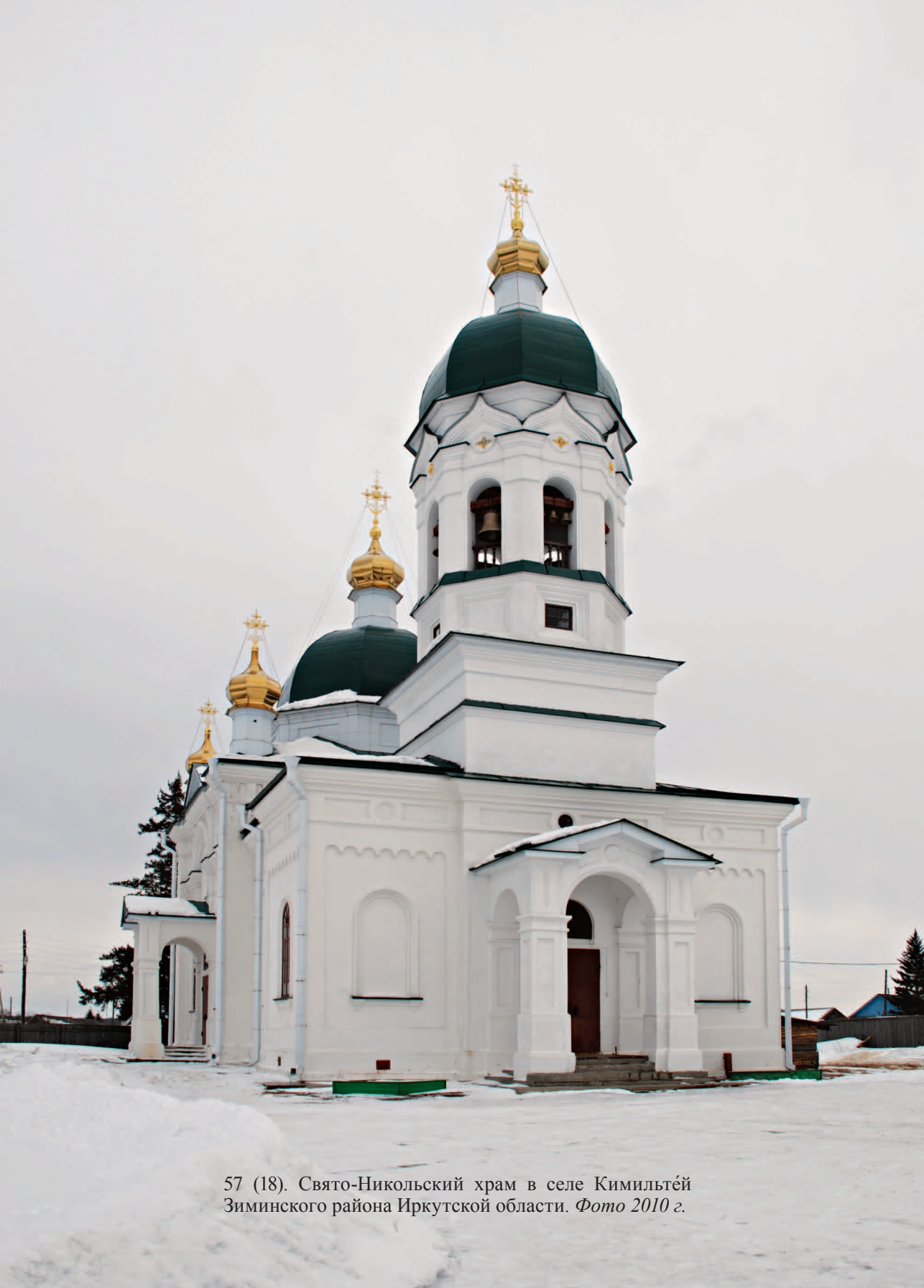
57 (18). Свято-Никольский храм в селе Кимильтэй Зиминского района Иркутской области. Фото 2010 г.