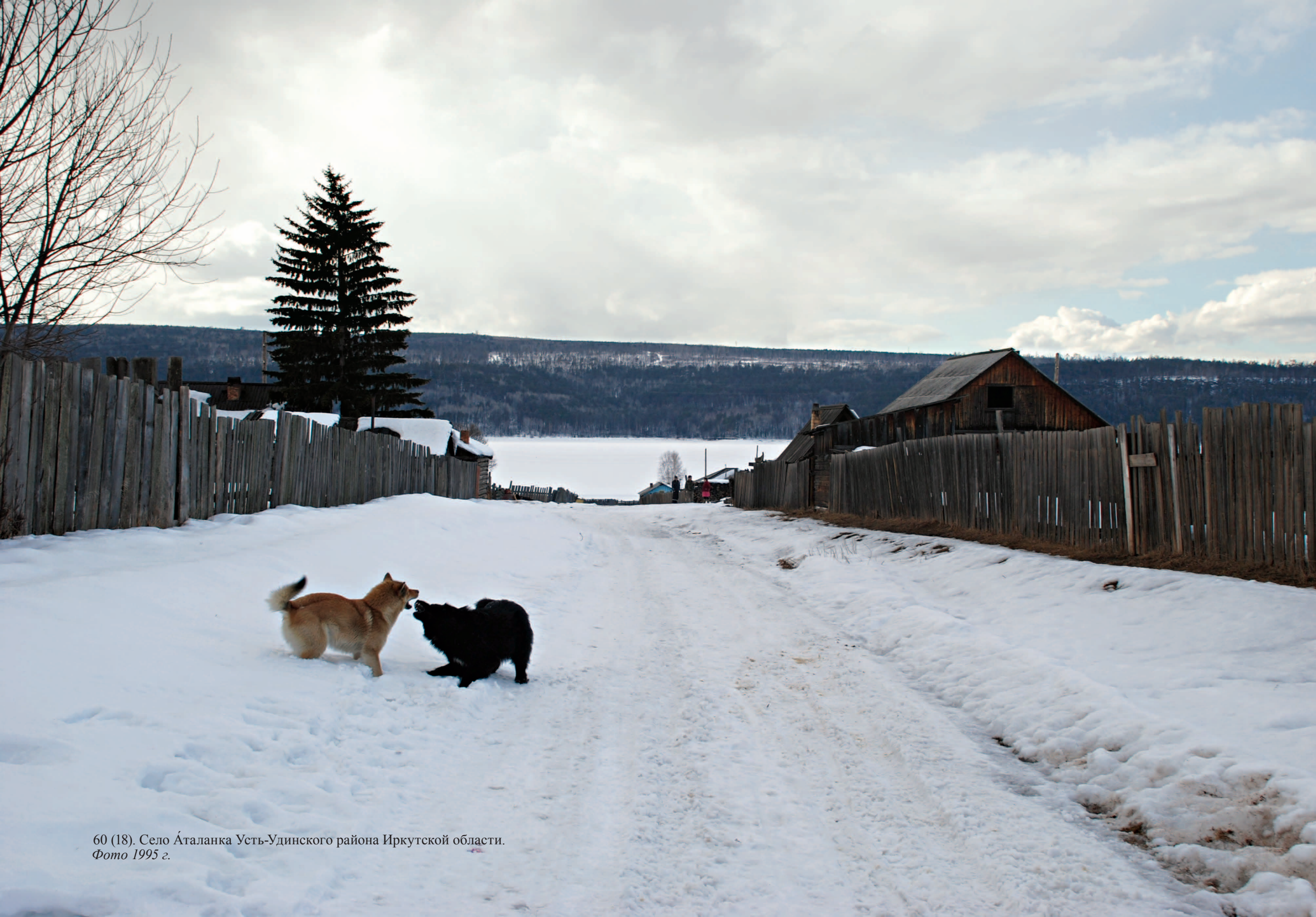
60 (18). Село Аталанка Усть-Удинского района Иркутской области. Фото 1995 г.