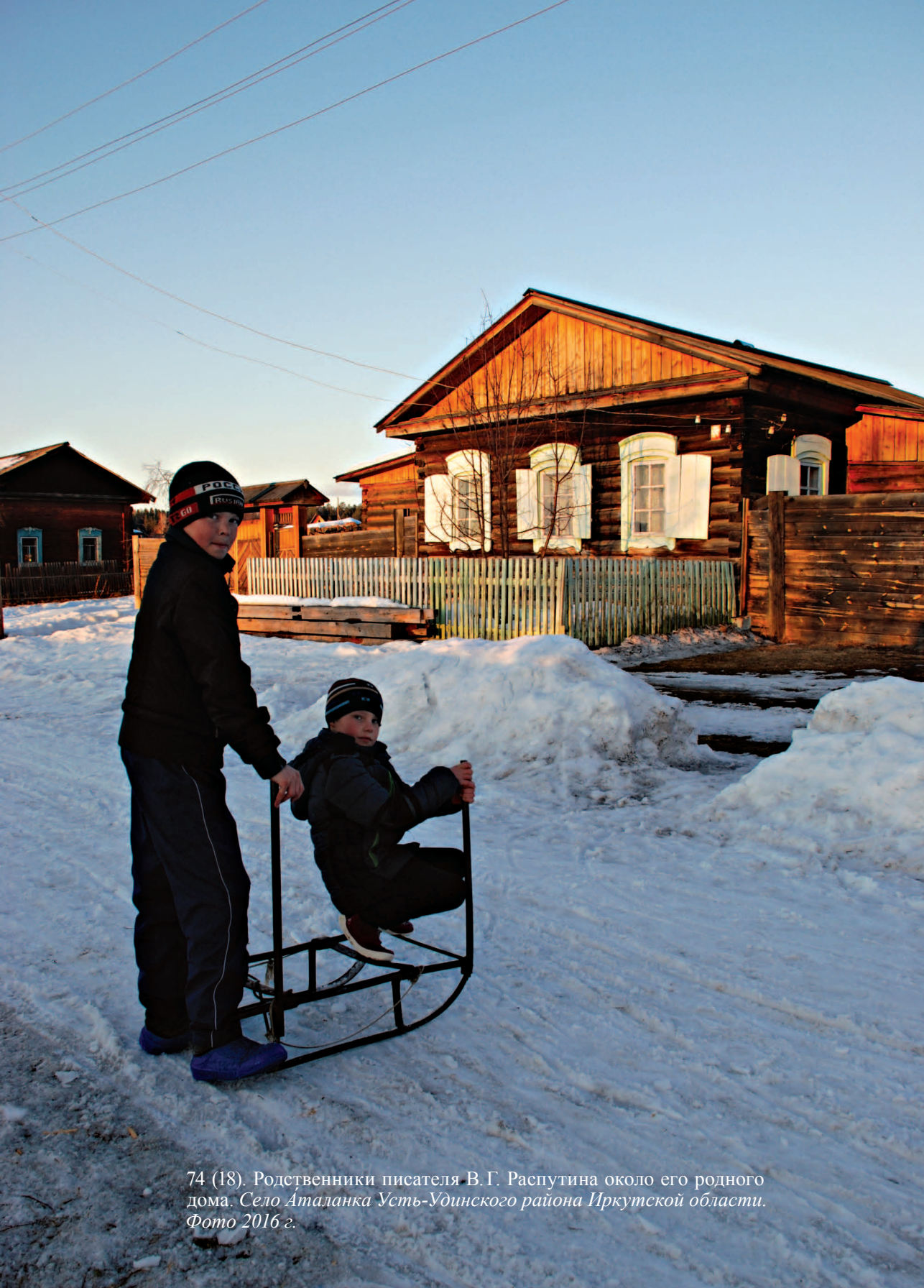
74 (18). Родственники писателя В.Г. Распутина около его родного дома. Село Аталанка Усть-Удинского района Иркутской области. Фото 2016 г.