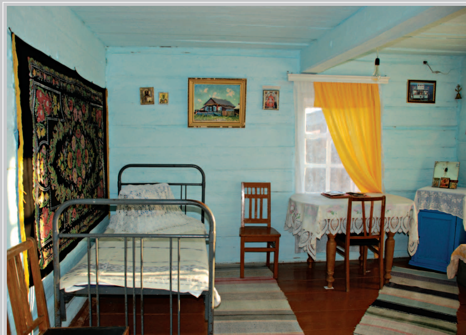
70 (18). Интерьер отчего дома В.Г. Распутина. Село Аталанка Усть-Удинского района Иркутской области. Фото 2015 г.