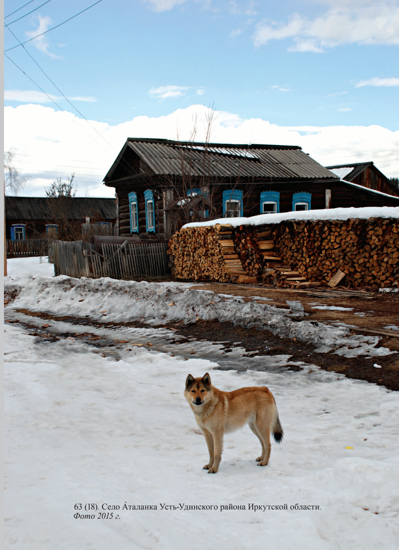
63 (18). Село Аталанка Усть-Удинского района Иркутской области. Фото 2015 г.