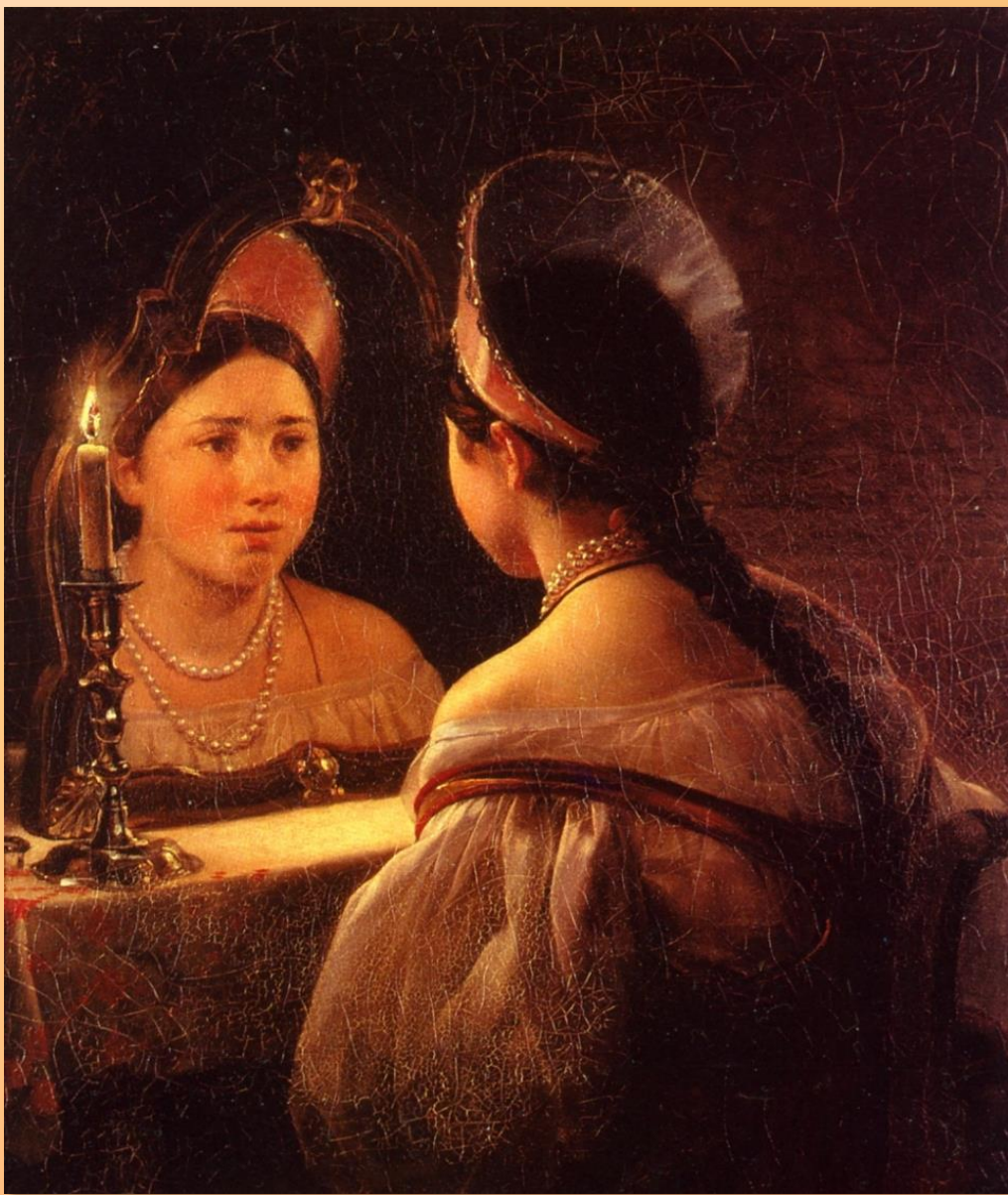
Карл Павлович Брюллов «Гадающая Светлана». 1836.