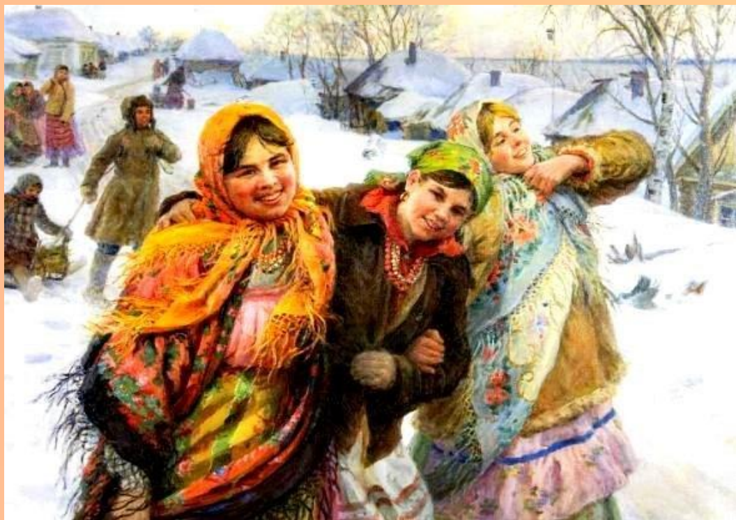
Федот Васильевич Сычков. «Праздничный день. Подруги. Зима». 1941.