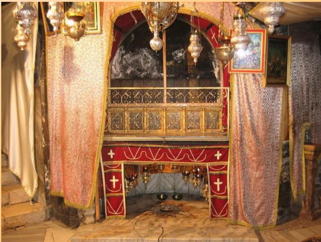
Пещера Рождества Христова