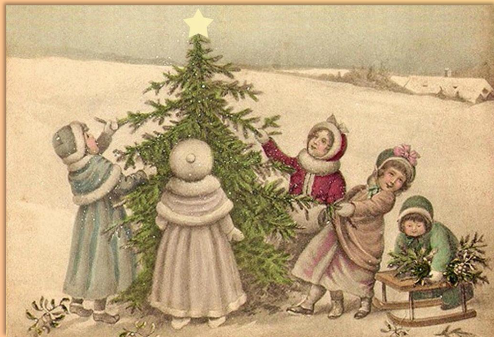
Новогодние дореволюционные открытки