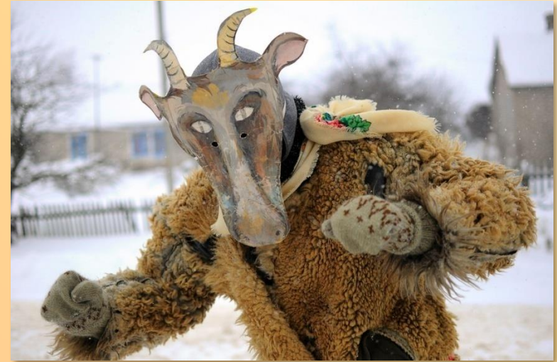
М. Павлова «Ряженые».