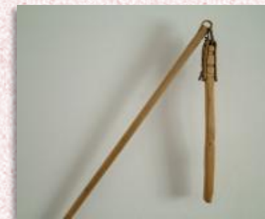
Цеп – орудие для молотьбы