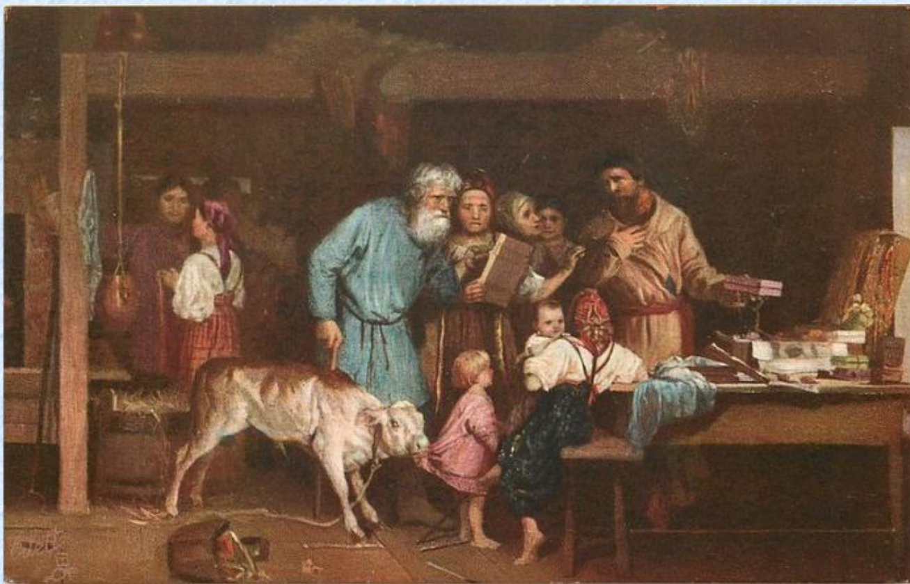
Николай Андреевич Кошелев. «Офеня-коробейник».

Осенняя Казанская – важная дата в народном календаре. С этой порой связано множество примет: «Что Казанская покажет, то и зима скажет» . К этому дню возвращались в деревню те, кто уходил в чужие места на заработки. Среди отходников разных специальностей были и офени-коробейники – торговцы мелким товаром вразноску.