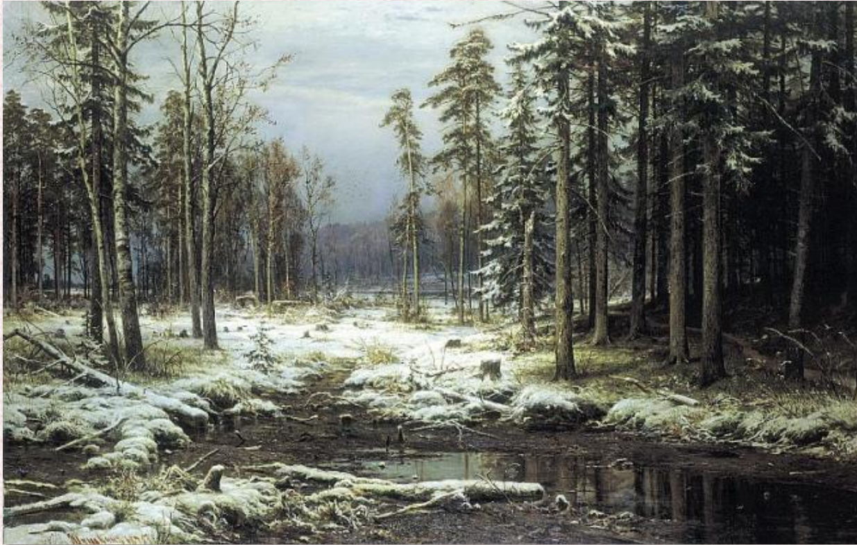
Иван Шишкин. «Первый снег». 1875.