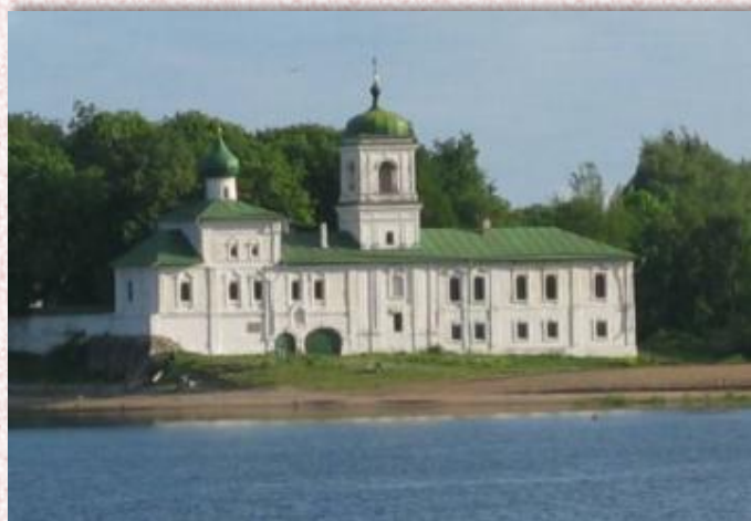
Церковь святых Козьмы и Дамиана на Гремячей горке, г. Псков

К святым Косме и Дамиану относились с особым почтением во всех восточнославянских землях. На Руси им посвящались монастыри и храмы. Так, во всех городах, возникших до XVII в., были построены церкви во имя Космы и Дамиана.