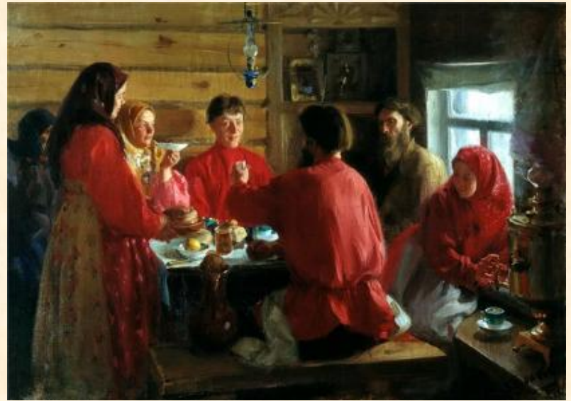
Иван Куликов. «В крестьянской избе».

Михайлов день — день народного календаря, связанный с окончанием свадебного сезона, последний осенний праздник. Михайлов день — весёлый и сытный праздник, «поскольку хлеба пока много, выручены деньги за коноплю и овёс, да и работы основные закончены». После Михайлова дня заканчивались свадьбы. День Михаила-архангела считается в народе за первый шаг «необлыжной» (настоящей, суровой) зимы.