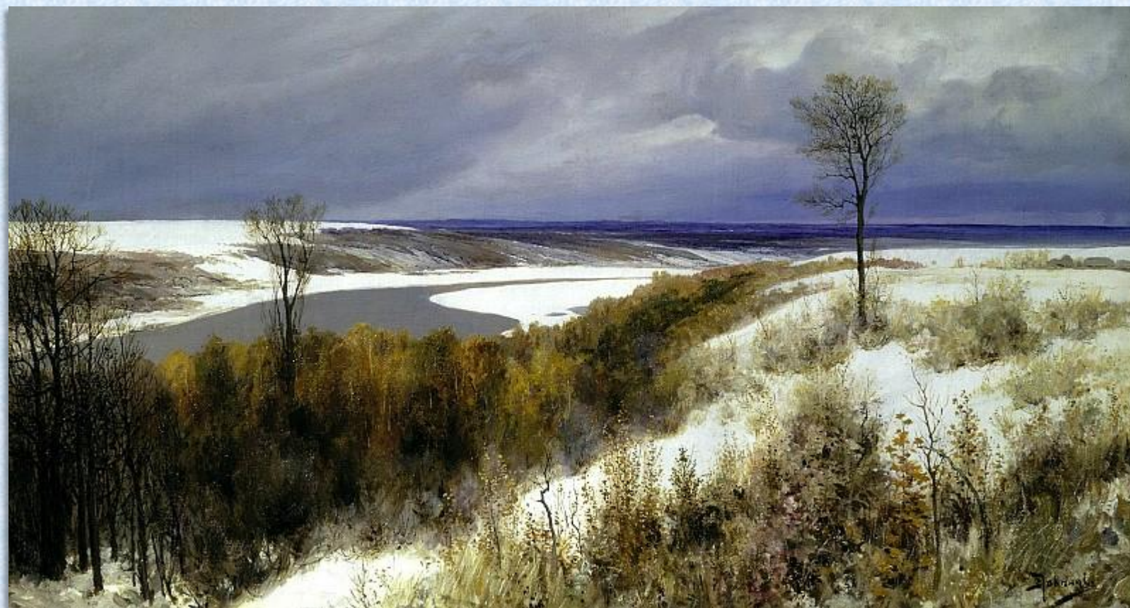
Василий Polenov. «Ранний снег».

Ноябрь зиме (морозам) дорожку торит (кажет).