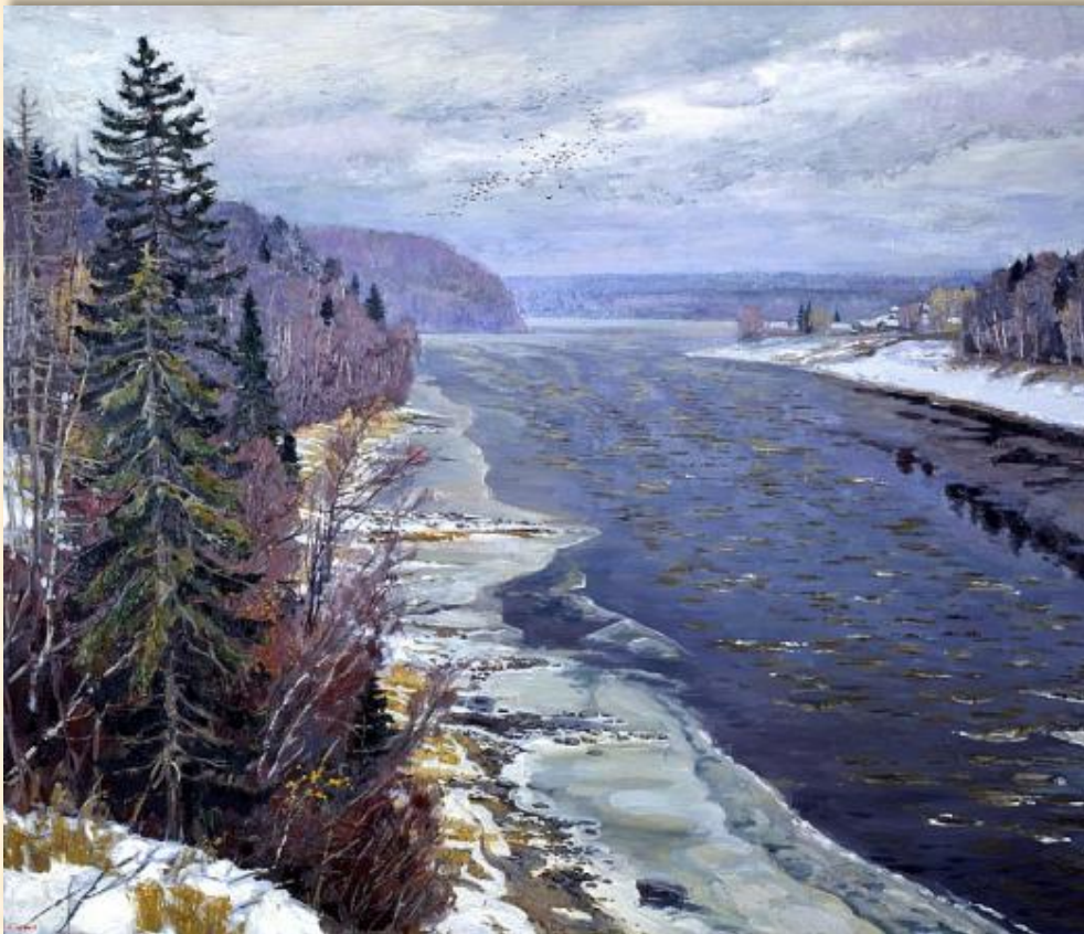
Иван Глазунов. «Первый снег на Двине».

То не мудрено, что пиво сварено, а мудрено, что не выпито.