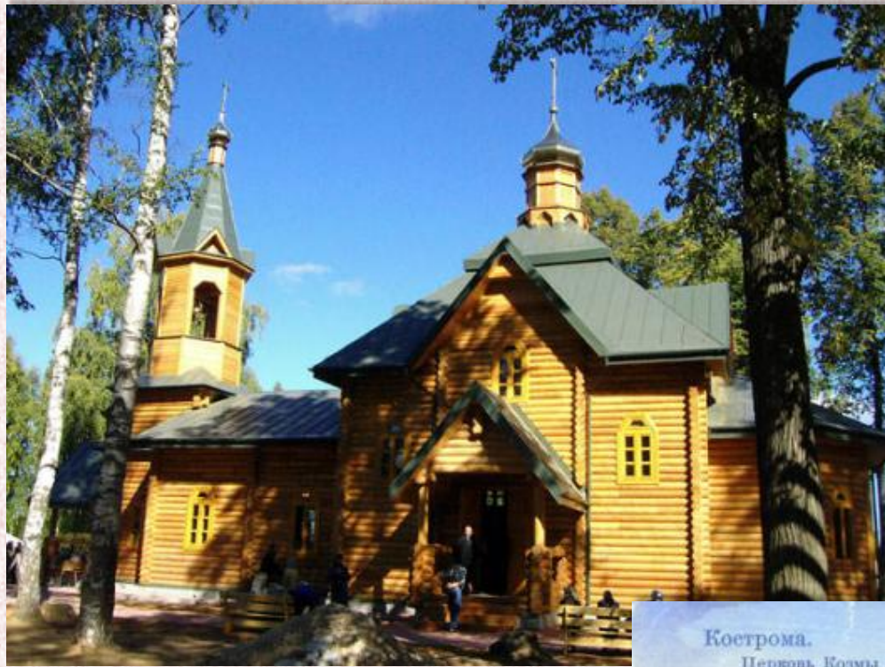
Церковь Святых мучеников Козьмы и Демьяна . Нижегородская обл.