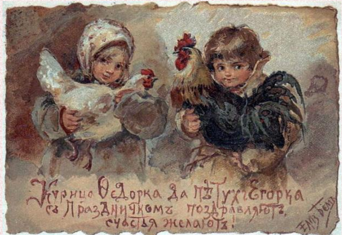
Российская открытка начала XX века. Автор рисунка Елизавета Меркурьевна Бём

В деревнях и сёлах женщины приходили с курами на боярский двор и «с челобитьем» подносили их своей боярыне на «красное житьё». Боярыни одаривали крестьянок лентами на «убрусник» (платок, полотенце). «Челобитных кур» почитали: кормили овсом и ячменём и никогда не убивали. Приносимые этими курами яйца считались целебными: ими кормили больных, страдающих желчной болезнью.