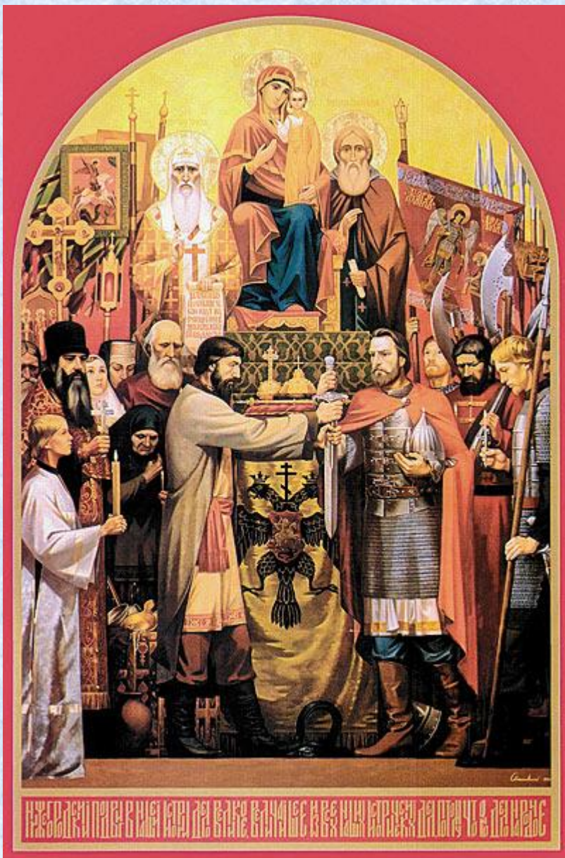
С. Малиновский. «Нижегородский подвиг. 1611 год». 1996

В ополчение, которое возглавлял князь Пожарский, был прислан из Казани чудотворный образ Пресвятой Богородицы . Зная, что бедствие попущено за грехи, весь народ и ополчение наложили на себя трехдневный пост и с молитвой обратились к Господу и Его Пречистой Матери за небесной помощью. И молитва была услышана.