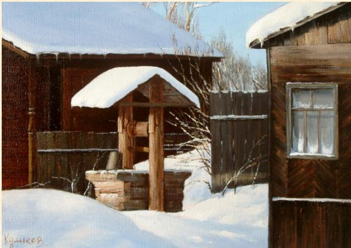
Герман Александрович Куликов. «Деревенский двор. Зима».