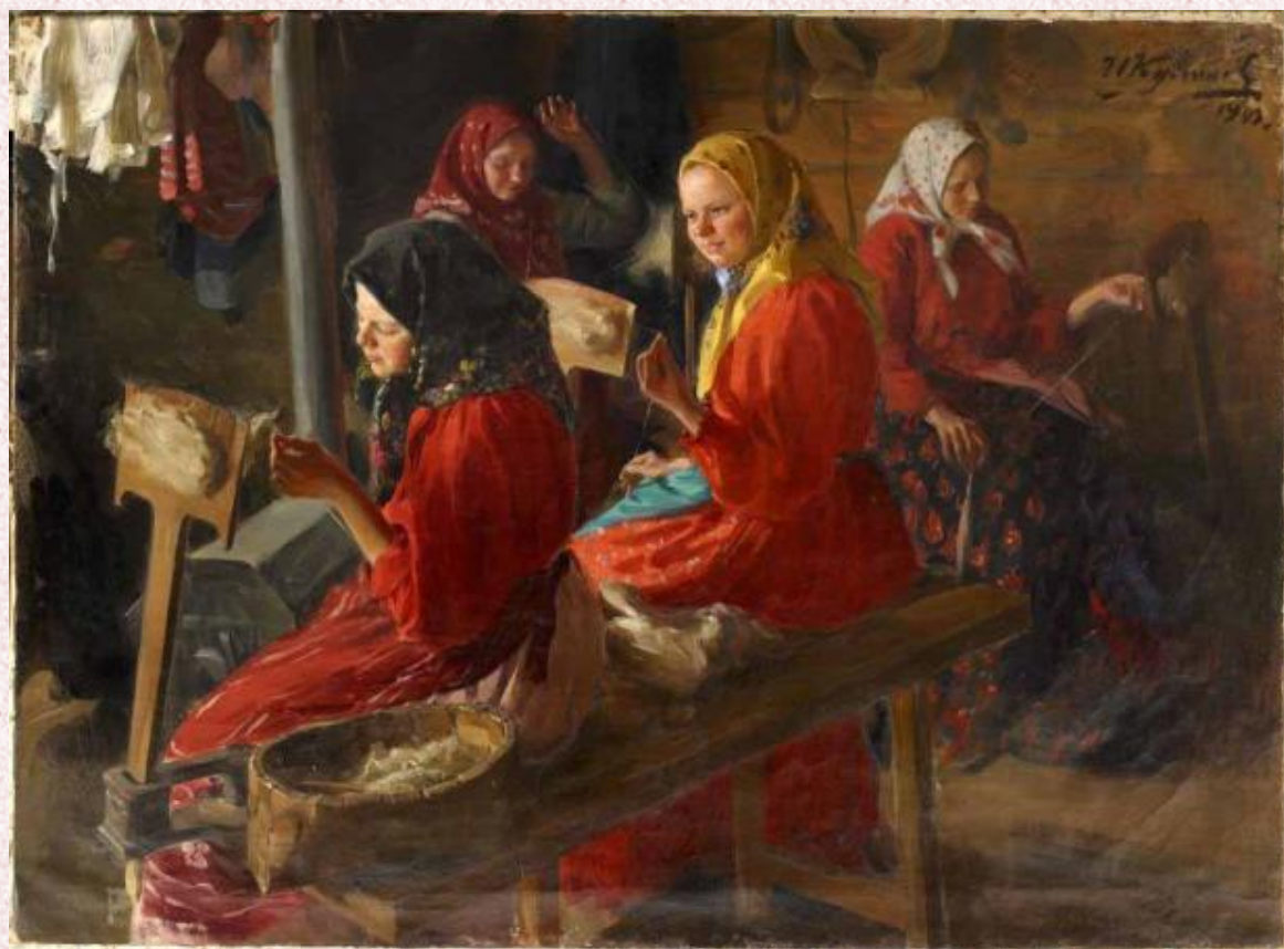
Иван Куликов. «Пряхи». 1903.

Ко дню Кузьмы и Демьяна принято было выполнять «обетные» работы. Женщины продавали изготовленные их руками изделия, а полученные деньги использовали для покупки свечей к иконам и для раздачи нищим и странникам.