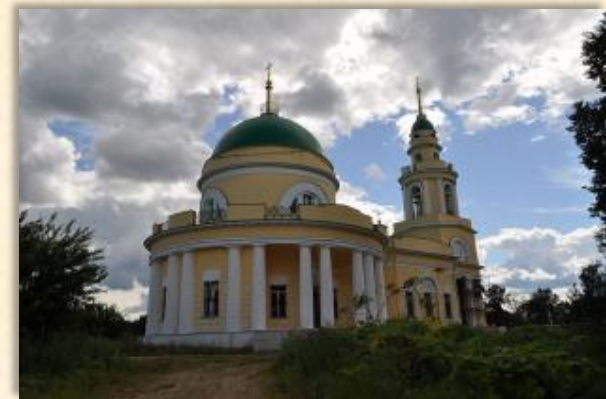
Церковь святого Михаила. Подмосковье, с. Архангельское

Архистратигу посвящено множество монастырей, соборных, дворцовых и посадских храмов. В древнем Киеве сразу по принятии христианства был воздвигнут Архангельский собор и устроен монастырь.