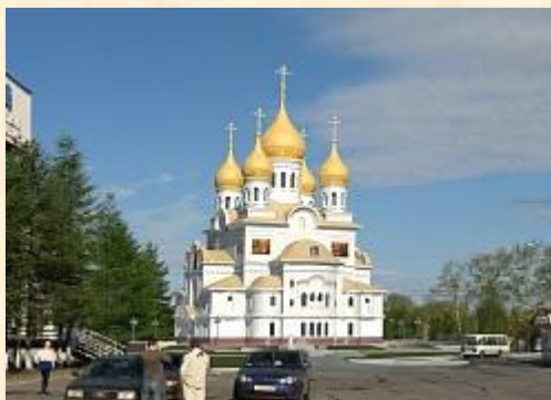
Михаило-Архангельский кафедральный собор г. Архангельска

Архистратигу посвящено множество монастырей, соборных, дворцовых и посадских храмов. В древнем Киеве сразу по принятии христианства был воздвигнут Архангельский собор и устроен монастырь.