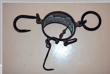
91 (9). Кованый капкан для ловли диких животных. Посёлок Верхнемарково Усть-Кутского района Иркутской области. Фото 2001 г.