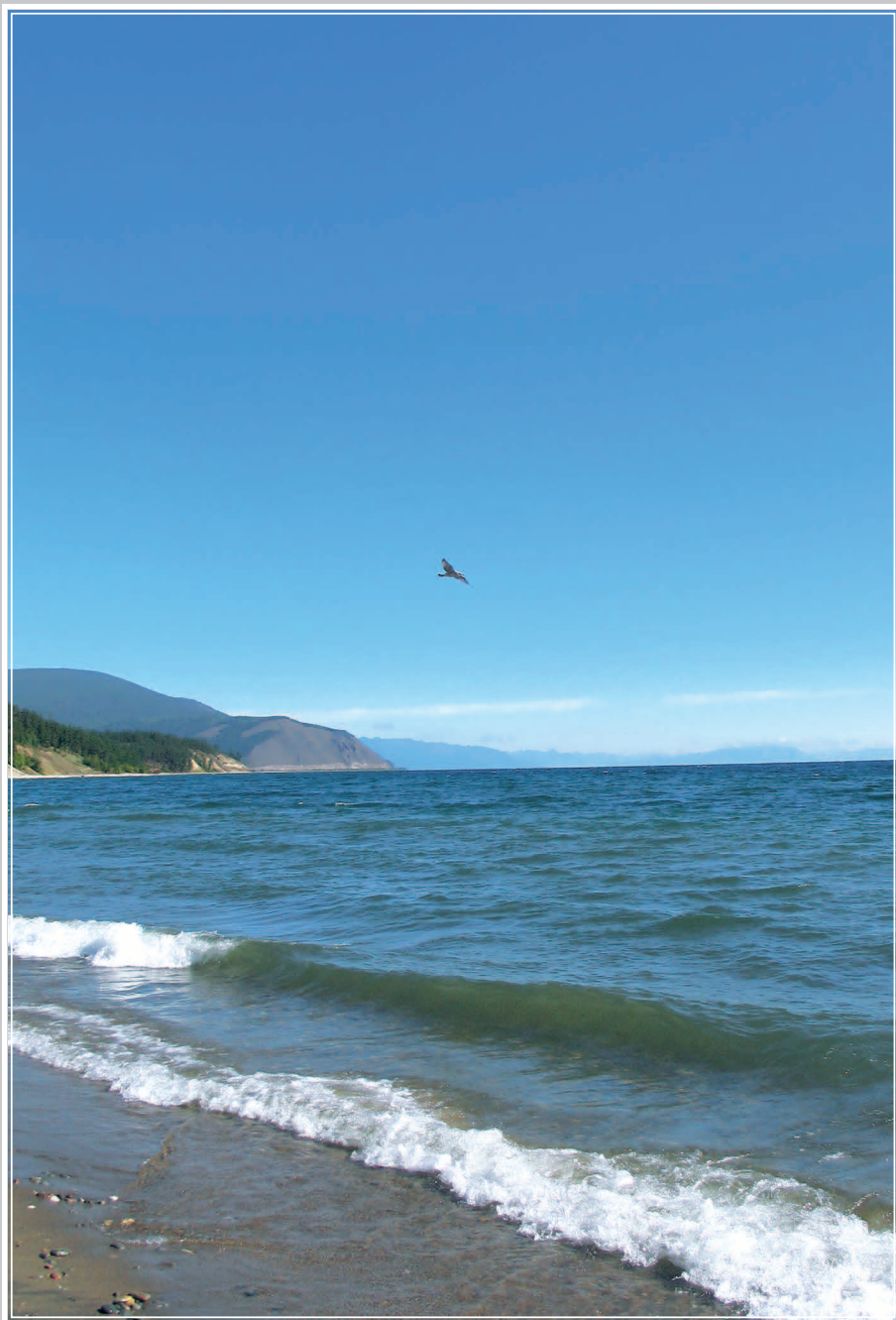
73 (9). Озеро Байкал. Северобайкальский район Республики Бурятия. Фото 2003 г.