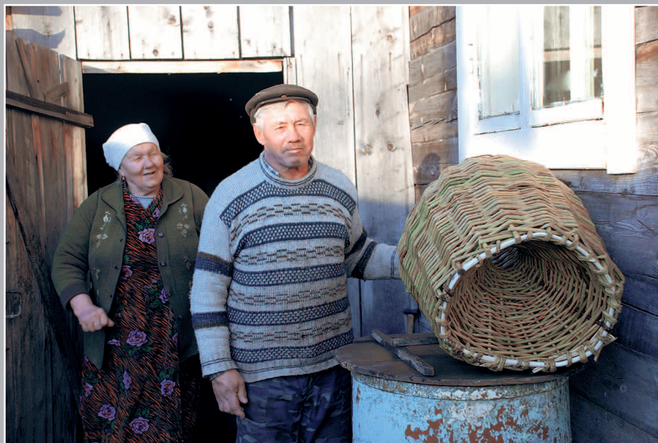
82–84. Корчага — плетённая из тальника рыболовная ловушка. Село Усть-Кемь Енисейского района Красноярского края. Фото 1988 г.