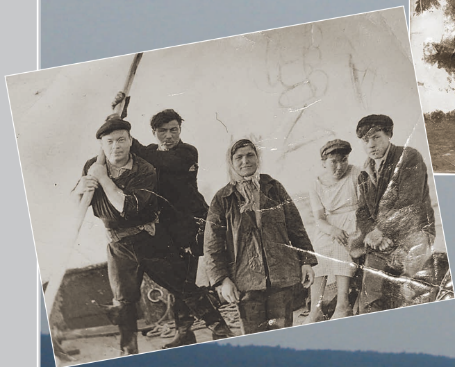
77 (9). Рыболовецкая бригада. Село Посольское Кабанского района. Фото 1961 г.