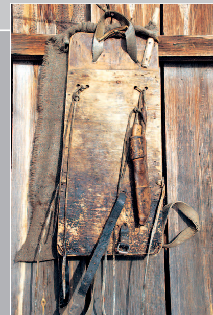
98 (9). Поняга — охотничьи носилки, надеваемые на спину, — дощечка с ремешками для укрепления груза Село Корсаково Тасеевского района Красноярского края. Фото 1987 г.