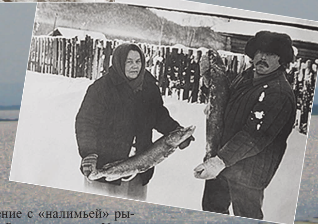
80 (9). Возвращение с «налимьей» рыбалки. Поселок Верхнемарково Усть-Кутского района Иркутской области. Фото 1982 г.