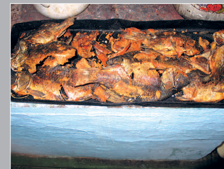
102 (9). Суховка — окуни, высушенные в русской печи («на вольном жару»). Село Яркино Кежемского района Красноярского края. Фото 1996 г.