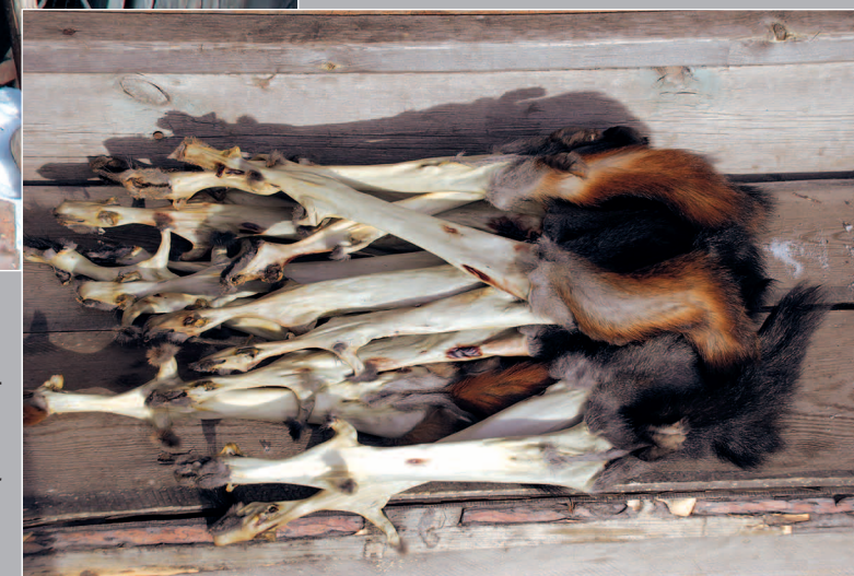
93 (9). Подготовленные для выделки беличьи шкурки. Посёлок Верхнемарково Усть-Кутского района Иркутской области. Фото 2001 г.