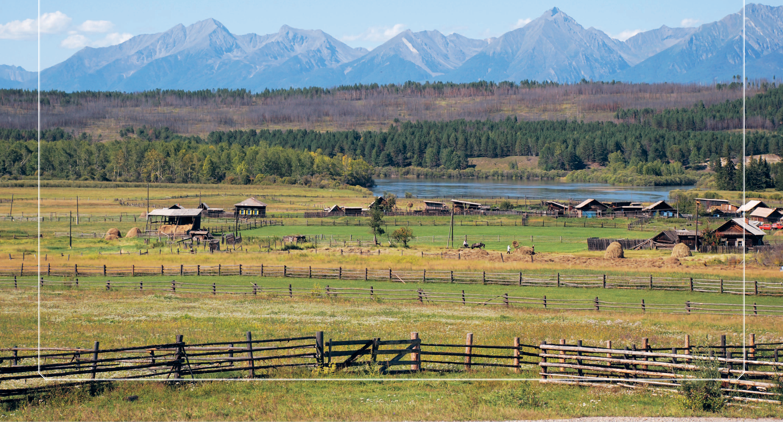
104 (9). Деревня Зактуй Тункинского района Республики Бурятия. Фото 1987 г.