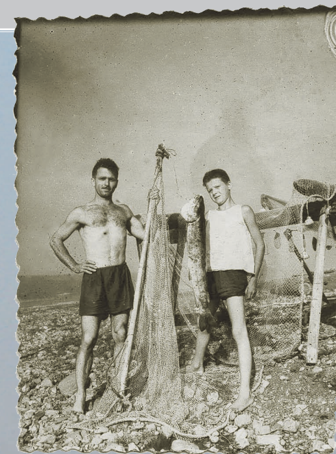
78 (9). Рыбалка на реке Ангара. Фото 1952 г.