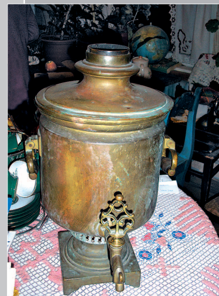
103 (9). Самовар. Село Оймур Кабанского района Республики Бурятия. Фото 1987 г.