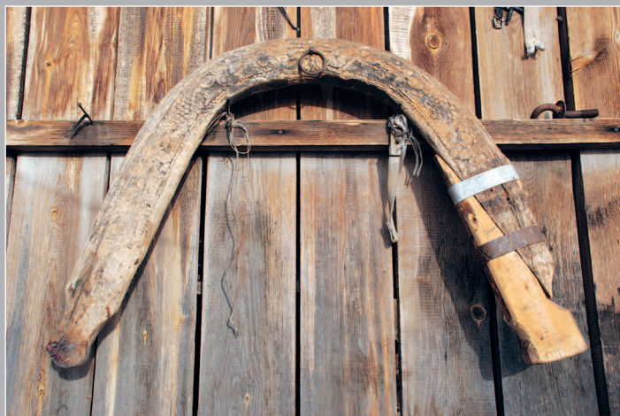
94–95 (9). Дуга — деревянная часть конской упряжи, украшенная растительным орнаментом. Посёлок Верхнемарково Усть-Кутского района Иркутской области. Фото 2001 г.