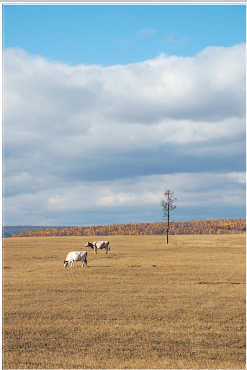
105 (9). Осенний выпас на жнивье (на поле, где сжат хлеб). Жигаловский район Иркутской области. Фото 2012 г.