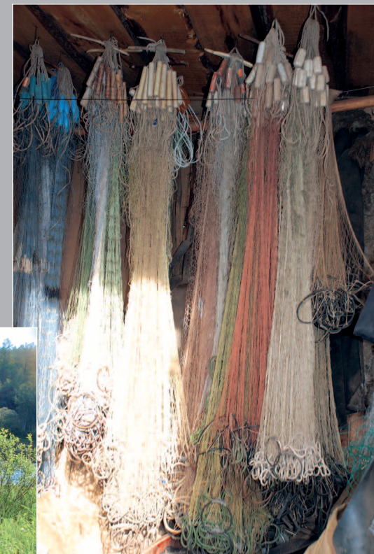
88 (9). Сушелá — приспособление из двух воткнутых в землю жердей и перекладины между ними, предназначенное для сушки рыболовных сетей. Река Мура (левый приток р. Ангары), Кежемский район Красноярского края. Фото 2005 г.