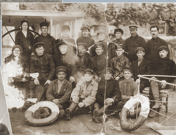
75 (9). Команда парохода «Балхаш». Фото 1960-х гг.