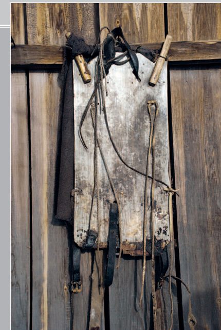
92 (9). Поняга — охотничьи носилки, надеваемые на спину, — дощечка с ремешками для укрепления груза. Село Альмовка Киренского района Иркутской области. Фото 1987 г.