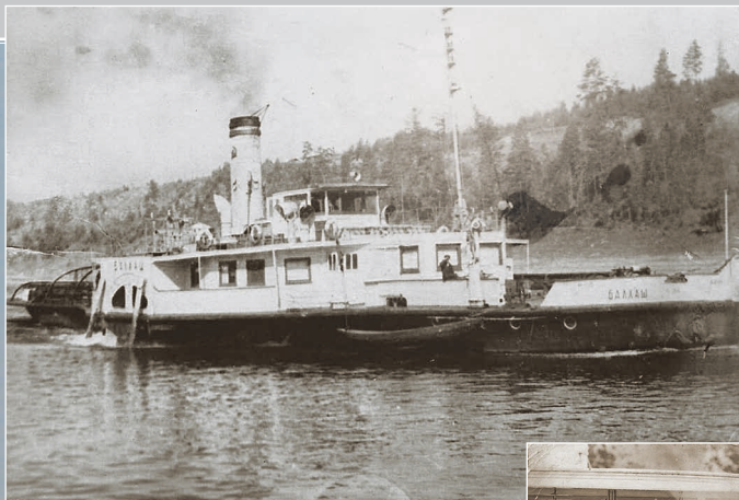
74 (9). Пароход «Балхаш». Фото 1960-х гг.