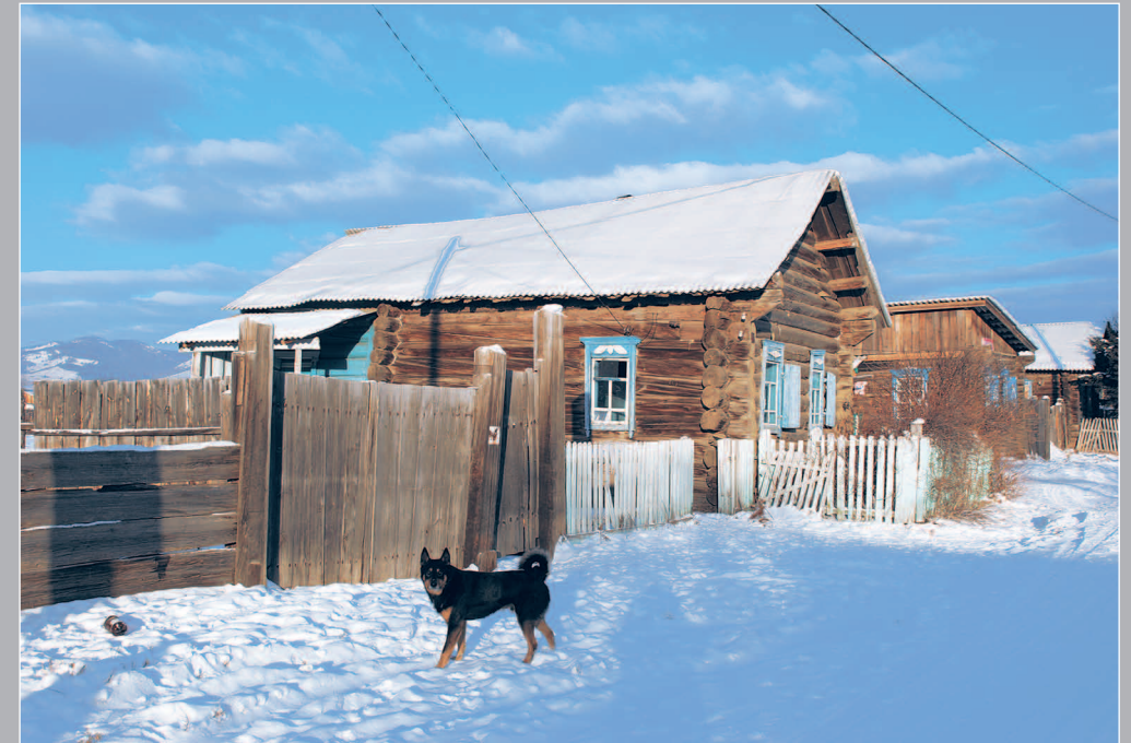
19 (9). Дом с самцовой крышей. Село Ёрлук Красночикийского района Читинской области. Фото 1995 г.