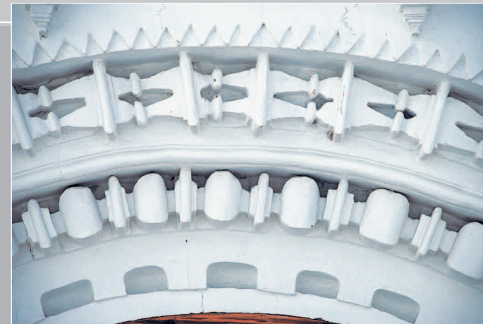
5-8 (9). Фрагменты декора (различные виды картушей) Спасо-Преображенского собора в г. Енисейск Красноярского края. Фото 2008 г.