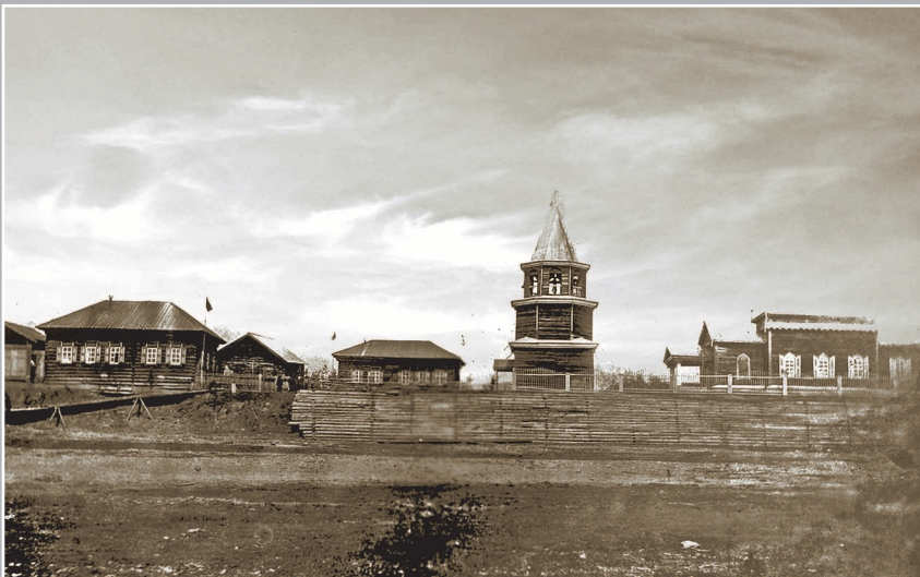
22 (9). Церковь, церковная школа и дом священника в селе Тубинском. Фото 1913 г.