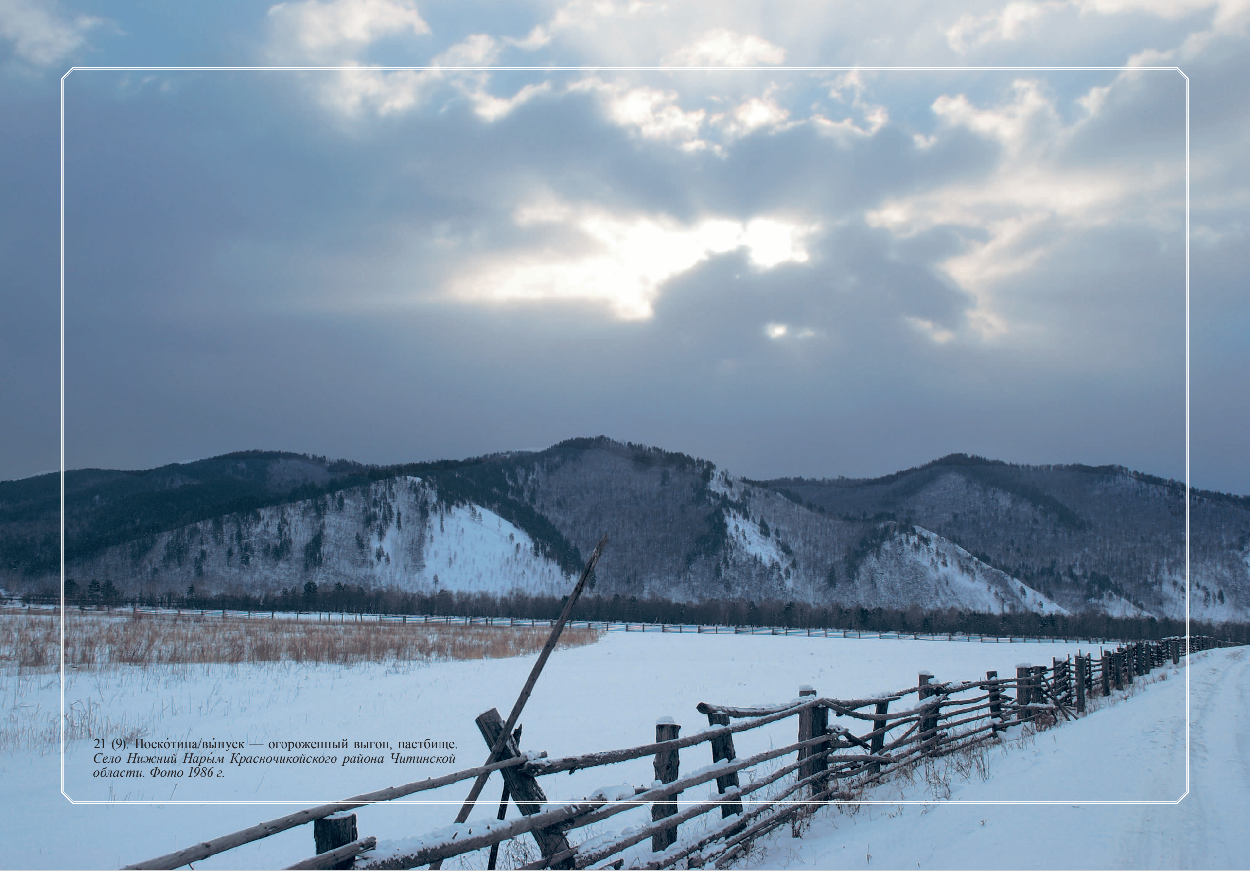
21 (9). Поскотина/выпуск — огороженный выгон, пастбище. Село Нижний Нарым Красночико́йского района Читинской области. Фото 1986 г.