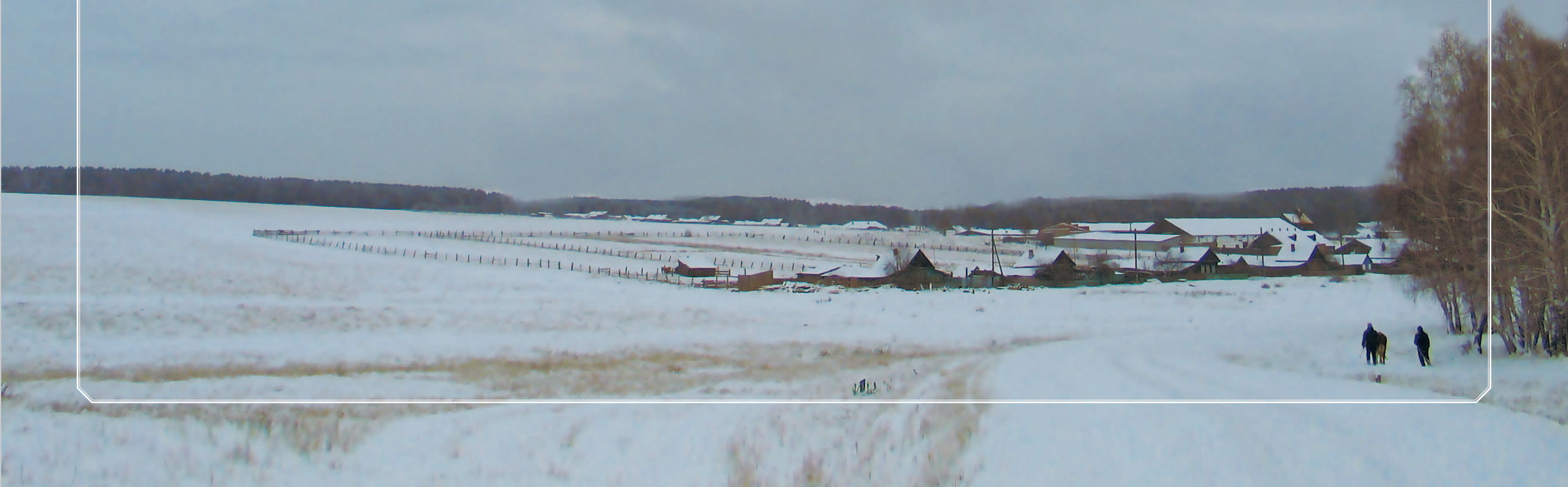
13 (9). Село Могоёнок Аларского района Иркутской области. Фото 1987 г.