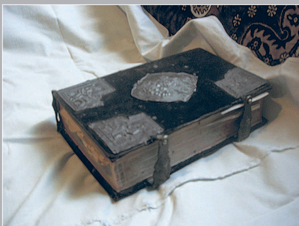
11 (9). Евангелие в бархатном окладе с металлическими чеканными накладками. Посёлок Кежма Кежемского района Красноярского края. Фото 1987 г.