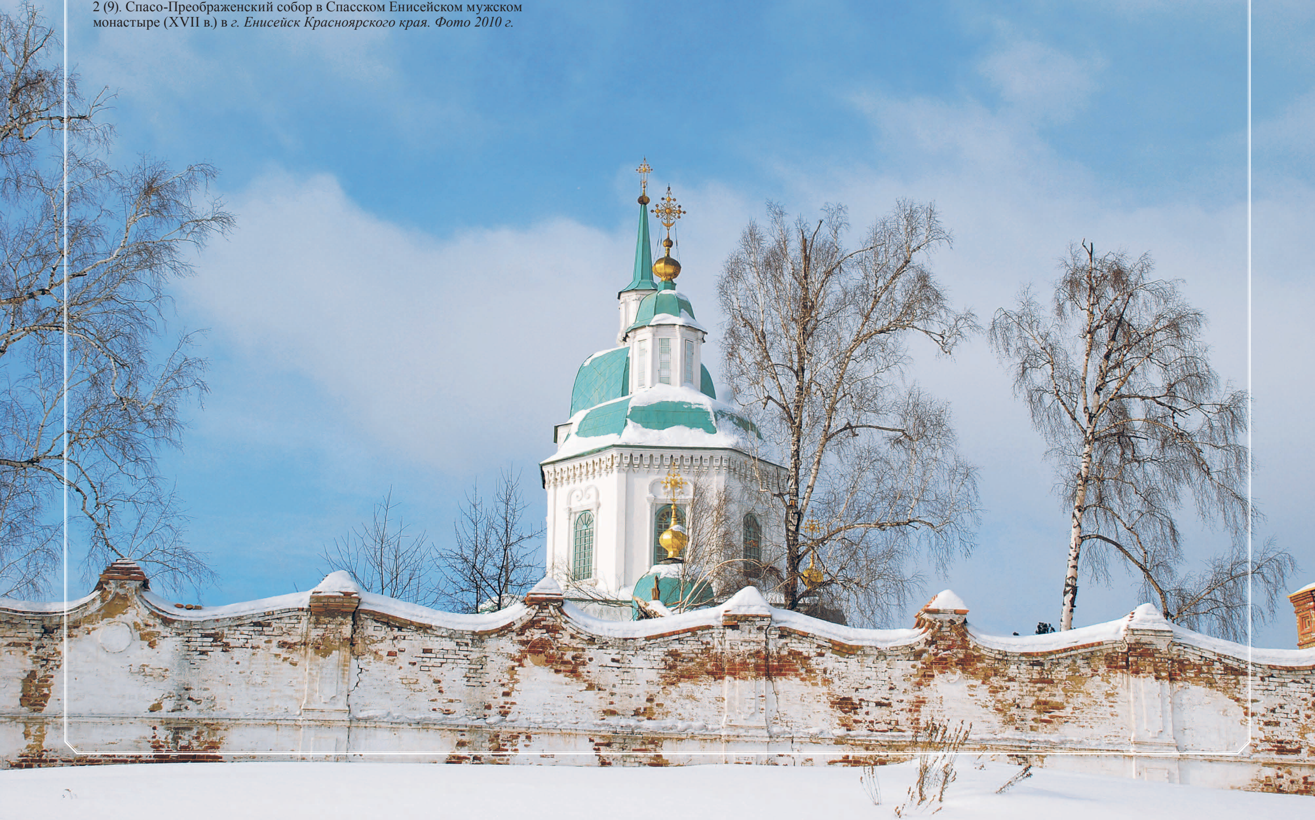
2 (9). Спасо-Преображенский собор в Спасском Енисейском мужском монастыре (XVII в.) в г. Енисейск Красноярского края. Фото 2010 г.