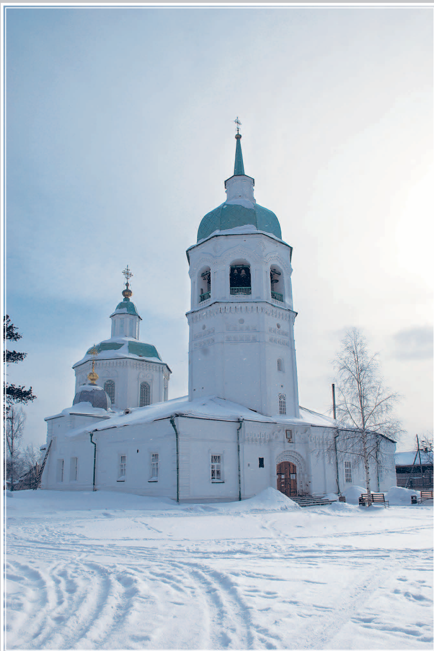
1 (9). Спасо-Преображенский собор в Спасском Енисейском мужском монастыре (XVII в.) в г. Енисейск Красноярского края. Фото 2010 г.