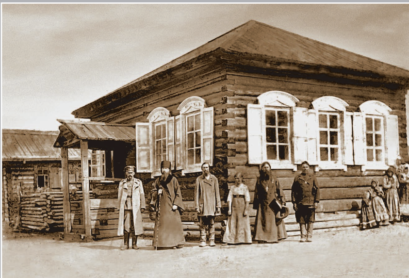
23 (9). Церковно-приходская школа в селе Кочергинском. Фото 1913 г. (ГАИО. Р-2732, оп. 1, д. 2)