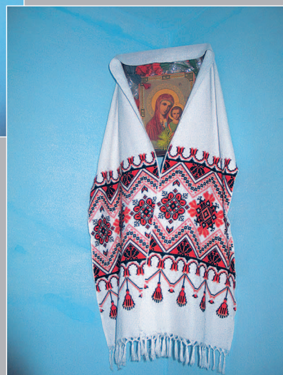
10 (9). Красный угол с иконой «Богородица Казанская» (XX в.). Село Обёр Петровск-Забайкальского района Читинской области. Фото 1986 г.