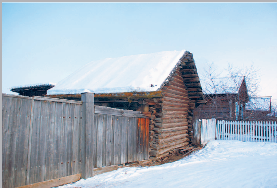
14 (9). Село Архангельское (Кочён) Красночикойского района Читинской области. Фото 1986 г.