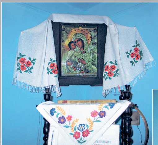
9 (9). Красный угол с иконой «Богородица Владимирская» (конец XIX – нач. XX в.). Село Турген Кыринского района Читинской области. Фото 1987 г.