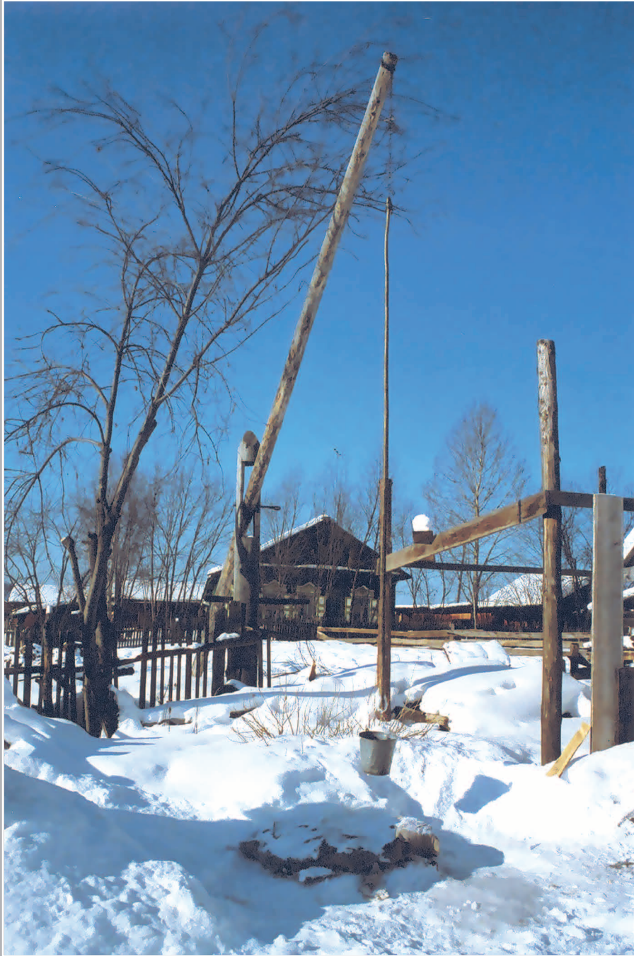
18 (9). Колодец-журавль с длинным шестом (бachelor), применяемым для подъема воды. Село Митрофаново Шилкинского района Читинской области. Фото 1994 г.