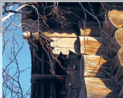
16 (9). Кокора (курица) — стропильный крюк, сделанный из корневища дерева. Село Архангельское (Кочён) Красночикойского района Читинской области. Фото 1986 г.