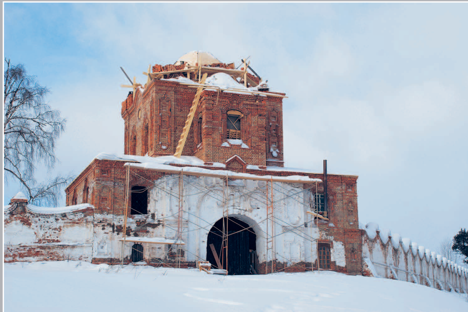
3-4 (9). Надвратная церковь Захарии и Елисаветы Спасского мужского монастыря в г. Енисейск Красноярского края (вид с юго-востока). Фото 2010 г.