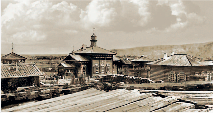
815. Церковь и школа в с. Казáчинском (на реке Киренге). Фото 1913 г. (ГАИО. Р-2732, оп. 1, д. 2)