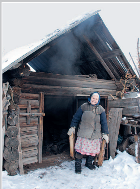
806. Баня-по-чёрному — баня, обогреваемая печью без дымохода. Село Урлук Красночико́йского района Читинской области. Фото 2010 г.