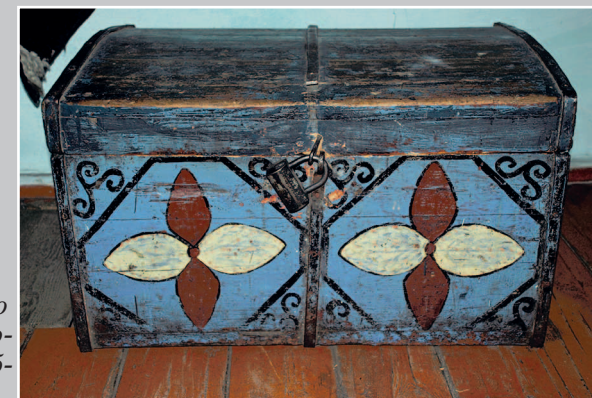
810. Расписной сундук. Село Игíрма Нижнеилимско- го района Иркутской об- ласти. Фото 1983 г.