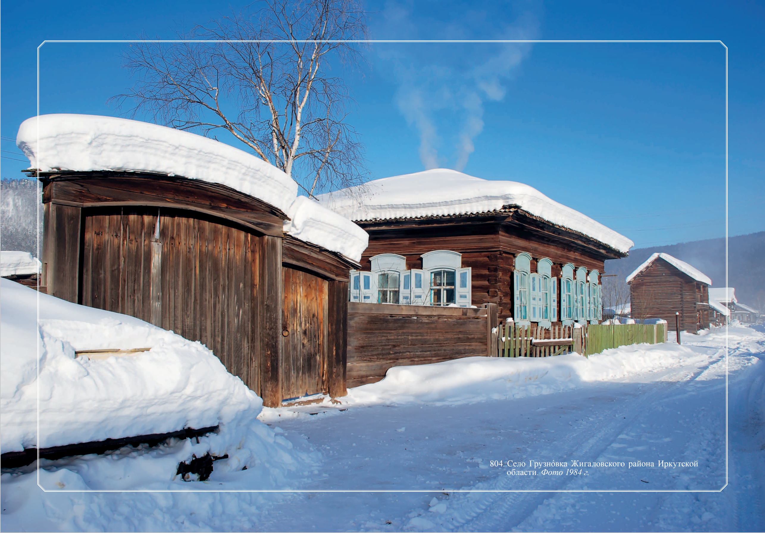
804. Село Грузнóвка Жигаловского района Иркутской области. Фото 1984 г.