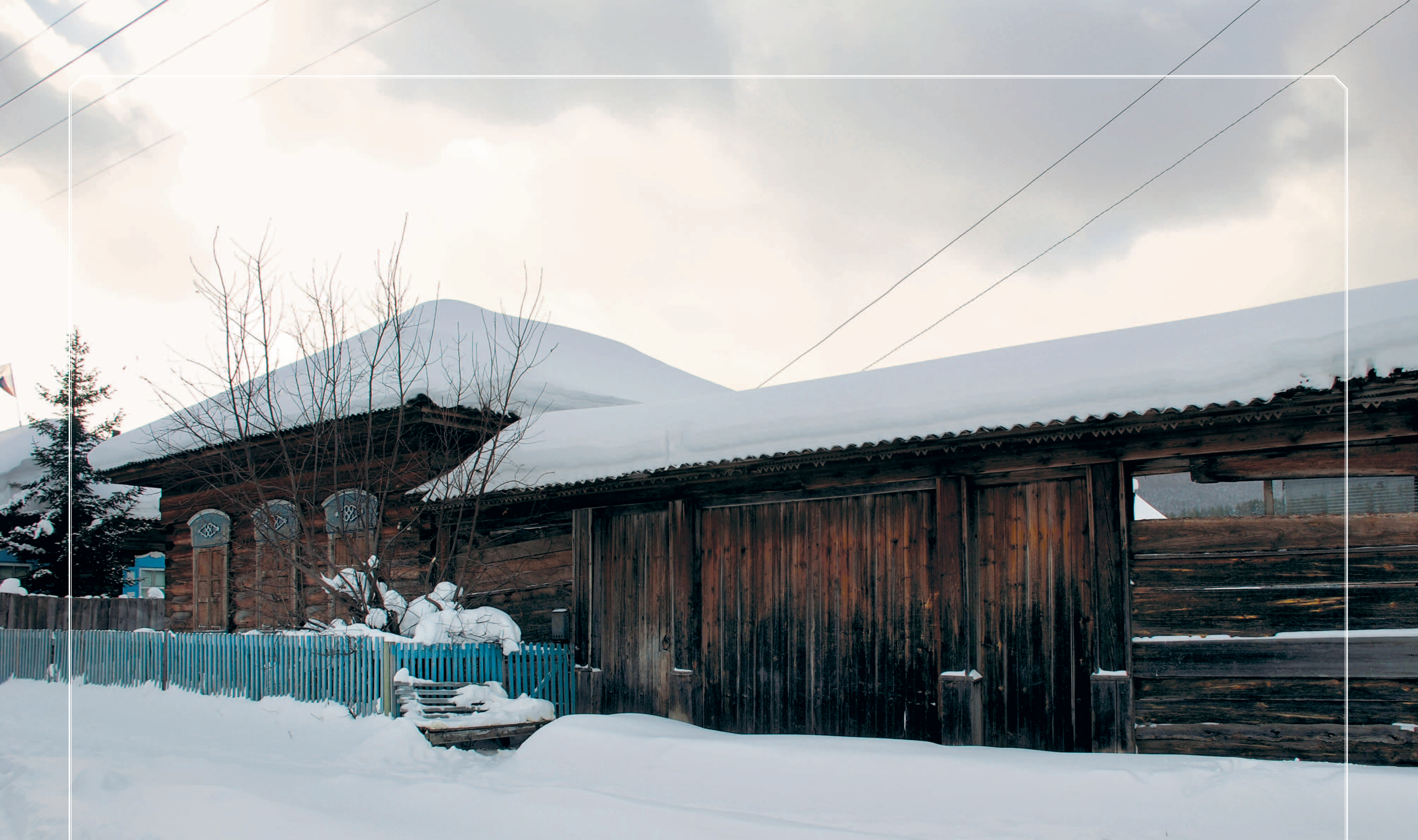
814. Дом с воротами под крышей. Село Коношаново Жигаловского района Иркутской области. Фото 1986 г.