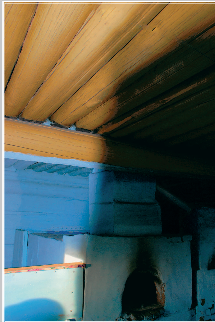
813. Внутренний вид избы с «круглым» потолком — накатником (потолком, сделанным из цельных брёвен). Село Ёрлук Красночикокойского района Читинской области. Фото 1997 г.