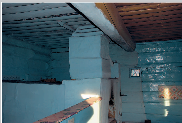
812. Внутренний вид избы с «круглым» потолком — накатником (потолком, сделанным из цельных брёвен). Село Ёрлук Красночикокойского района Читинской области. Фото 1997 г.