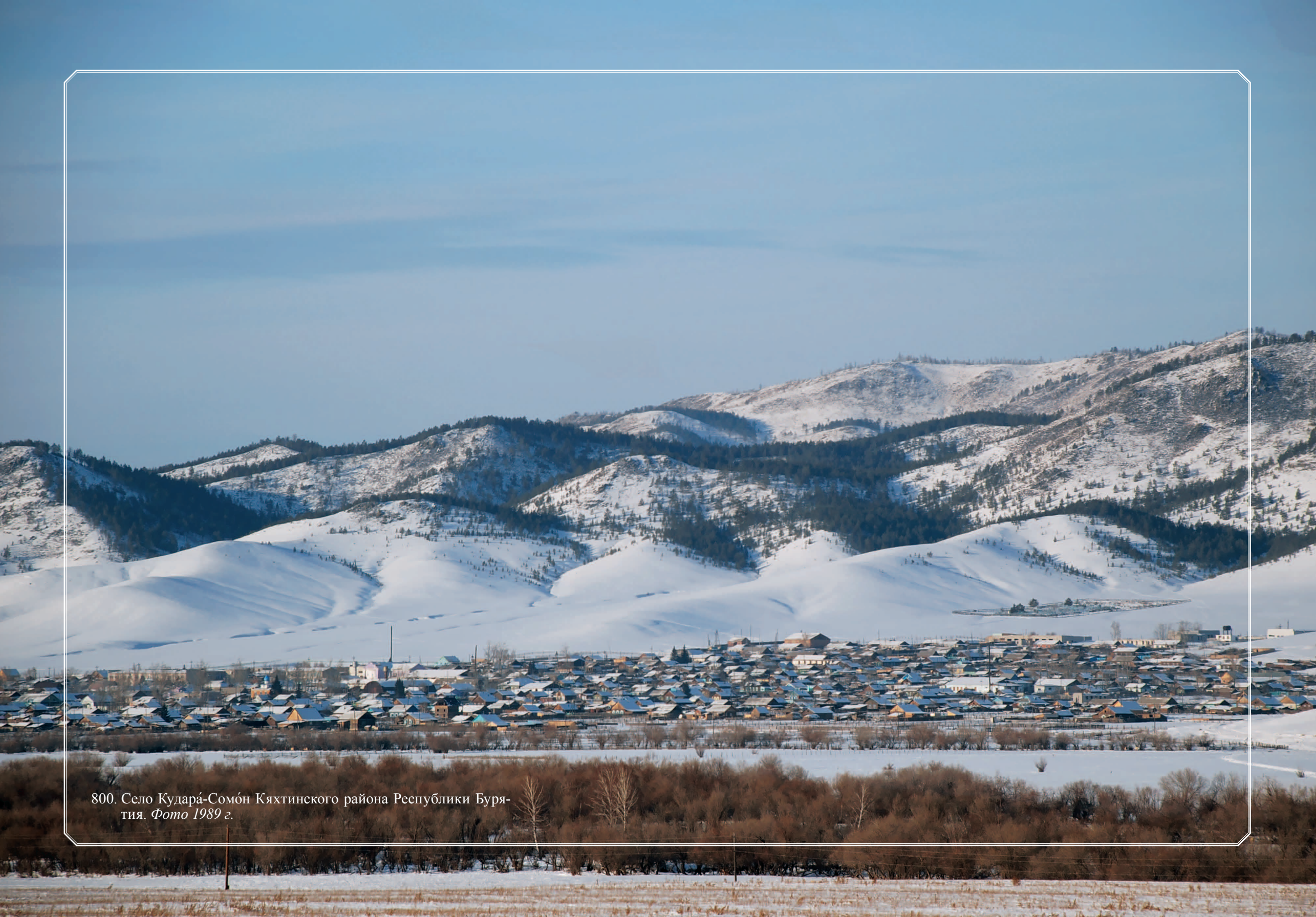
800. Село Кударá-Сомóн Кяхтинского района Республики Буря- тия. Фото 1989 г.