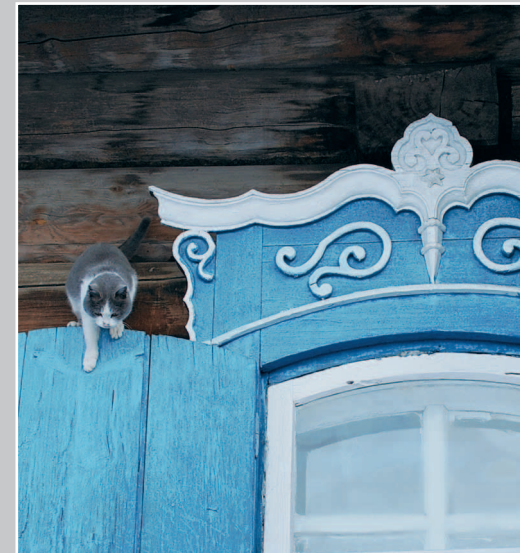
802. Фрагмент окна дома в селе Ула́дый Кяхтинского района Республики Бурятии. Фото 1985 г.