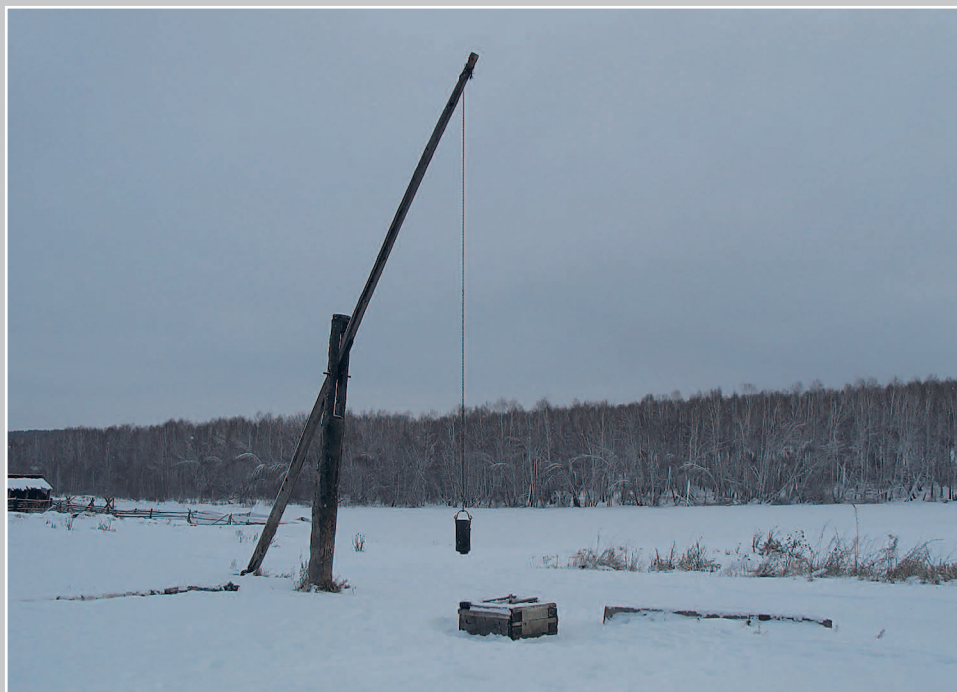
805. Колодец — журавец. Село Вóрогово Туруханского района Красноярского края. Фото 1985 г.