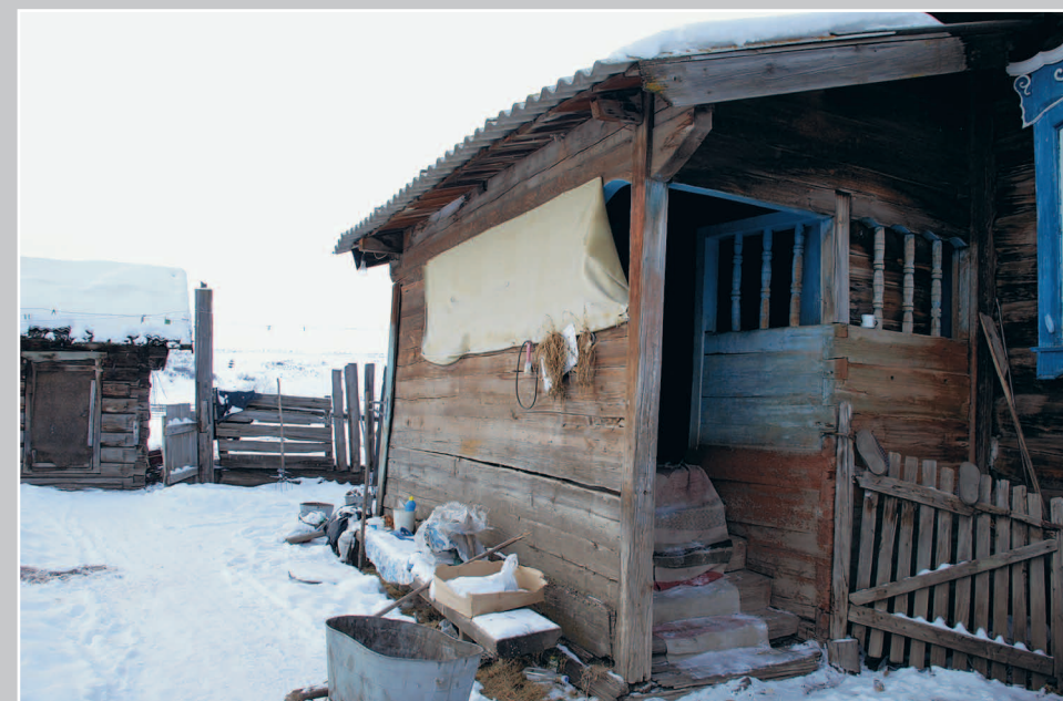
803. Крыльцо дома в селе Ула́дый Кяхтинского района Республики Бурятии. Фото 1985 г.