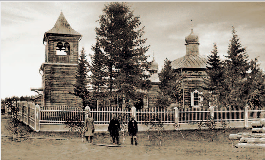
816. Церковь (село не определено). Фото 1913 г. (ГАИО. Р-2732, оп. 1, д. 2)