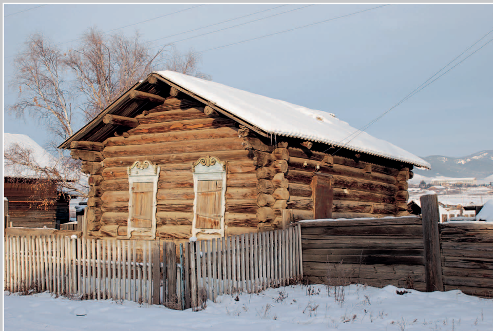
811. Дом с самцовой крышей в селе Ёрлук Красночикокойского района Читинской области. Фото 1997 г.