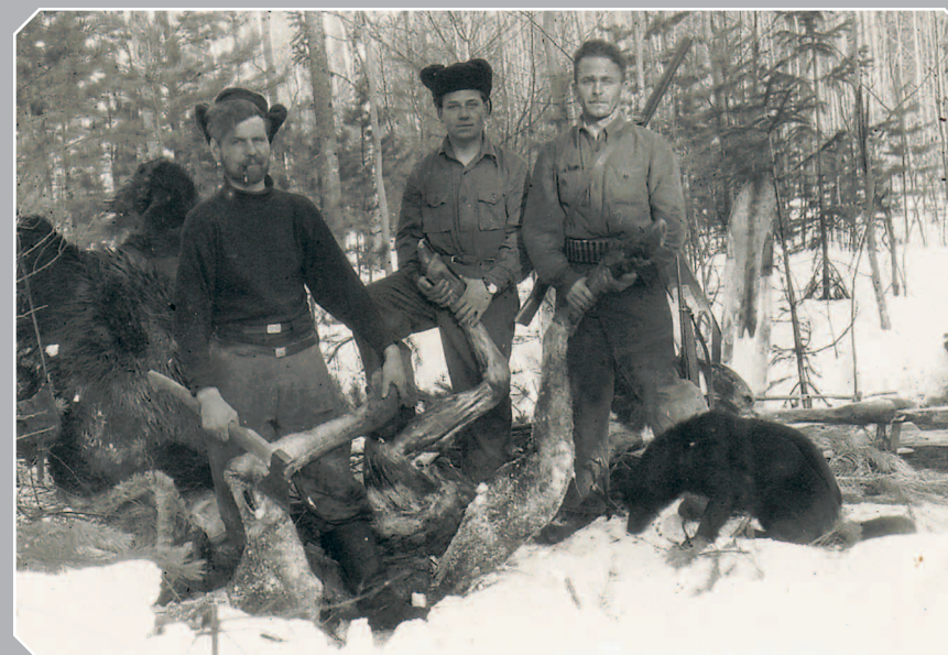
789. Удачная охота на сохатого (Богучанский район Красноярского края). Фото 1954 г.