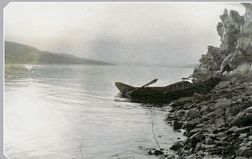
793. Ледовые заломы на реке Ангаре в период ледохода (Богучанский район Красноярского края). Фото 1952 г.