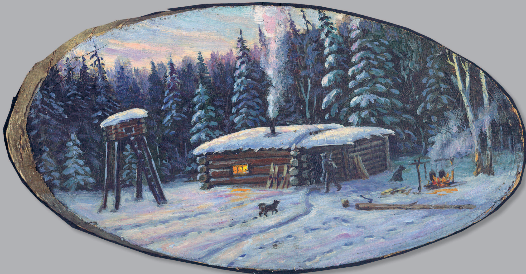
781. «Охотничье зимовье в приангарской тайге». Художник Ю. А. Панов. 1951 г.