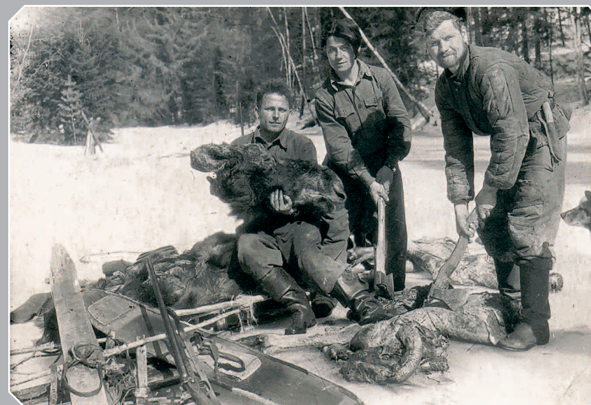
790. Артюгинские звероловы с добытым сохатым (Богучанский район Красноярского края). Фото 1954 г.