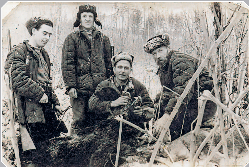
786. Добытый медведь (Богучанский район Красноярского края). Фото 1954 г.