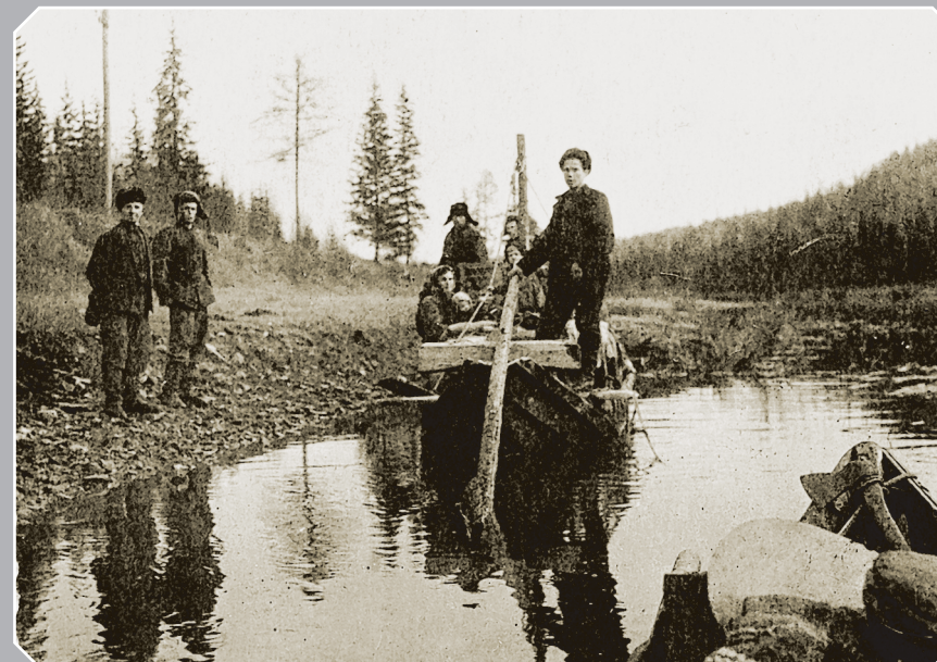
794. Плотчики (мастера, изготавливающие плоты) спускаются с верхних плотбищ по реке Артиюгинке (левый приток реки Ангара). Богучанский район Красноярского края. Фото 1952 г.