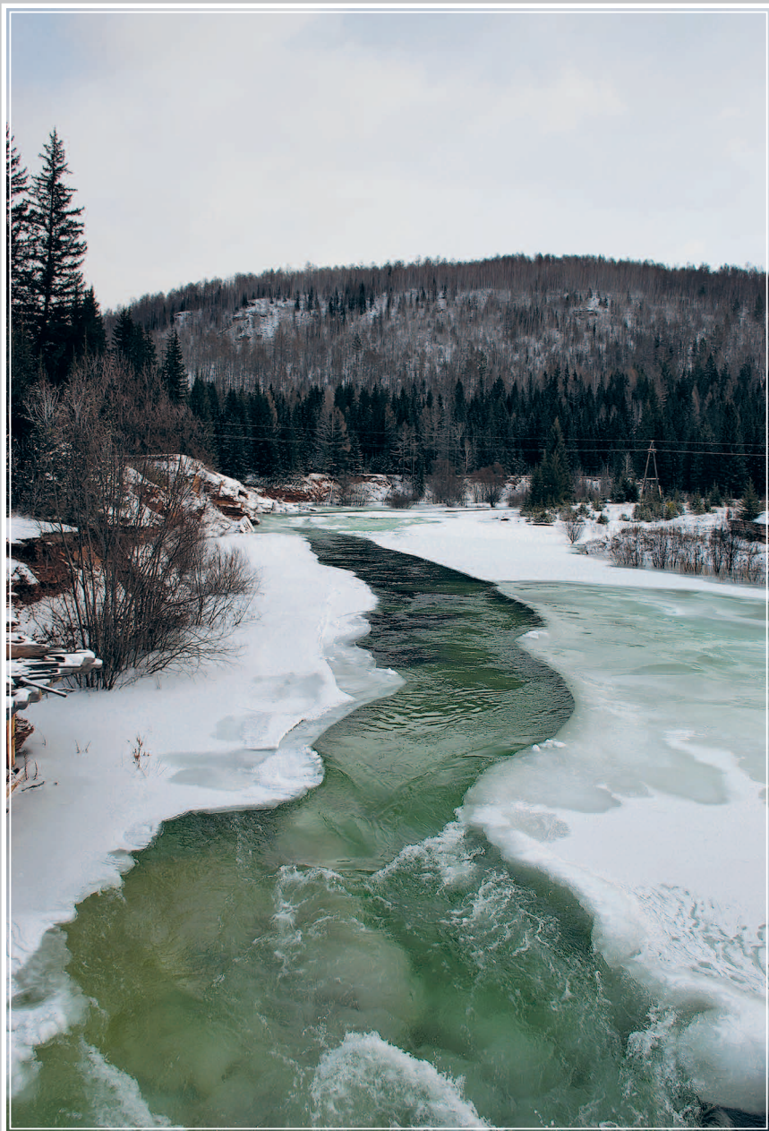
780. Река Не́вонка — правый приток реки Ангара ( Усть-Илимский район Иркутской области ). Фото 1987 г.