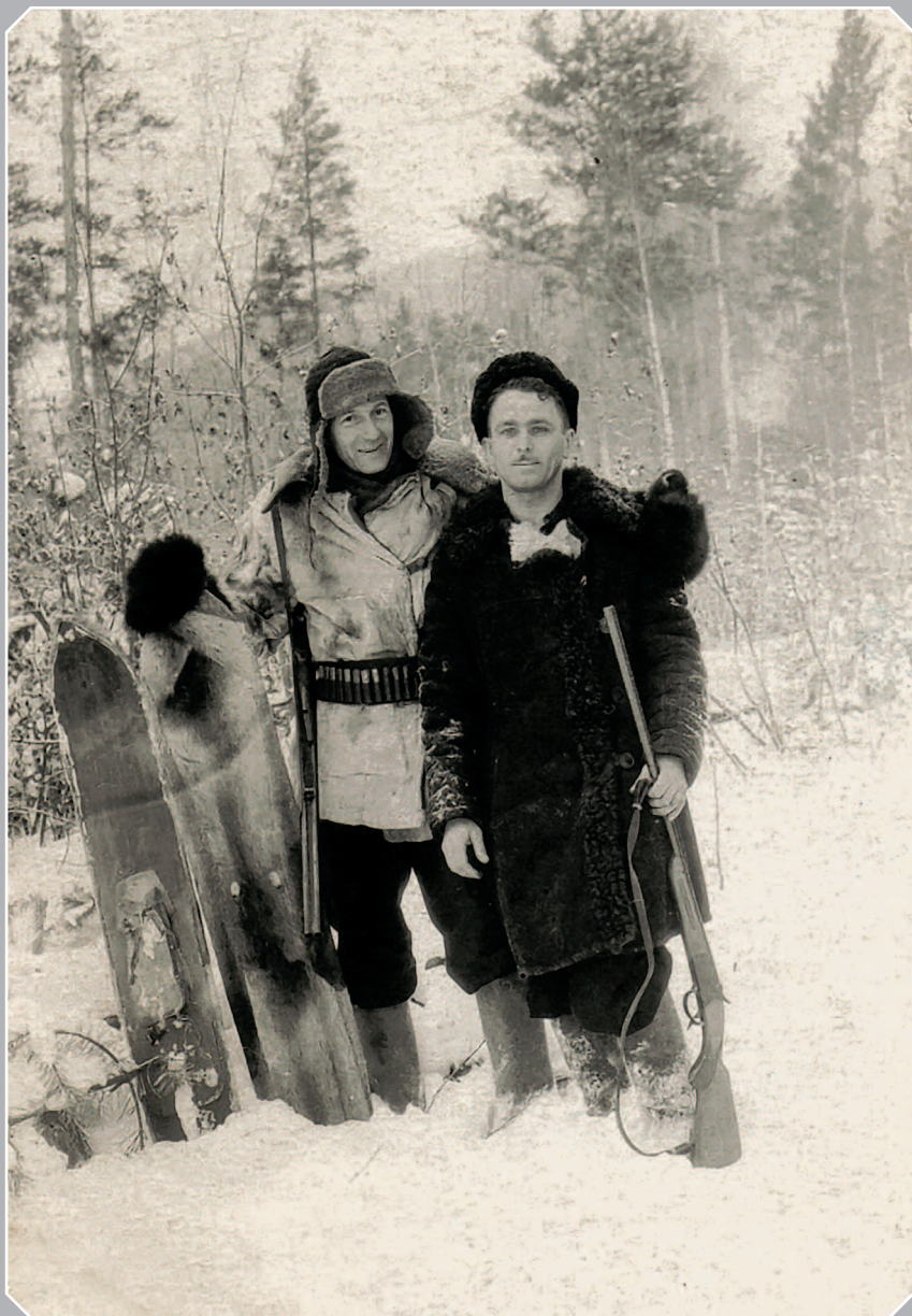
788. Камасные / подшивные лыжи — лыжи, подбитые с нижней стороны камасом (Богучанский район Красноярского края). Фото 1951 г.