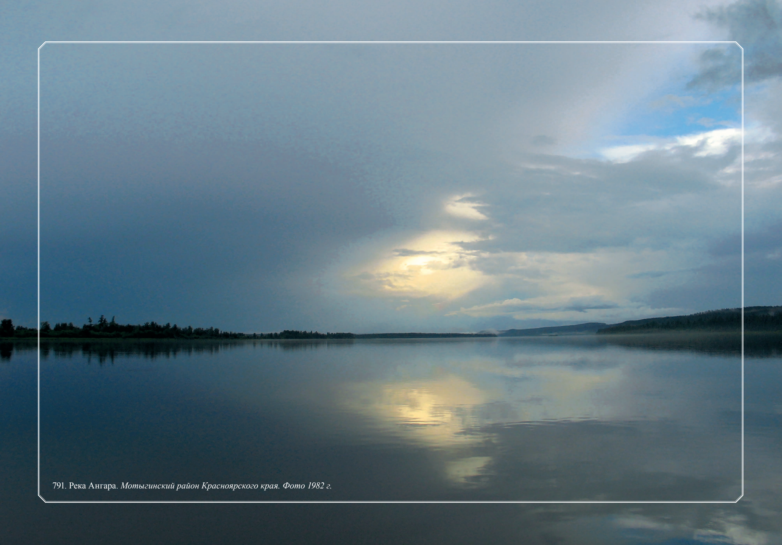
791. Река Ангара. Мотыгинский район Красноярского края. Фото 1982 г.