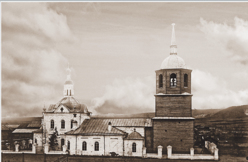
736. Покровский храм в селе Нижне-Илимском. Фото 1913 г. (ГАИО. Р-2732, оп. 1, д. 2)