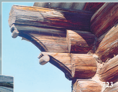
723. Пóмочи (кронштейны) — фрагмент самцового завершения дома. Село Курунзула́й Борзинского района Читинской области. Фото 1986 г.