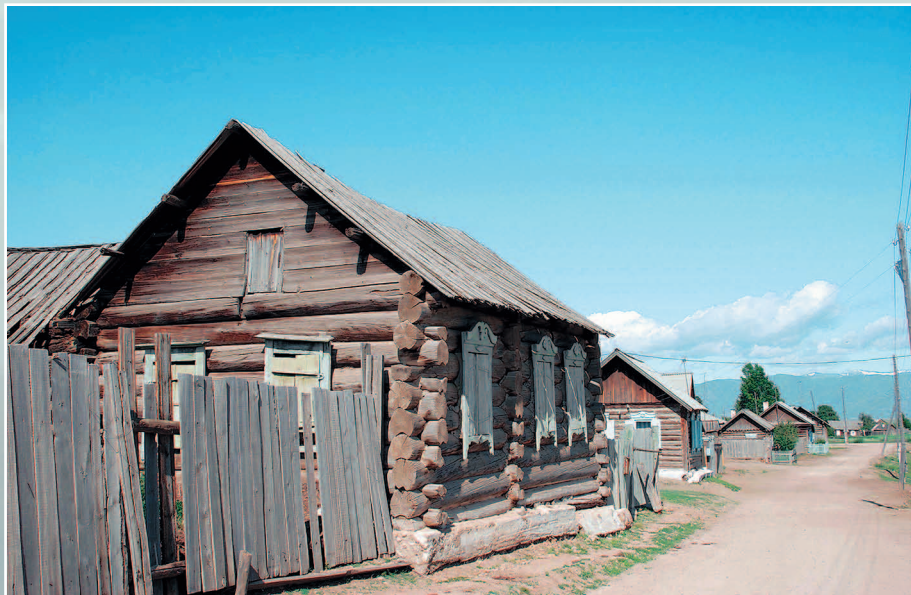
722. Дом-пятистенки, поставленный поперек улицы. Село Суво́ Баргузинского района Республики Бурятия. Фото 1985 г.