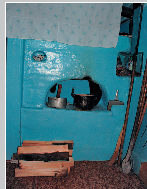
721. Русская «битая» (глинобитная) печь. Село Тергень Шелопугинского района Читинской области. Фото 1987 г.