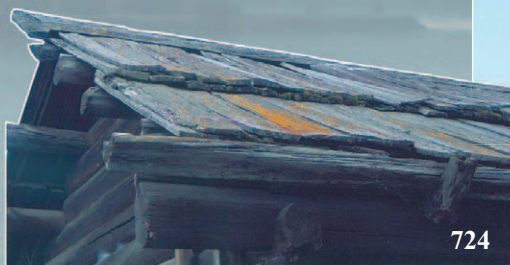
724-725. Кокора (курица) — стропильный крюк, сделанный из корневища дерева. Село Хор-Тагна́ Заларинского района Иркутской области. Фото 1989 г.