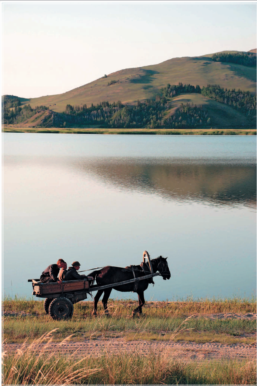
715. Одноколка — лёгкая двухколёсная тележка. Баргузинский район Республики Бурятия. Фото 1983 г.