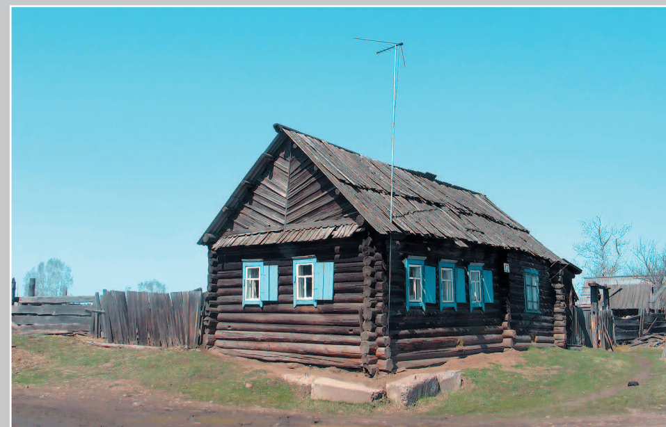
735. Дом-пятистенка под двухскатной одранённой крышей. Село Байнда Чунского района Иркутской области. Фото 1984 г.