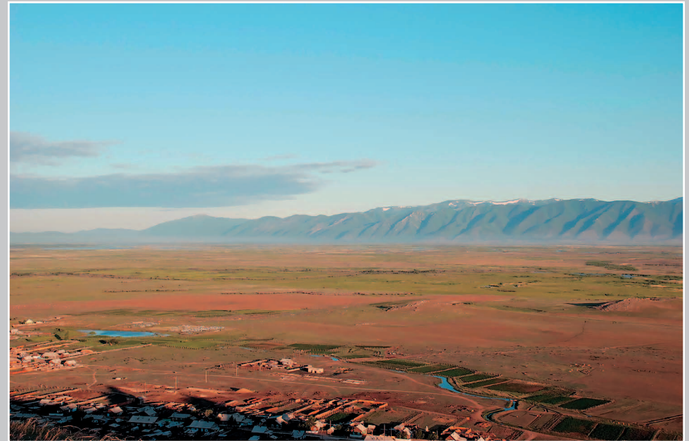
716. Баргузинская долина. Село Суво́ Баргузинского района Республики Бурятия. Фото 1984 г.