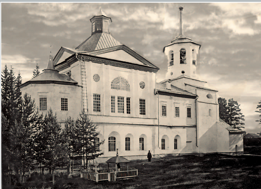
737. Троицкий собор в Киренском монастыре. Фото 1913 г. (ГАИО. Р-2732, оп. 1, д. 2)