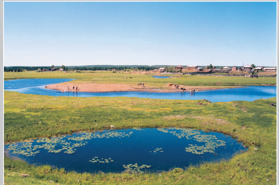
717. Село Иркине́ево Кежемского района Красноярского края. Фото 1981 г.