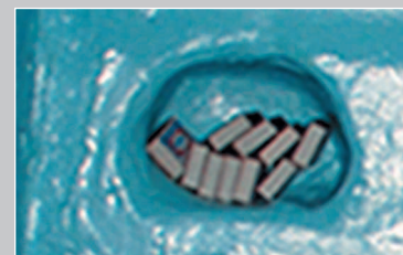
720. Печурка — углубление в наружной стене русской «битой» (глинобитной) печи для спичек, мелких вещей и т. п. Село Тергень Шелопугинского района Читинской области. Фото 1987 г.