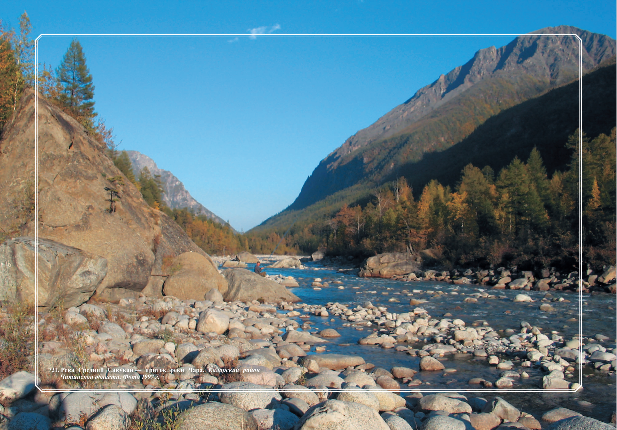
731. Река Средний Сакукан — приток реки Чара. Каларский район Читинской области. Фото 1997 г.