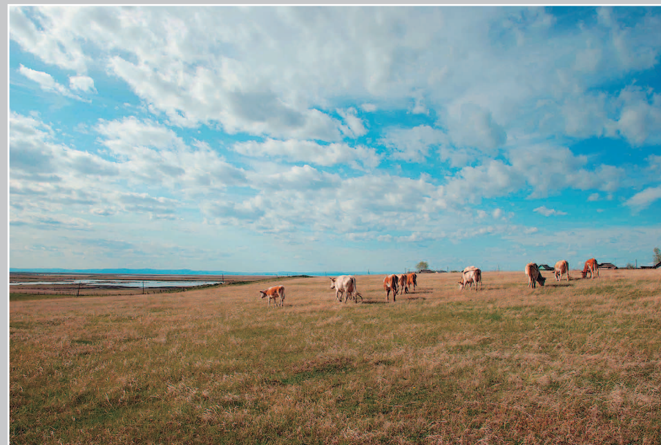
728. Село Кудея Сретенского района Читинской области. Фото 1986 г.