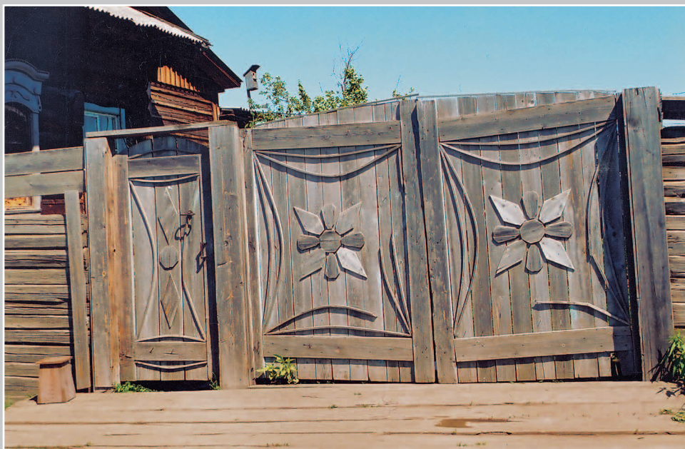
713. Трёхверейные ворота без верха с накладным лепестковым орнаментом. Село Белоярск Канского района Красноярского края. Фото 1986 г.