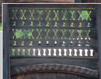
712. Трёхверейные ворота с ажурным завершением калитки. Село Кадахта Карымского района Читинской области. Фото 1987 г.