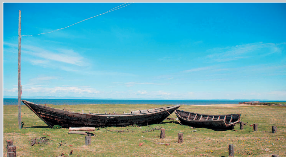
673. Лодка-неводник/неводница (слева) и лодка-подвездок (справа). Село Сухая Кабанского района Республики Бурятия. Фото 1987 г.