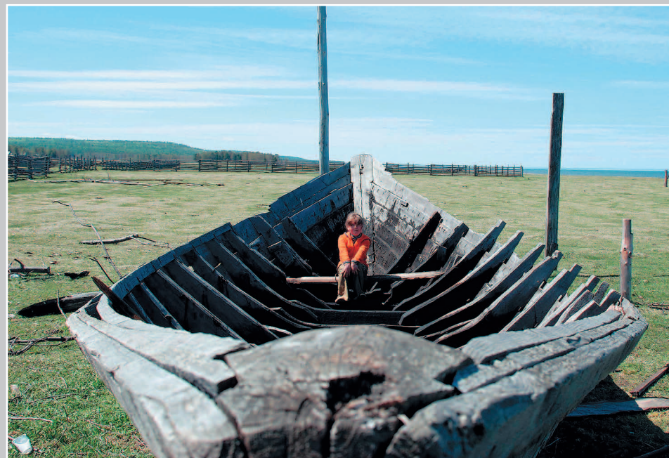
672. Лодка-неводник/неводница (лодка, с которой забрасывают невод). Село Сухая Кабанского района Республики Бурятия. Фото 1987 г.