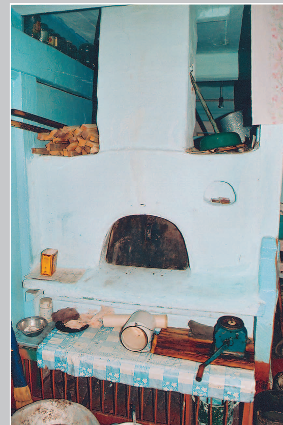
659. Русская «битая» (глинобитная) печь. Село Маргуцёк Краснокаменского района Читинской области. Фото 1985 г.