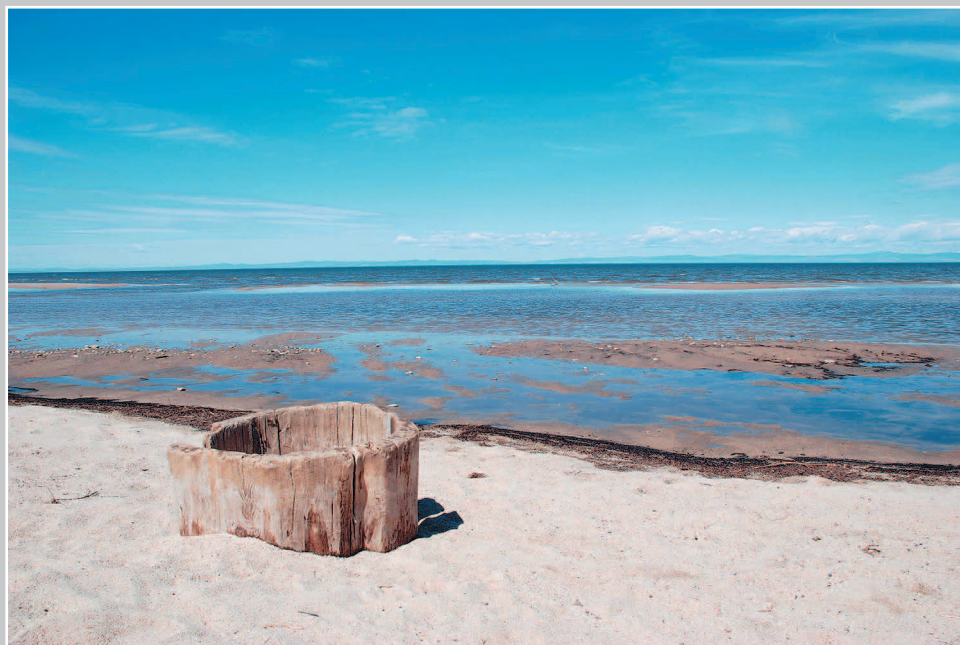
667. Долблѐнка — колодец, выдолбленный из цельного ствола лиственницы. Село Оймур Кабанского района Республики Бурятия. Фото 1983 г.