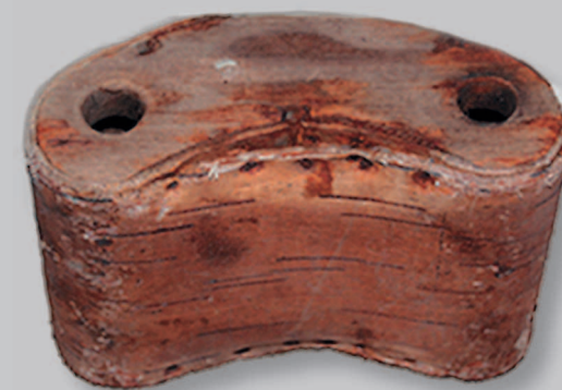
662. Бормашёлка — берестяная банка для хранения бормаша. Село Сухая Кабанского района Республики Бурятия. Фото 1987 г.