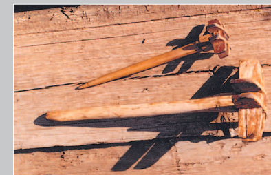
658. Бочанка — приспособление для сбивания масла. Село Могзён Хилокского района Читинской области. Фото 1986 г.