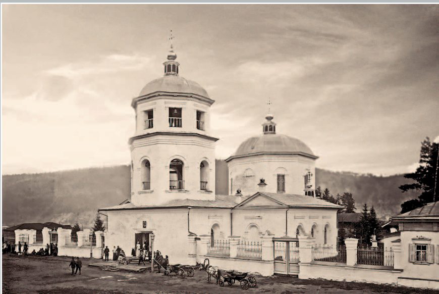
674. Спасский собор в г. Киренске. Фото 1913 г. (ГАИО. Р-2732, оп. 1, д. 2)