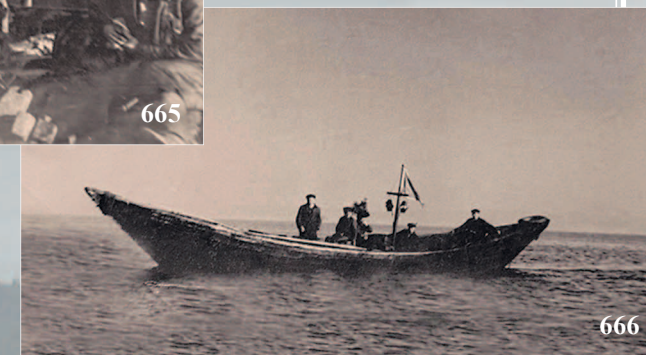
664–666. Августовский лов омуля на озере Байкал в 50-х годах XX века. Село Сухая Кабанского района Республики Бурятия