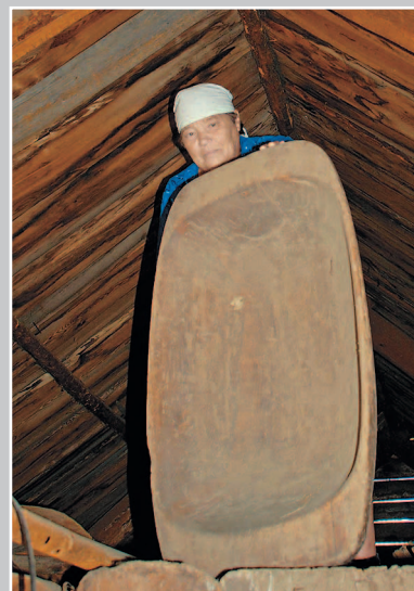
657. Долбьяшка — сѣльница, выдолбленное из кедра корыто для просеивания муки. Село Ёлкино Бaleyского района Читинской области. Фото 1985 г.