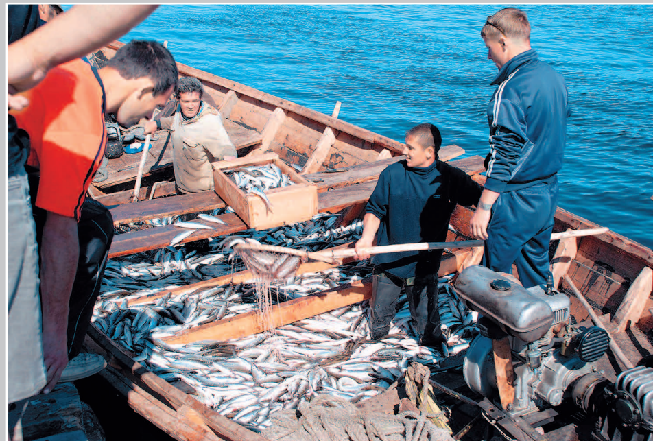
661. «Омулятники» — рыбаки, занимающиеся ловлей байкальского омуля. Посёлок Усть-Баргузин Баргузинского района Республики Бурятия. Фото 2006 г.