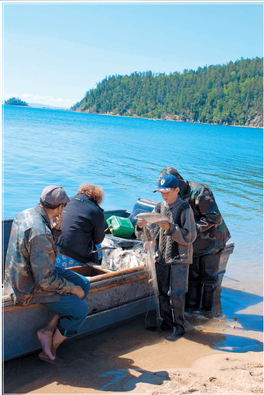
663. Возвращение с «омулёвой» рыбалки. Село Курбулик Баргузинского района Республики Бурятия (Чивырку́йский залив озера Байкал). Фото 2005 г.