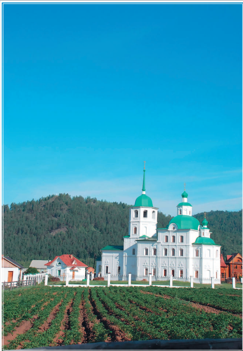
652. Сретенский женский монастырь в селе Бату́рино Прибайкаль-ского района Республики Бурятия. Фото 2006 г.