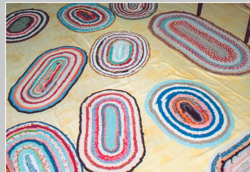
655. Узорники — коврики, вязанные из старых цветных «дранок» (лоскутков). Село Андронниково Нерчинского района Читинской области. Фото 1983 г.