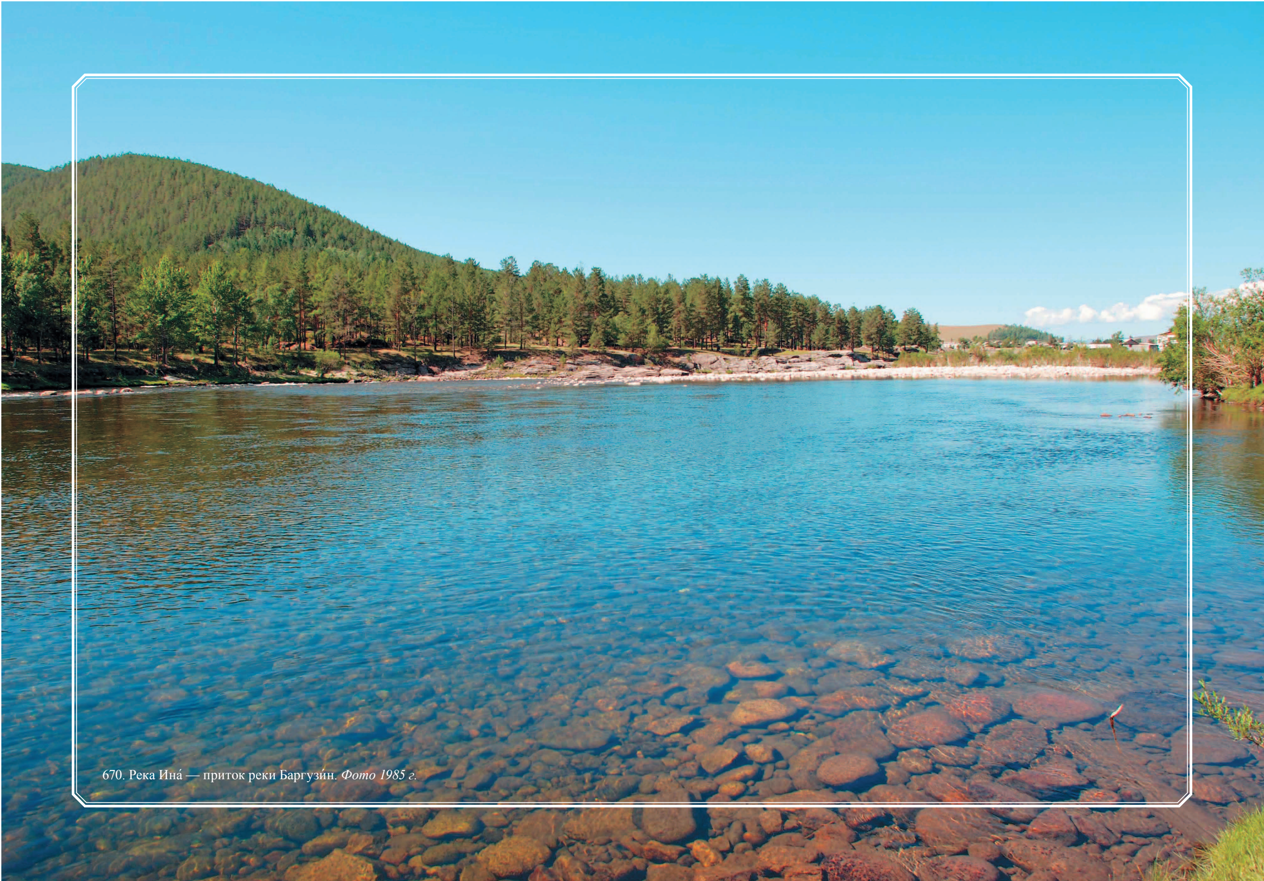
670. Река Ина́ — приток реки Баргузи́н. Фото 1985 г.