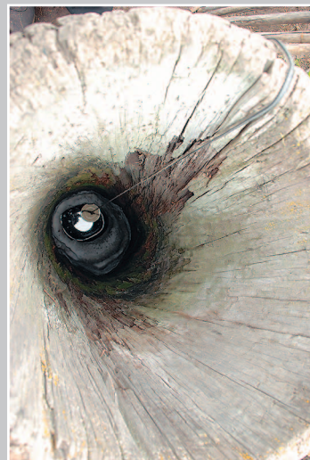
668. Фрагмент колодца-долблѐнки. Село Размахнино Шилкинского района Читинской области. Фото 1986 г.