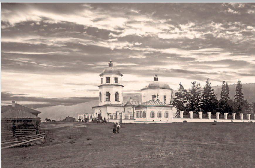
675. Спасский собор в г. Киренске. Налево причтовые постройки — диакона и псаломщика, направо — квартира для второго псаломщика. Фото 1913 г. (ГАИО. Р-2732, оп. 1, д. 2)