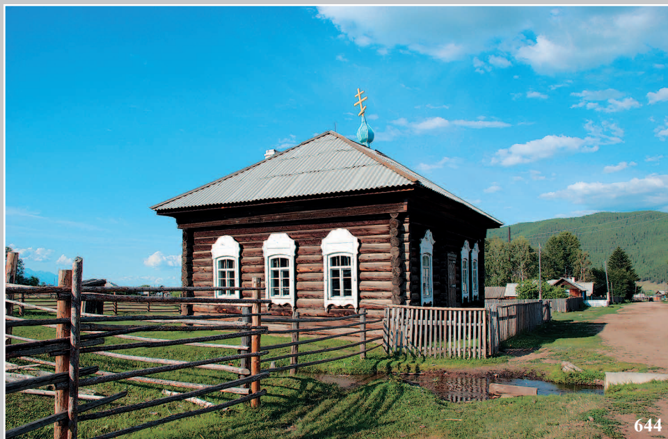
644. Село Малое Урб Баргузинского района Республики Бурятия. Фото 2001 г.