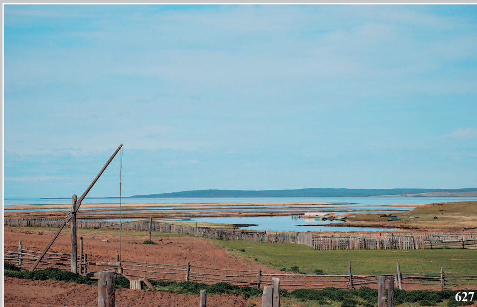
627. Село Дубініно Кабанского района Республики Бурятия. Фото 1983 г.