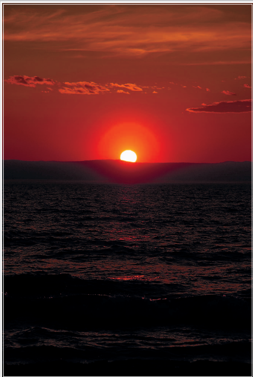
651. Закат на озере Байкал. Поселок Усть-Баргузин Баргузинского района Республики Бурятия. Фото 1983 г.