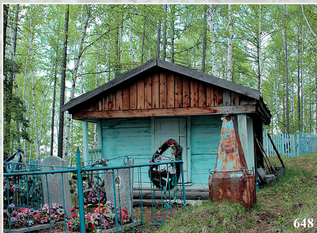
648. Погост села Гурулёво Прибайкальского района Республики Бурятия. Фото 1998 г.