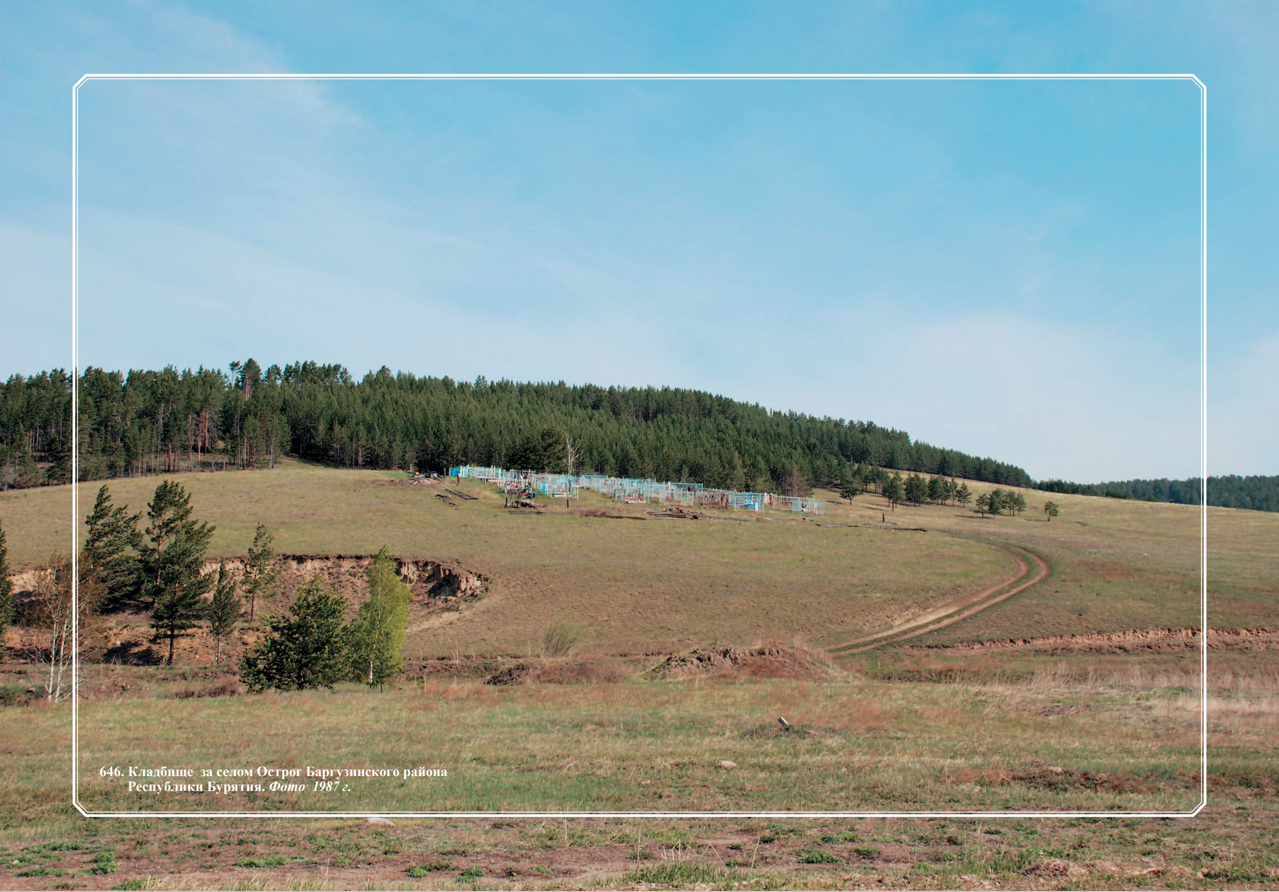
646. Кладбище за селом Острог Баргузинского района Республики Бурятия. Фото 1987 г.