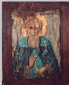
643. Икона «Святой Макарий Унженский Чудотворец (?)». Село Куряково Шелопугинского района Читинской области. Фото 1987 г.