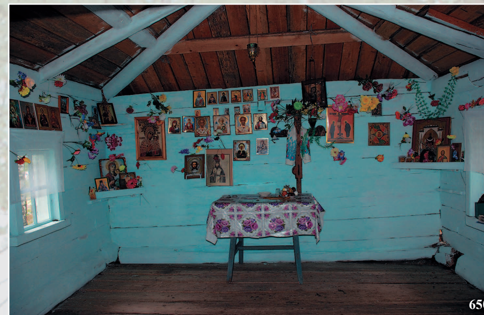
650. Интерьер кладбищенской часовни. Село Гурулёво Прибайкальского района Республики Бурятия. Фото 1998 г.