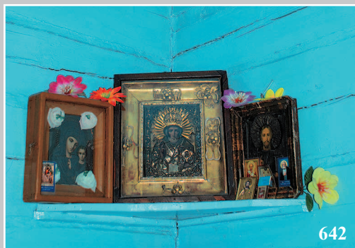
642. Красный угол. Село Газимурские Кавыкучи Газимуро-Заводского района Читинской области. Фото 1989 г.