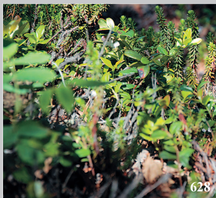
628. Шійкша — ягода, водяника сибирская. Баргузинский район Республики Бурятия. Фото 1991 г.