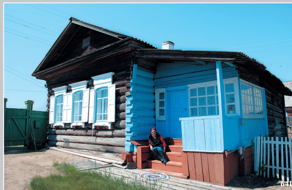
641. Ольга Григорьевна Пилюгина (1925 г. р.). Село Макарино Баргузинского района Республики Бурятия. Фото 2001 г.