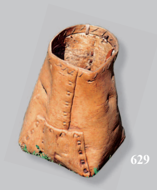
629. Биток /буяун — берестяной совок для сбора ягод. Село Россошино Баунтовского района Республики Бурятия. Фото 1985 г.