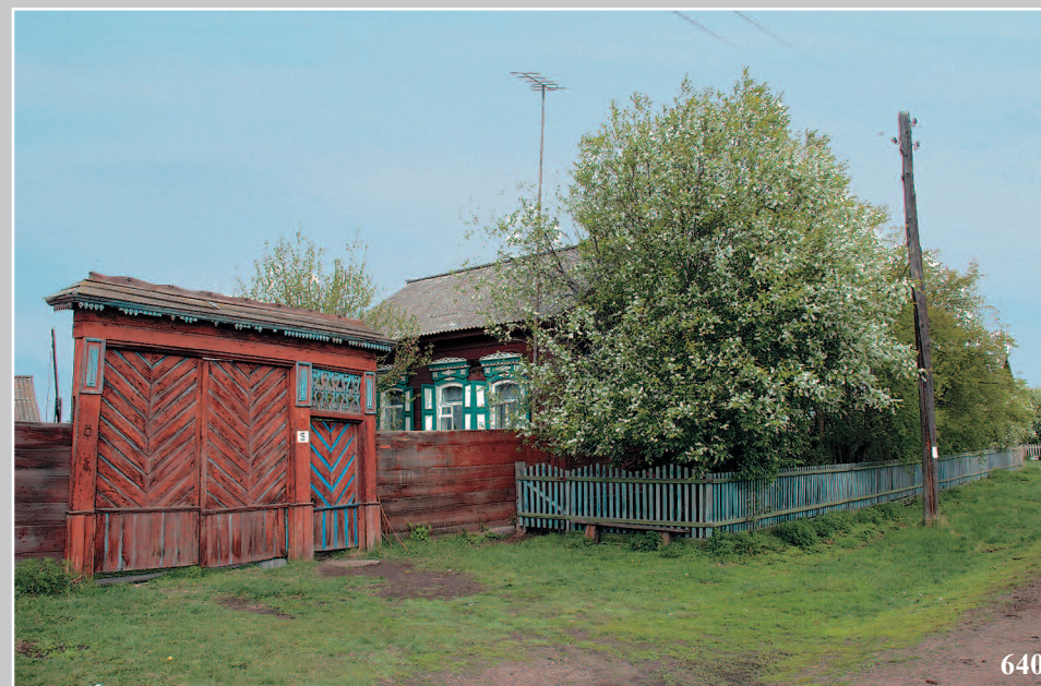
640. Дом в селе Кóлесово Кабанского района Республики Бурятия. Фото 2007 г.