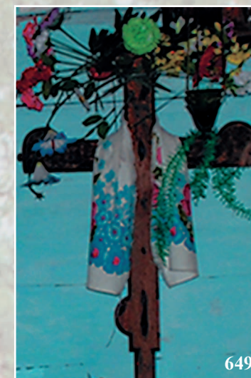
649. Фрагмент убранства интерьера кладбищенской часовни (крест). Село Гурулёво Прибайкальского района Республики Бурятия. Фото 1998 г.