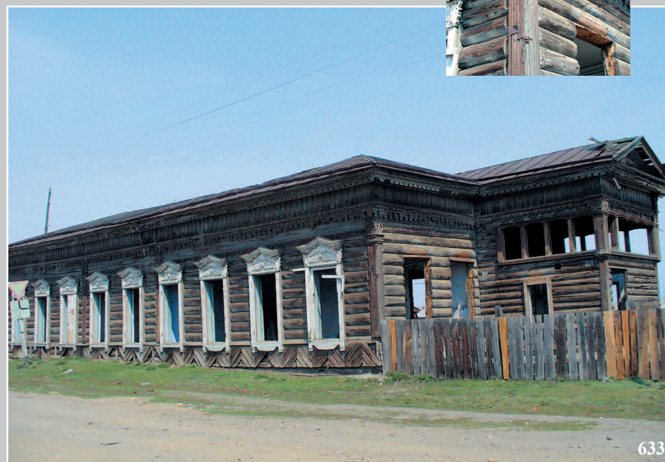
633. Дом в селе Тунка́ Тункинского района Республики Бурятия. Фото 1998 г.