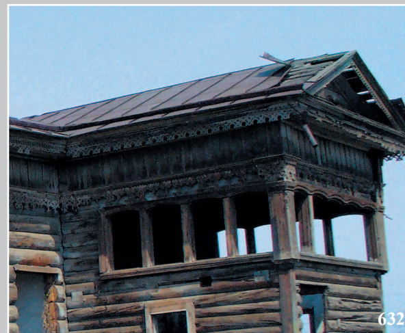
632. Фрагмент дома в селе Тунка́ Тункинского района Республики Бурятия. Фото 1998 г.