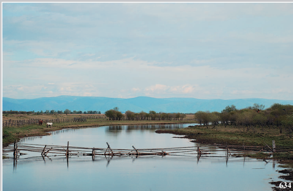
634. Водяник — изгородь через реку, служащая преградой для скота. Село Байкало-Кударá Кабанского района Республики Бурятия. Фото 1987 г.