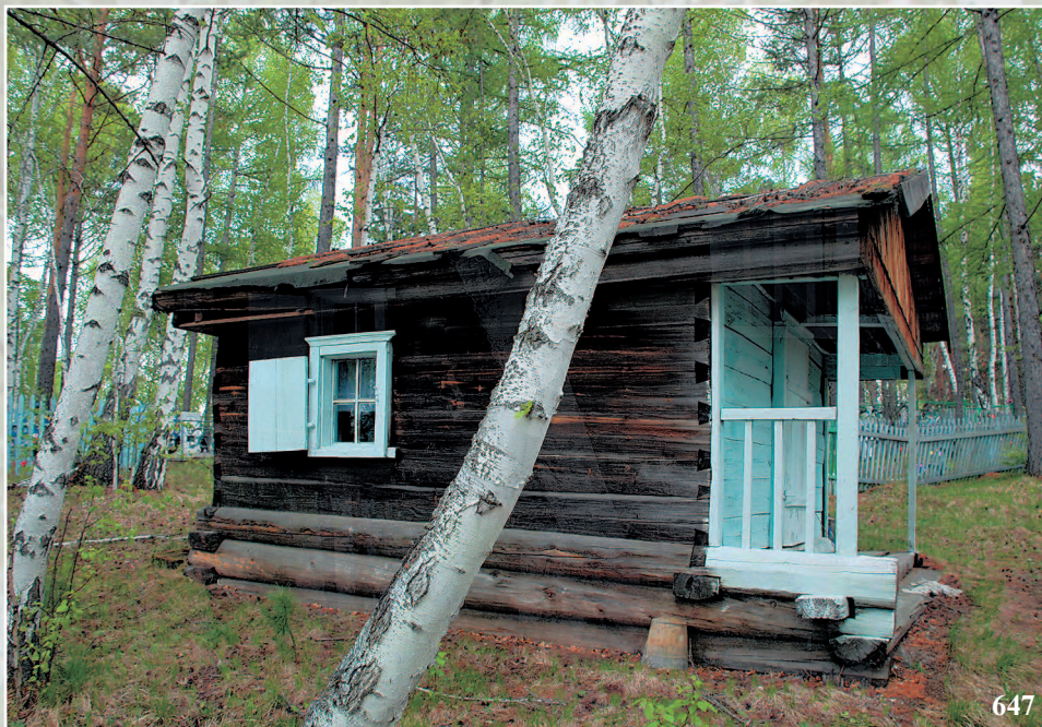
647. Кладбищенская часовня. Село Гурулёво Прибайкальского района Республики Бурятия. Фото 1998 г.