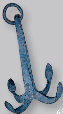
635. Кованый якорь. Село Оймур Кабанского района Республики Бурятия. Фото 1989 г.