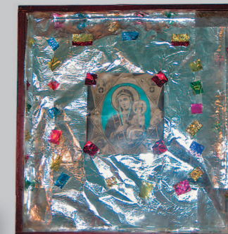
621. Икона «Богоматерь Неопалимая Купина». Могойто Курумканского района Республики Бурятия. Фото 1989 г.