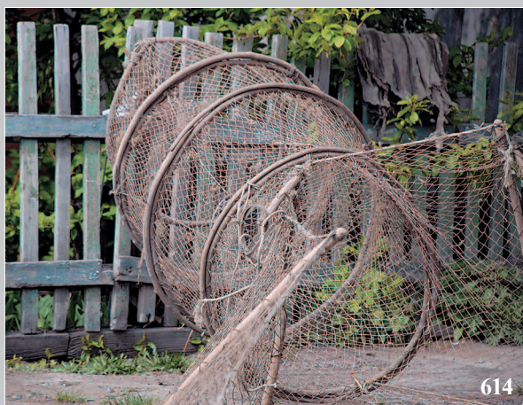
614. Мотня невода (средняя часть невода в виде мешка). Село Жилино Кабанского района Республики Бурятия. Фото 2005 г.