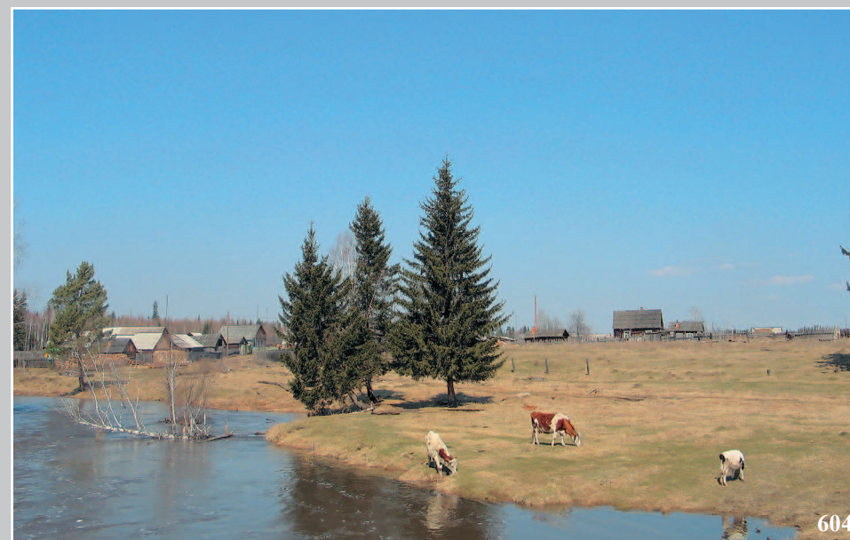
604. Село Байнда. Чунский район Иркутской области. Фото 1986 г.