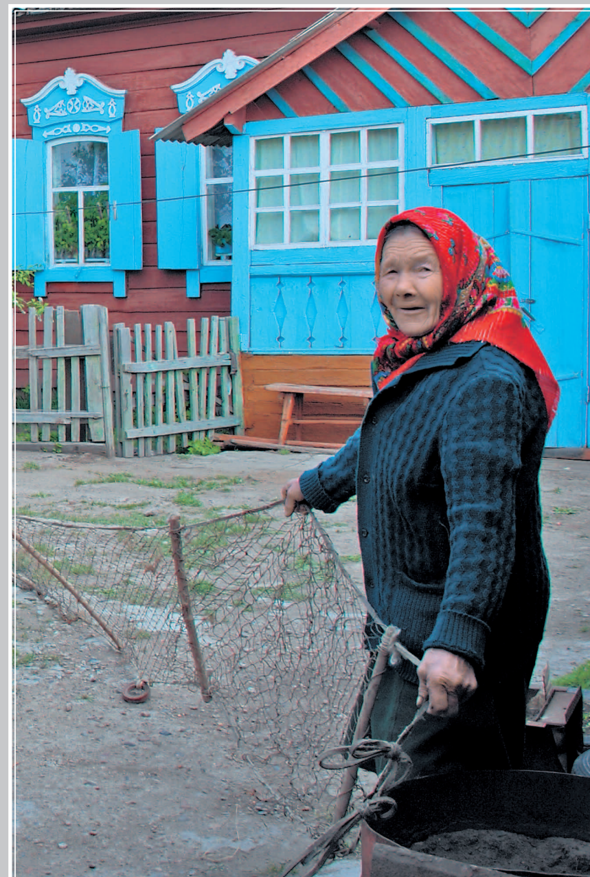
615. Стенка невода. Село Жилино Кабанского района Республики Бурятия. Фото 2005 г.