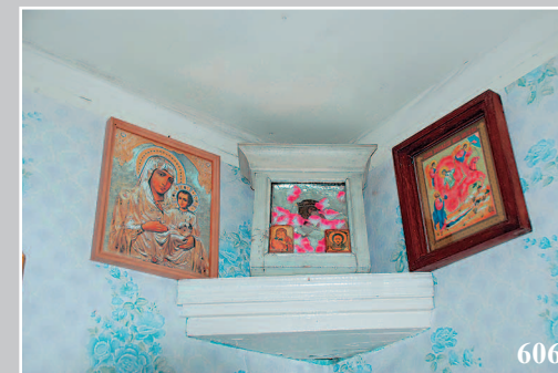
606. «Цветной» угол. Село Акима Тунгокоченского района Читинской области. Фото 1987 г.