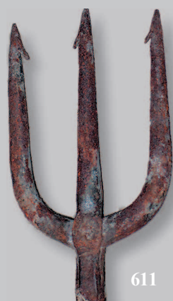
611. Кованая острога. Село Манзя Мотыгинского района Красноярского края. Фото 1982 г.