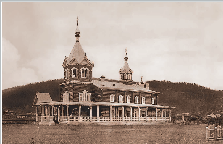
625. Алексеевская церковь в Киренском монастыре. Фото 1913 г. (ГАИО. Р-2732, оп. 1, д. 2).