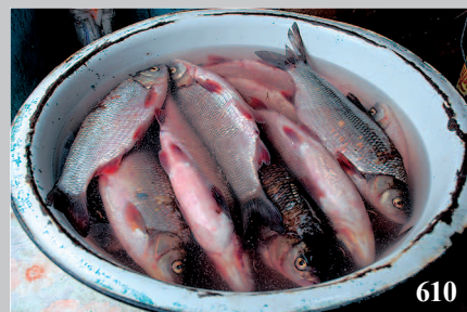
610. Язи, пойманные в реке Селенга. Село Фёфаново Кабанского района Республики Бурятия. Фото 1986 г.