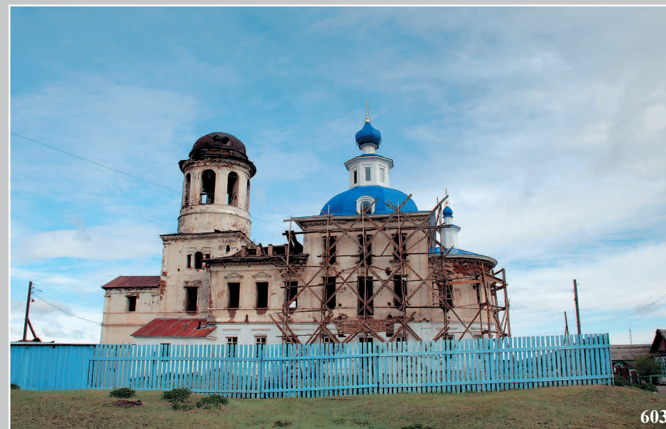
603. Казанская церковь в село Творогово Кабанского района Республики Бурятия. Фото 2008 г.