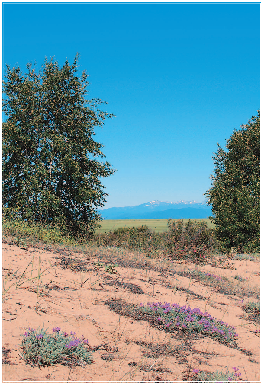
601. Баргузинская долина. Фото 1986 г.