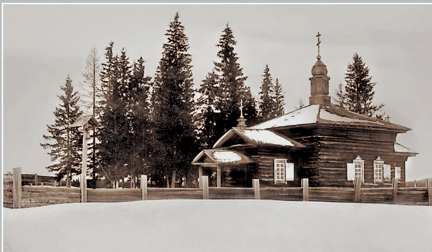
624. Михаило-Архангельский храм в селении Нижне-Корелинском (40 верстах от г. Киренска, в верховьях р. Нижней Тунгуски). Фото 1913 г. (ГАИО. Р-2732, оп. 1, д. 2).