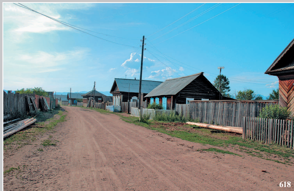
618. Село Большое Урѳ Баргузинского района Республики Бурятия. Фото 1987 г.