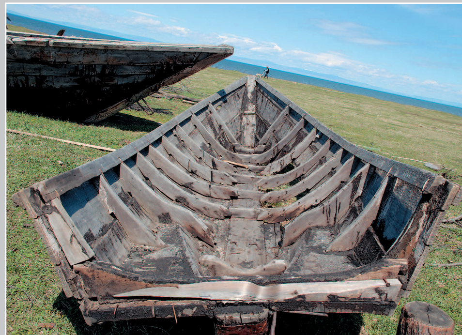
612. Лодка-неводник/неводница (лодка, с которой забрасывают невод). Село Сухая Кабанского района Республики Бурятия. Фото 2002 г.