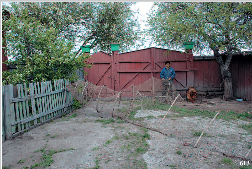
613. Невод. Село Жилино Кабанского района Республики Бурятия. Фото 2005 г.