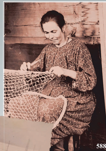
588. Починка невода. Село Сухая Кабанского района Республики Бурятия (из семейного архива Л.И. Шелковниковой). Фото 1958 г.