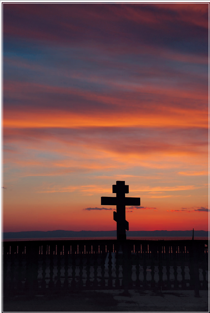
600. Крест на берегу озера Байкал. Село Посольское Кабанского района Республики Бурятия. Фото 1984 г.