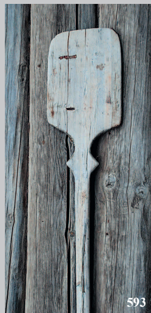
593. «Хлебная» лопата. Село Удинск Балейского района Читинской области. Фото 1981 г.