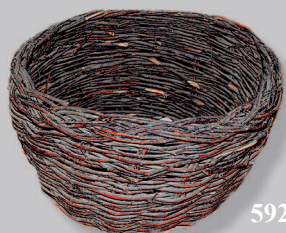
592. Пестёрь — плетёная из тальника корзина. Село Красный Чикой Красночикойского района Читинской области. Фото 2005 г.