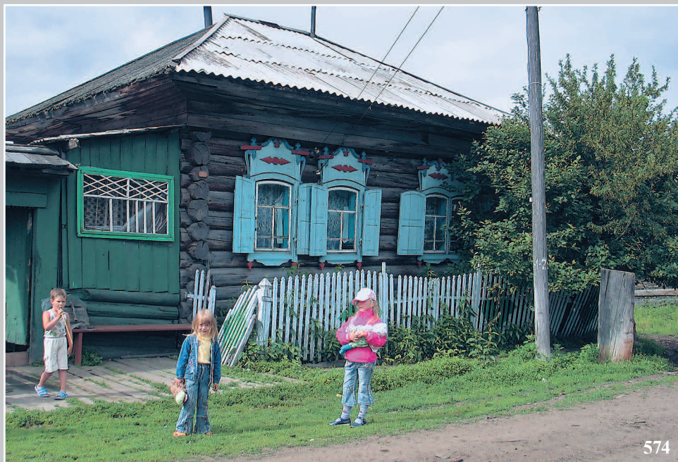
574. Дом с четырёхскатной крышей. Село Кривляк Енисейского района Красноярского края. Фото 2001 г.