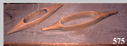
575. Челноки — детали ткацкого станка. Село Вахрушево Тасеевского района Красноярского края. Фото 1984 г.