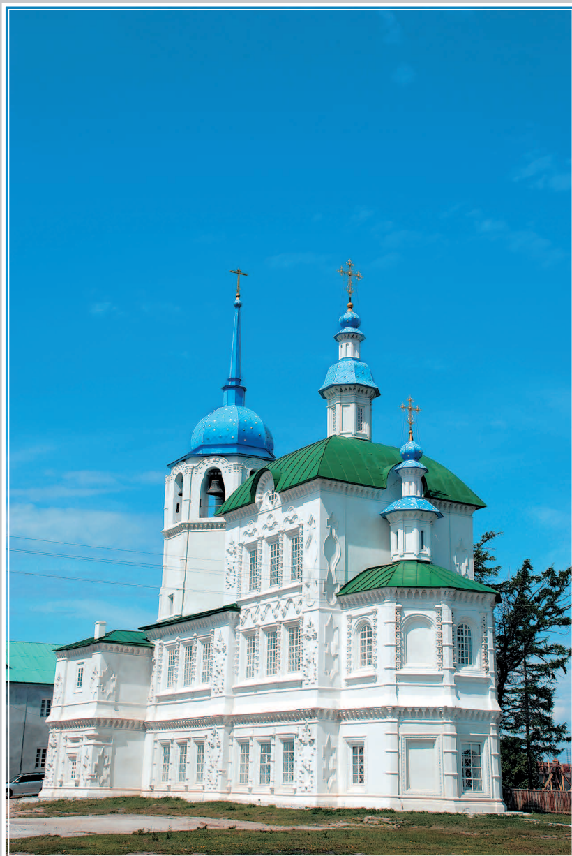
570. Спасо-Преображенский храм в мужском монастыре. Село Посольское Кабанского района Республики Бурятия. Фото 1999 г.