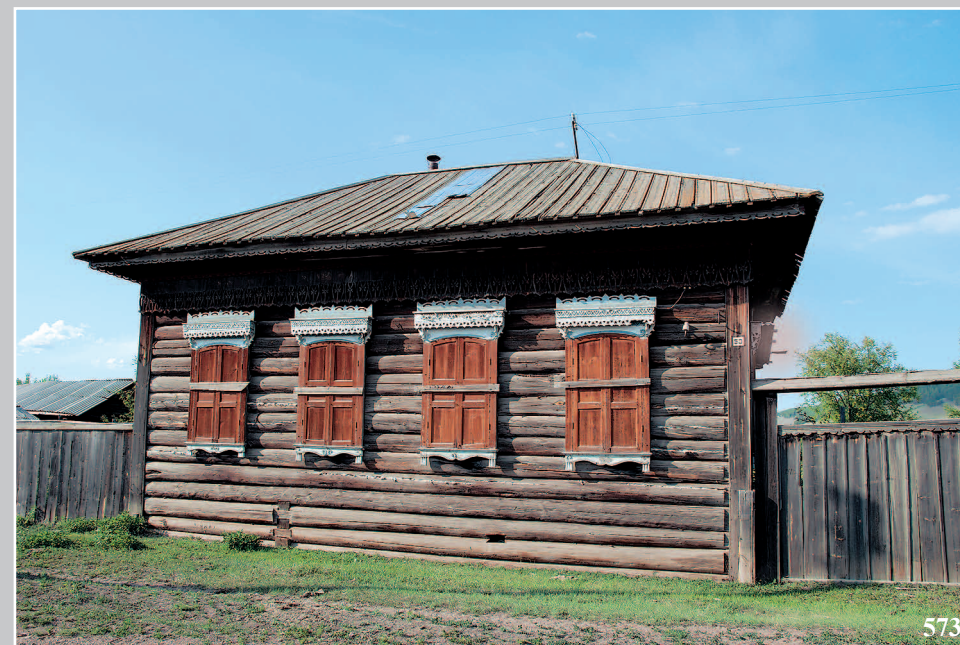
573. Село Северная Нюзя Ленского района Саха (Якутия). Фото 1988 г.