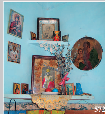
572. Красный угол. Село Кудара-Сомон Кяхтинского района Республики Бурятия. Фото 1982 г.