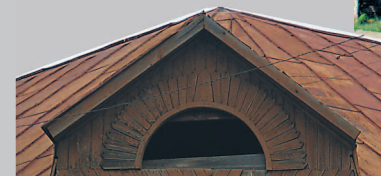
540. Дом купца Мишарина. Село Тутура Жигаловского района Иркутской области. Фото 1982 г.