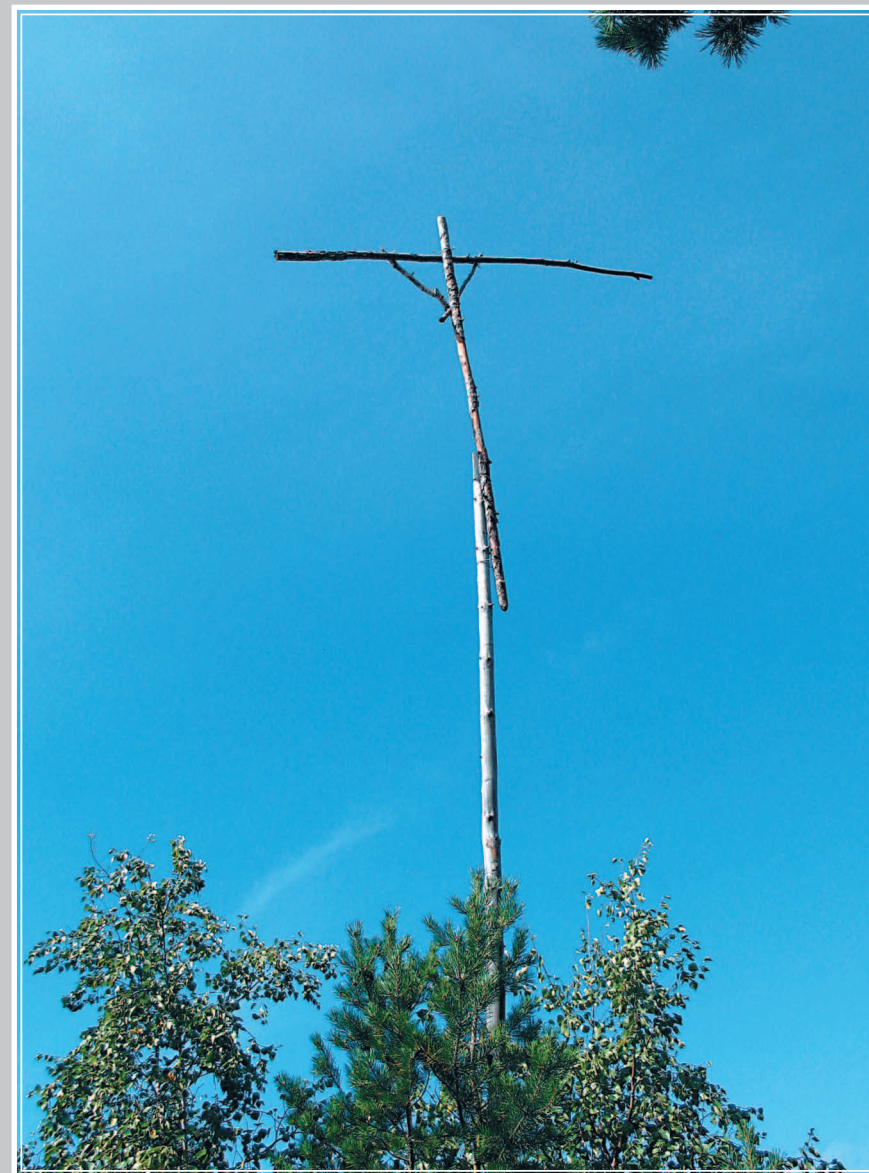
532. Сёдело — насест для диких птиц. Поселок Листвянка Иркутского района Иркутской области. Фото 1987 г.