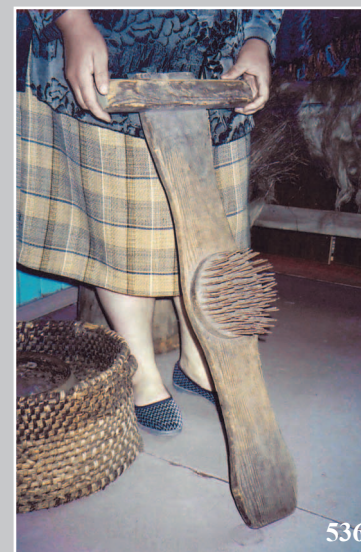
536. Чесáло — приспособление для чесания льна, конопли. Село Верхний Ульхун Кыринского района Читинской области. Фото 1987 г.