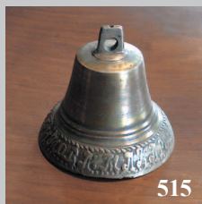
515. Бóтало — колокольчик, привязываемый на шею пасущимся домашним животным. Село Каргино Кабанского района Бурятии. Фото 1984 г.