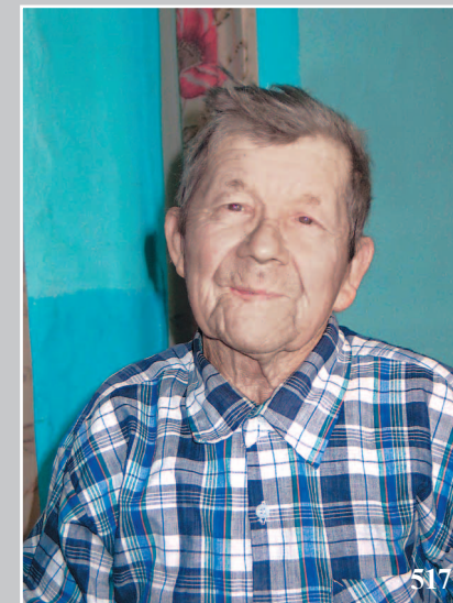
518. Намёты — шаблоны из тонкой дощечки для кройки обуви. Село Нью Ленского района Республики Саха (Якутии). Фото 1986 г.