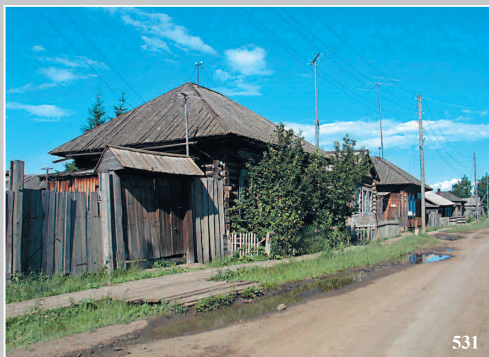
531. Поселок Кежма Кежемского района Красноярского края. Фото 2001 г