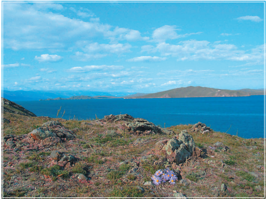
513. Озеро Байкал. Фото 1988 г.