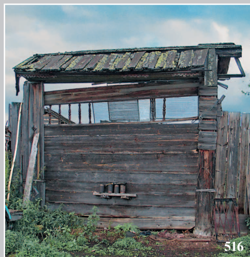
516. Ворота дома в селе Ёдорма Усть-Илимского района Иркутской области. Фото 1995 г.