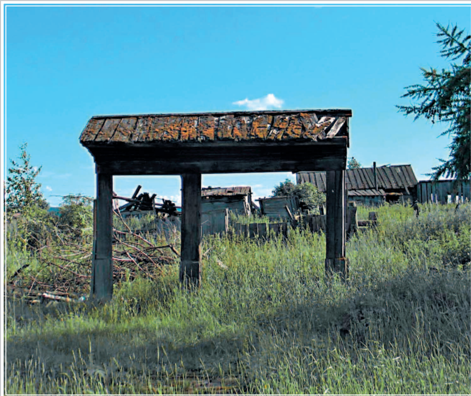
533. Село Ворогово Туруханского района Красноярского края. Фото 1998 г.