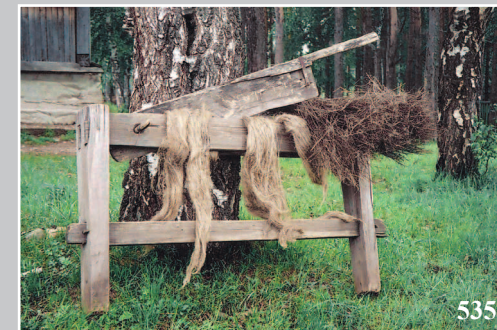
535. Мялка — орудие для первичной обработки конопли, льна. Село Колмогорово Енисейского района Красноярского края. Фото 1986 г.