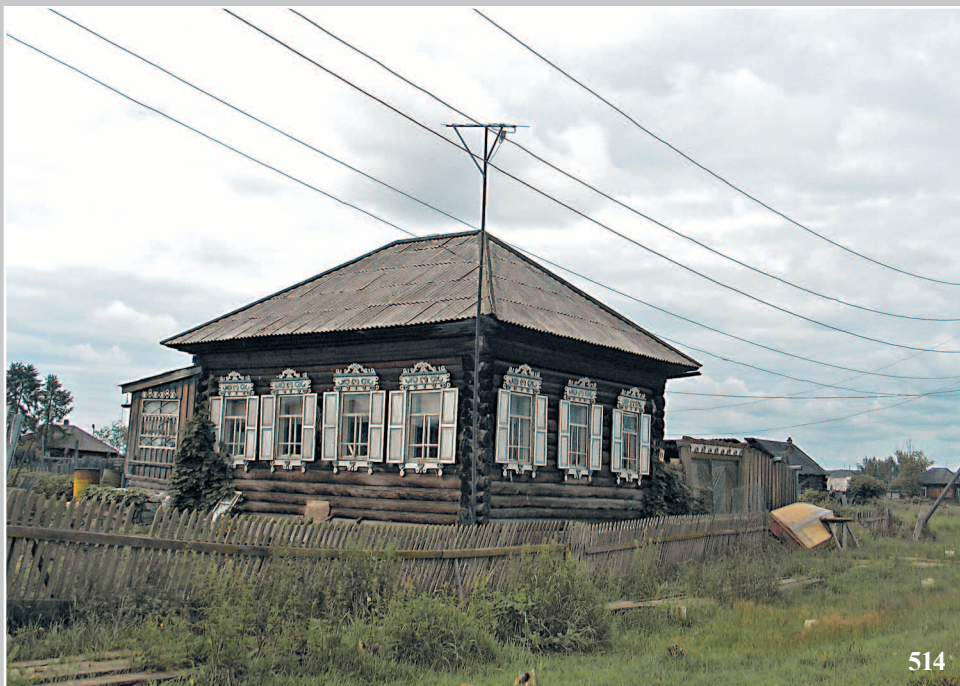
514. Дом с четырехскатной крышей в селе Пинчуга Богучанского района Красноярского края. Фото 1996 г.