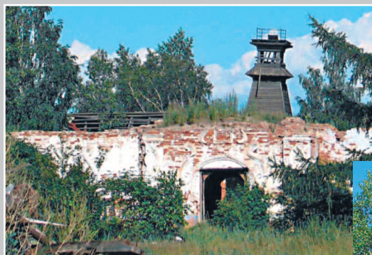
538. Пожарная каланча. Поселок Кежма Кежемского района Красноярского края. Фото 1998 г.