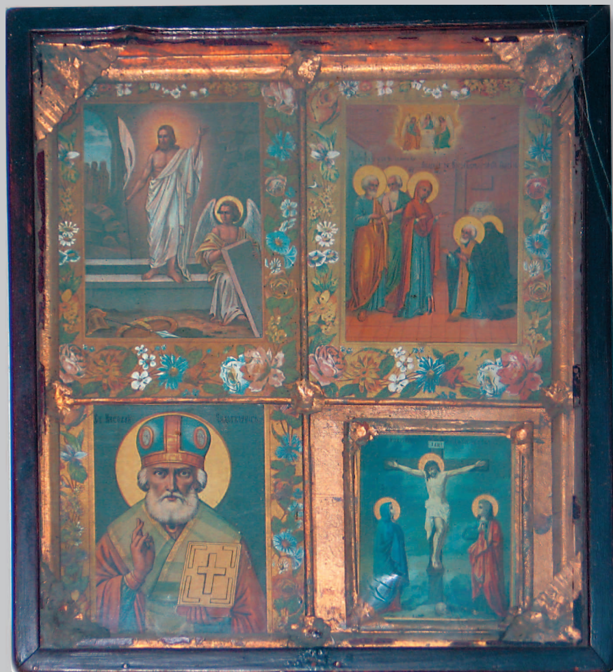
523. Четырехчастная икона в киоте («Воскресение Христово», «Явление Богородицы Сергию Радонежскому», «Никола Чудотворец», «Распятие Христово с предстоящими Богородицею и Иоанном Богословом»). XIX в. Село Калиновка Мухоршибирского района Бурятии. Фото 1986 г.