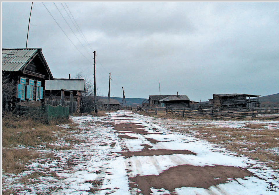
521. Село Кистенево Качугского района Иркутской области. Фото 1984 г.