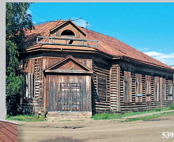
539. Дом в поселке Кежма Кежемского района Красноярского края. Фото 1988 г.