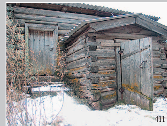
411. Амбар с кóбриком. Село Чекáн Жигаловского района Иркутской области. Фото 1997 г.