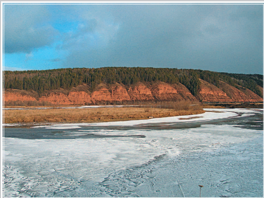
396. Пропары (полыньи) на реке Лене вблизи деревни Пономарево Жигаловского района Иркутской области. Фото 1985 г.