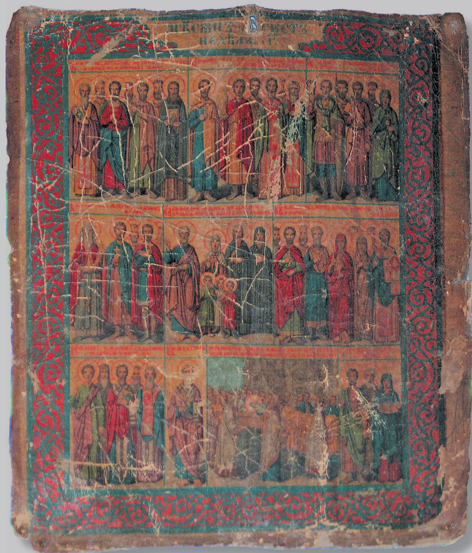
395. «Минея на август месяц». XIX в. Село Паново Кежемского района Красноярского края. Фото 1984 г.