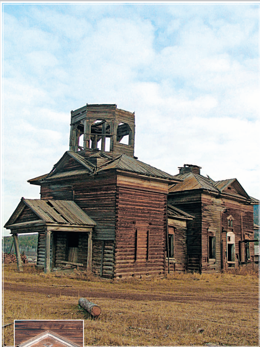
394. Ильинская церковь в селе Тимошино Жигаловского района Иркутской области. Фото 1989 г.