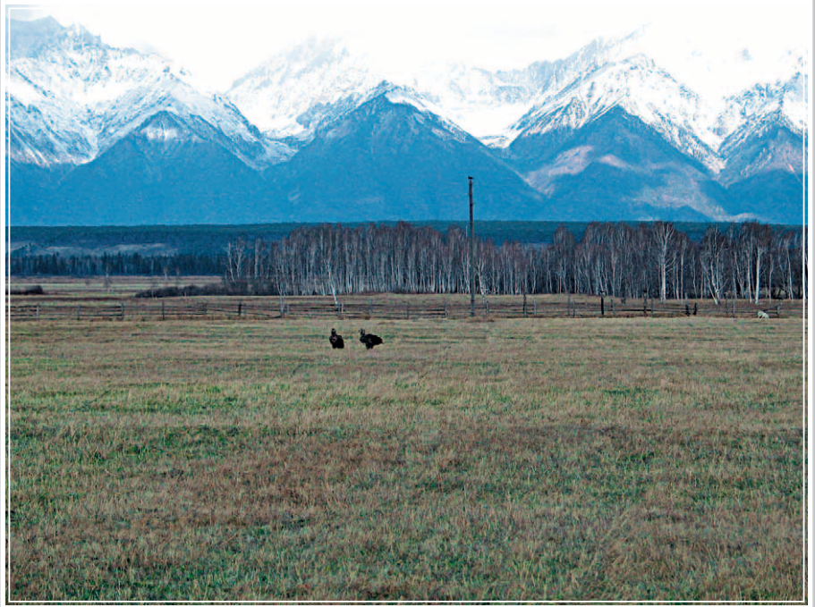
421. Орлы-могильники, обитающие в Тункинской долине (Республика Бурятия). Фото 1989 г.