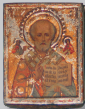
413. Икона «Никола Чудотворец». Село Нижние Ключи Нерчинского района Читинской области. Фото 1983 г.