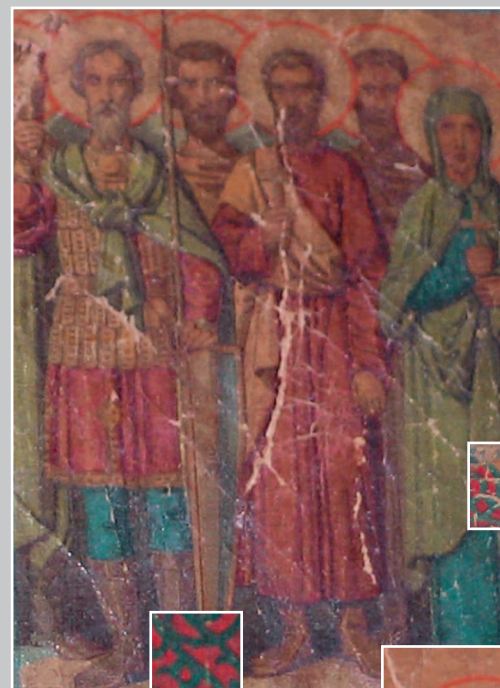
Фрагменты «Минеи на август месяц». XIX в. Село Паново Кежемского района Красноярского края. Фото 1984 г.