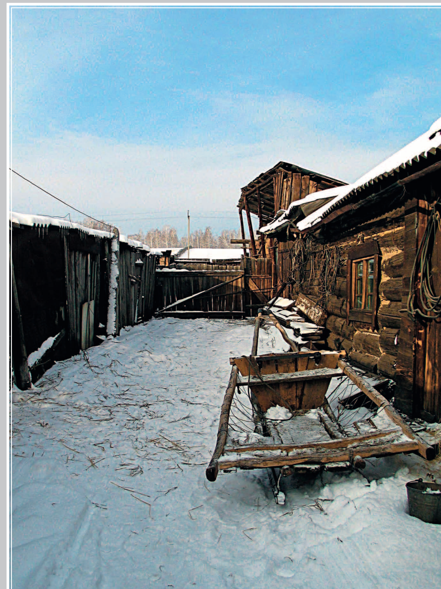
403. Сани-рòзвальни. Село Кактолга Газимуро-Заводского района Читинской области. Фото 1984 г.