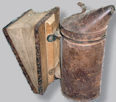
405. Дымокурник. Село Пинчуга Богучанского района Красноярского края. Фото 1984 г.