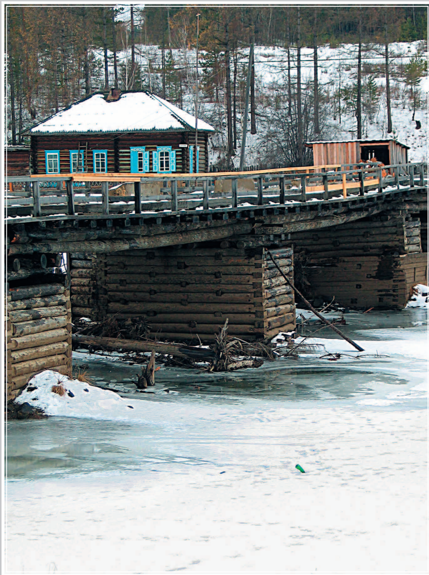
408. Мост через реку Карáбула (приток р. Ангара). Село Карáбула Богучанского района Красноярского края. Фото 1987 г.