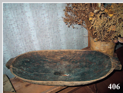
406. Сельница. Село Подьеланка Усть-Илимского района Иркутской области. Фото 1989 г.