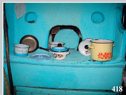
416–418. Фрагменты битой (сделанной из глины) печи, голец. Деревня Житово Качугского района Иркутской области. Фото 1987 г.