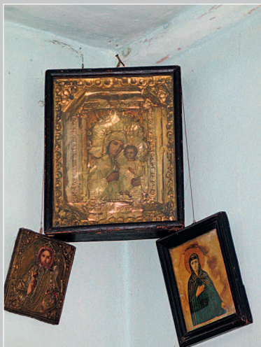
412. Красный угол. Село Колобово Балейского района Читинской обла- сти. Фото 1983 г.