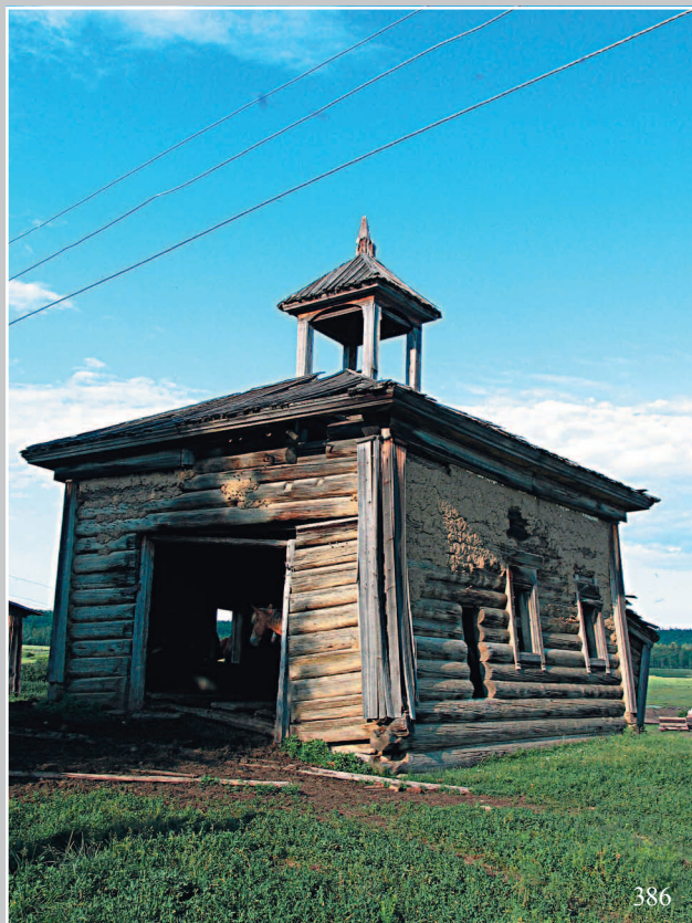
386. Церковь в селе Бедёя Кежемского района Красно- ярского края. Фото 2004 г.