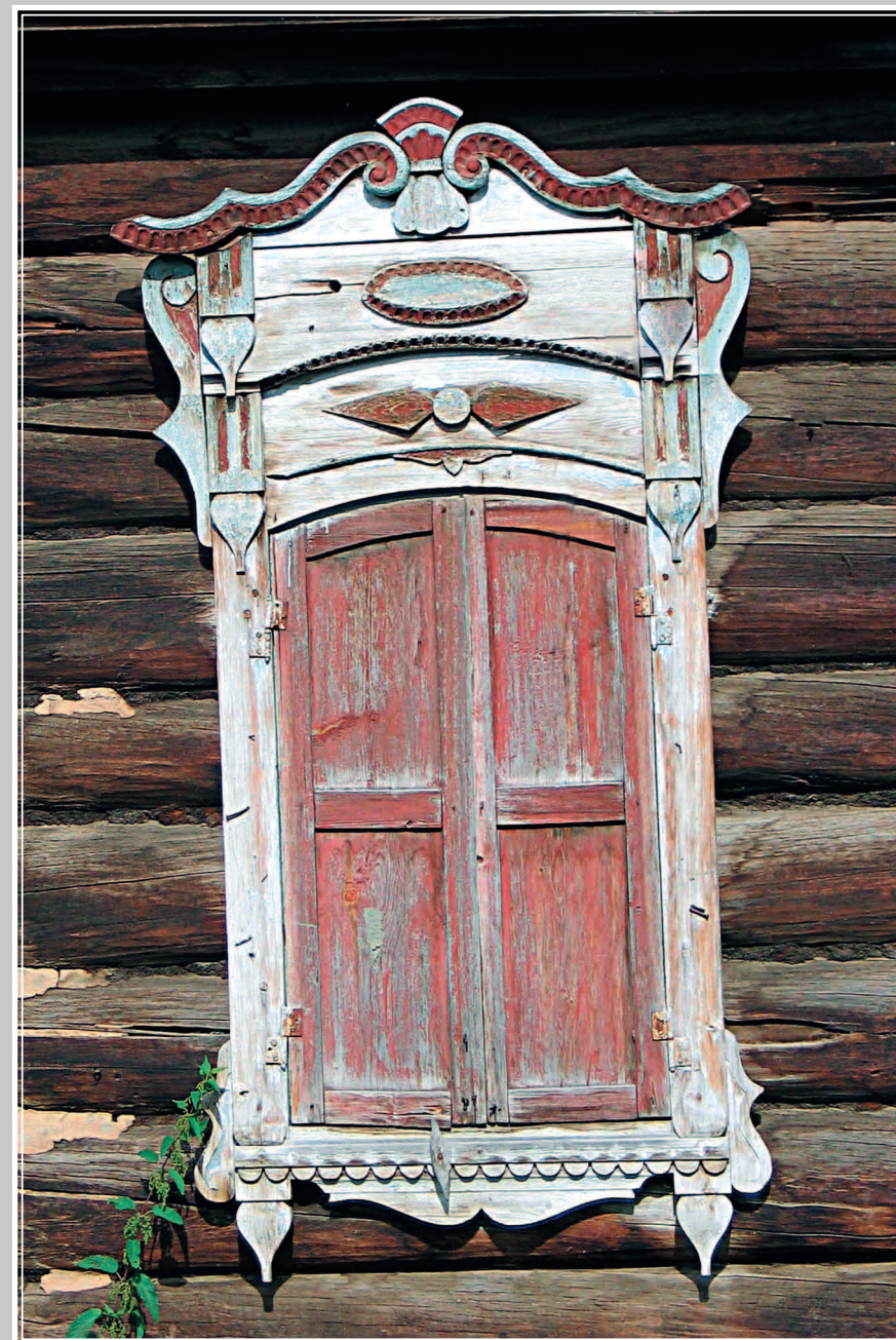
382. Фрагмент дома-одноколка в селе Паново Кежемского района Красноярского края. Фото 1996 г.