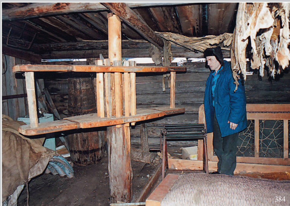
384. Мялка — орудие для обработки кож. Село Золотухино Шилкинского района Читинской области. Фото 1985 г.