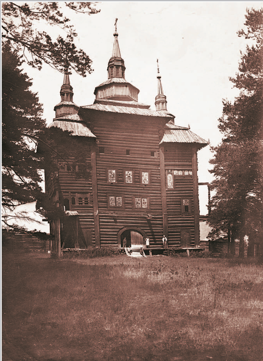
393. Киренская надвратная церковь. XVII век. Вид с южной стороны. Фото И. Серебrenникова, 1907 г. (из фондов Иркутского областного краеведческого музея)