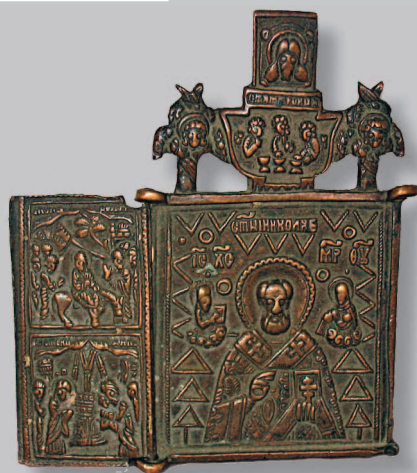
387. Трехстворчатый складень: (Никола Чудотворец (средник), на створках — праздники: вход в Иерусалим (вверху), Сретение (внизу), левая створка не сохра- нилась). Село Урлук Красночигой- ского района Читинской области. Фото 1984 г.