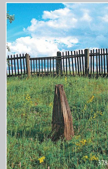
378. Корча́га — верша из прутьев, имеющая вход для рыбы в виде воронки и конусообразный выход, который закрывается крышкой или затыкается травой. Село Исток Кабанского района Бурятии. Фото 1995 г.