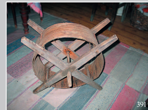
392. Село Нижние Куларки Сретенского района Читинской области. Фото 1985 г.