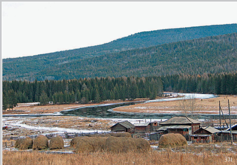
371. Село Бочай Жигаловского района Иркутской области Фото 1987 г.