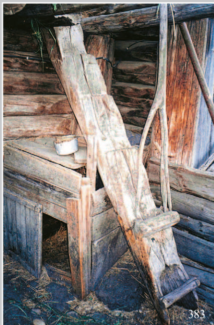
383. Вскходнўшка — лестница, ведущая на сеновал. Деревня Усть-Тальма Качугского района Иркутской области. Фото 1987 г.