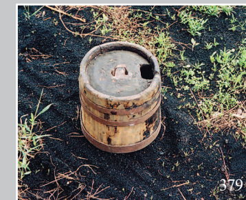
379. Дегтя́рка — бочка для хранения дёгтя. Село Бушуле́й Чернышевского района Читинской области. Фото 1985 г.