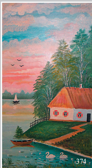
374. Закат на реке Ока. Художник А.Г. Раструба. Село Батама́ Зиминского района Иркутской области. Фото 2004 г.