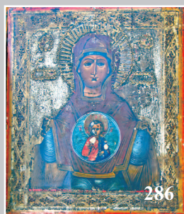
286. Икона «Знамение». Село Сыромолотово Кежемского района Красноярского края. Фото 1983 г.