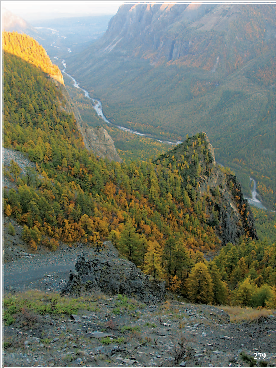
279. Утесы в ущелье реки Средний Сакукан. Каларский район Читинской области. Фото 2007 г.