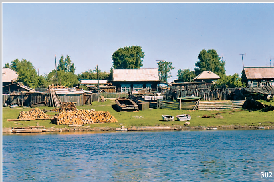
302. Поселок Кежма Кежемского района Красноярского края. Фото 1999 г.