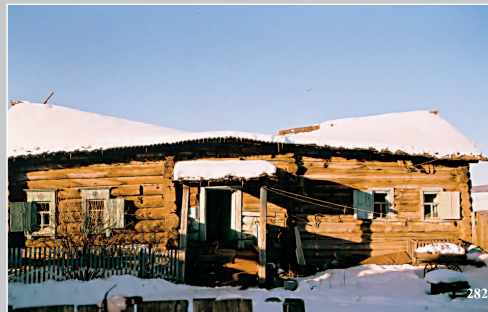
282. Дом на связи. Деревня Шеметово Качугского района Иркутской области. Фото 1981 г.