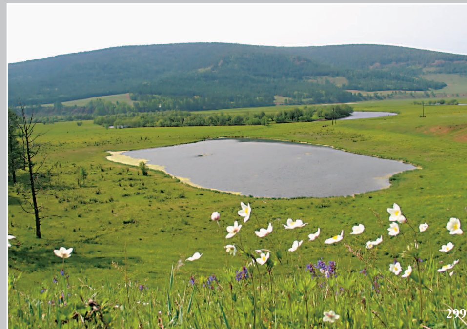
299. Озеро Кругленькое у деревни Обхой Качугского района Иркутской области. Фото 1983 г.