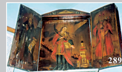
289. Фрагмент «красного угла». Село Бишигино Нерчинского района Читинской области. Фото 1984 г.