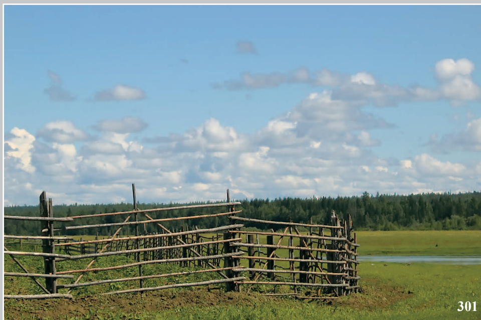
301. Стаवेशки — изгородь, снимаемая во время разлива реки. Деревня Яркино Кежемского района Красноярского края. Фото 1986 г.