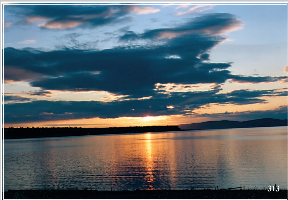
313. Закат на реке Ангаре