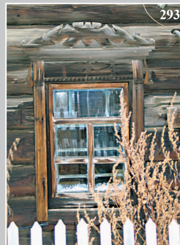
293. Окно с луковым очельем. Село Карабола Богучанского района Красноярского края. Фото 1985 г.