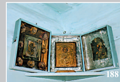
188. «Цветной угол». Поселок Усть-Пит Енисейского Красноярского края. Фото 1980 г.