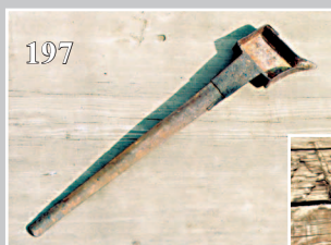
197. Лейка для плавки свинца для охотничьего ружья. Фото 1985 г.