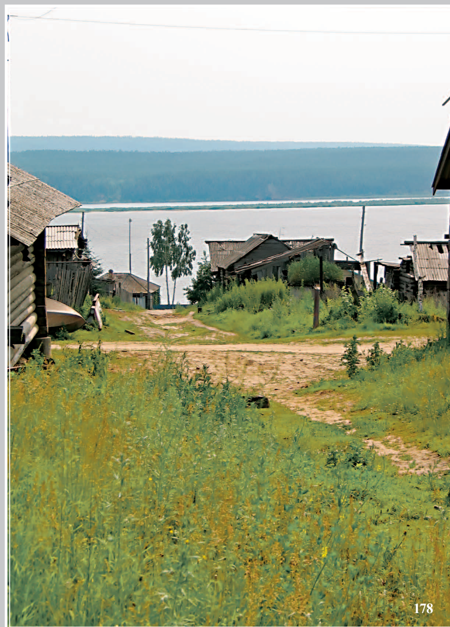
178. Крест — перекресток. Село Ча́добец Кежемского района Красноярского края. Фото 1982 г.