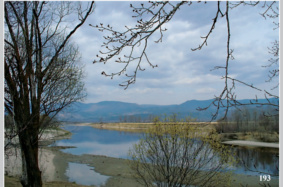
193. Окрестности села Тóры Тункинского района Бурятии. Фото 2005 г.