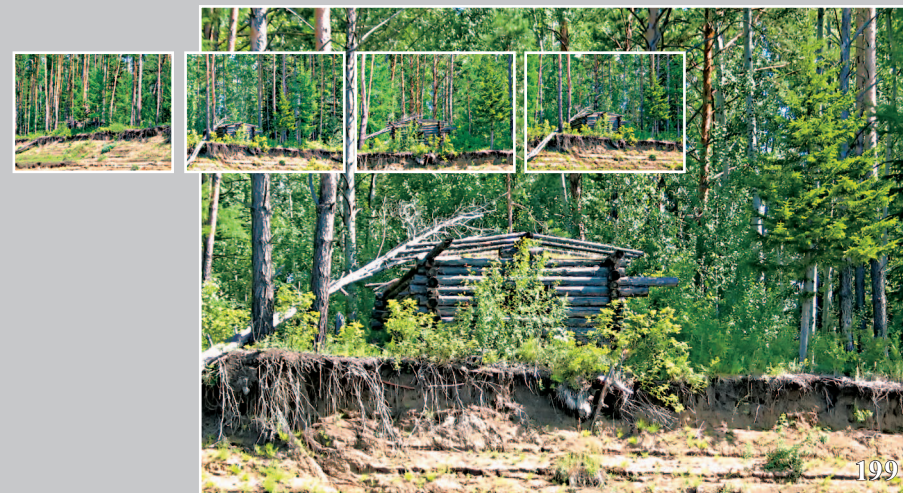
199. Ночуйка — охотничье зимовье на реке Нижняя Тунгуска. Фото 1980 г.