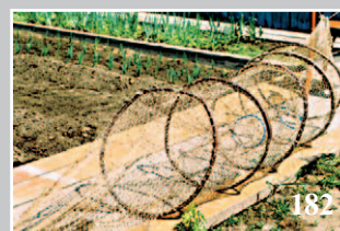
182. Мотня — средняя часть невода в виде мешка. Село Горбица Сретенского района Читинской области. Фото 1983 г.