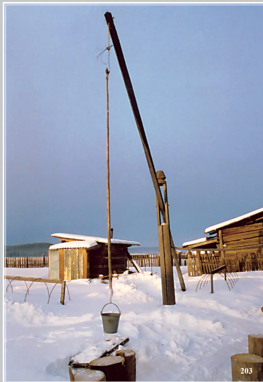
203. Колодец-журавль. Село Никольск Тункинского района Бурятии. Фото 1987 г.