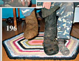
196. Ёчиги — обувь из обработанной кожи с голенищем, на мягкой подошве. Фото 2001 г.