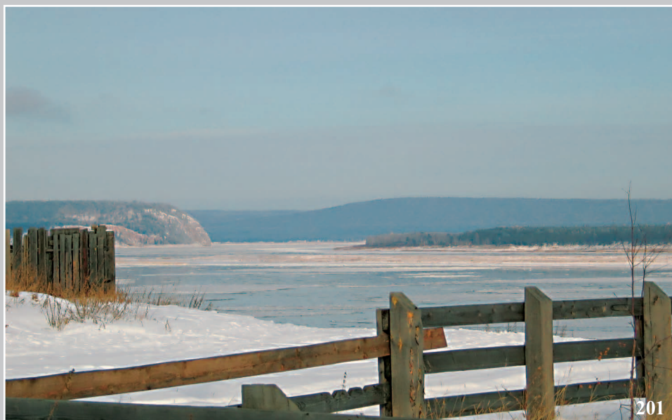
201. Вид на реку Ангару. Село Мánзя Богучанского района Красноярского края. Фото 1983 г.