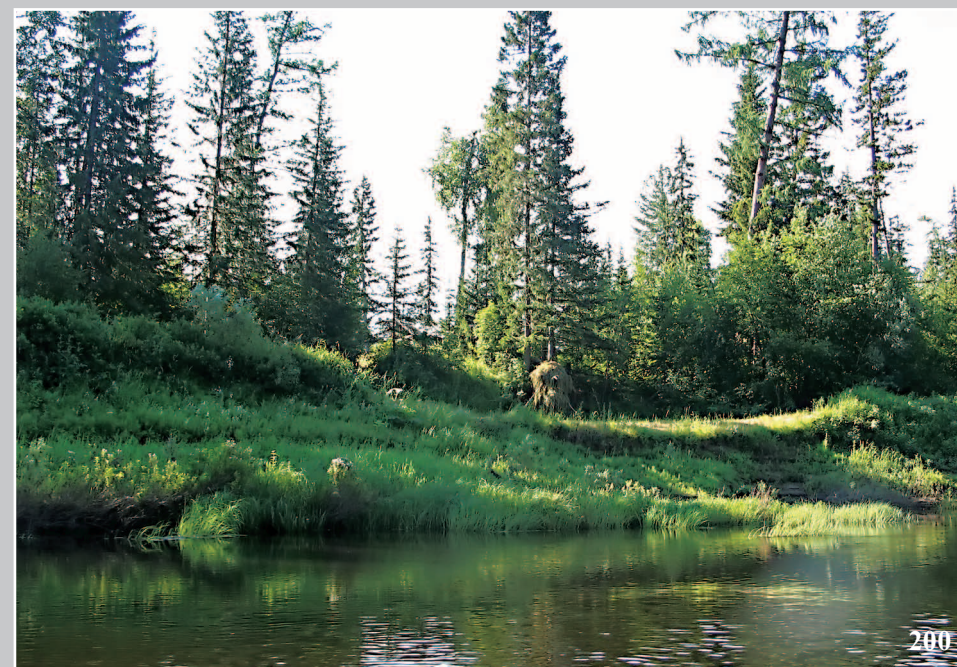
200. Балагáн — шалаш из веток, травы и бересты. Река Тасей — левый приток реки Ангары. Фото 1981 г.