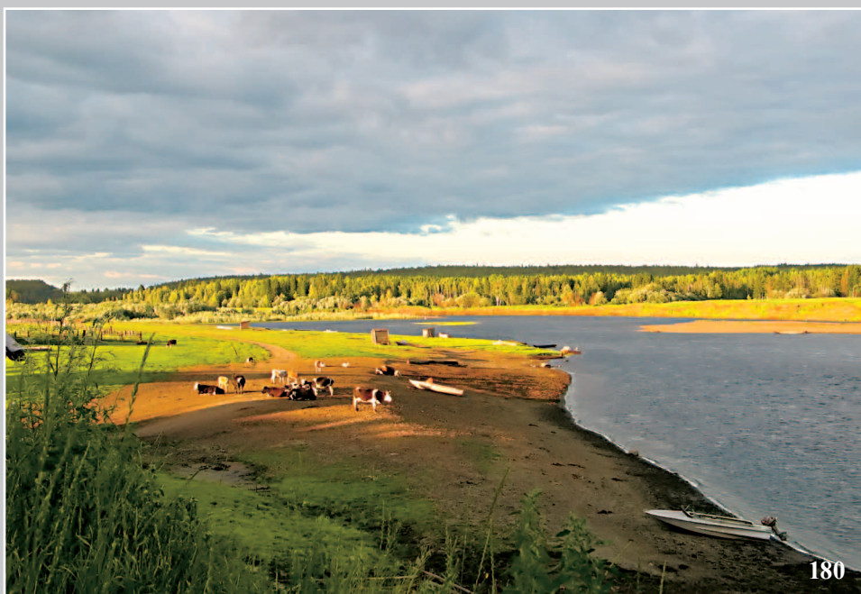
180. Река Ча́добец — правый приток реки Ангары. Село Яркино Кежемского района Красноярского края. Фото 1981 г.