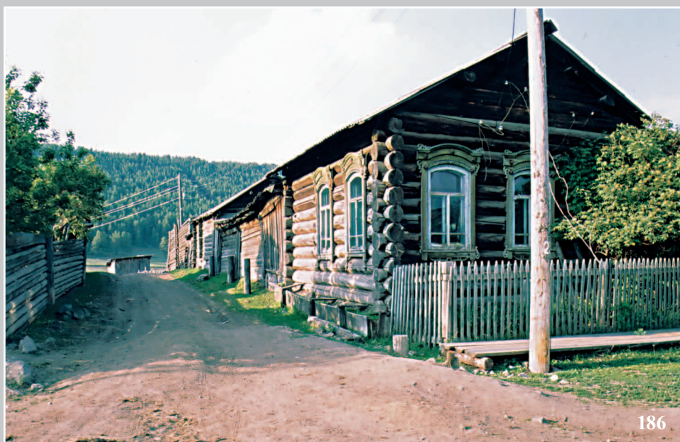
186. Улица, ведущая к реке. Деревня Заледёво Кежемского района Красноярского края. Фото 1982 г.