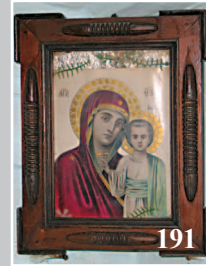
191. Фрагмент «цветного угла». Деревня Моба Катангского района Иркутской области. Фото 1980 г.