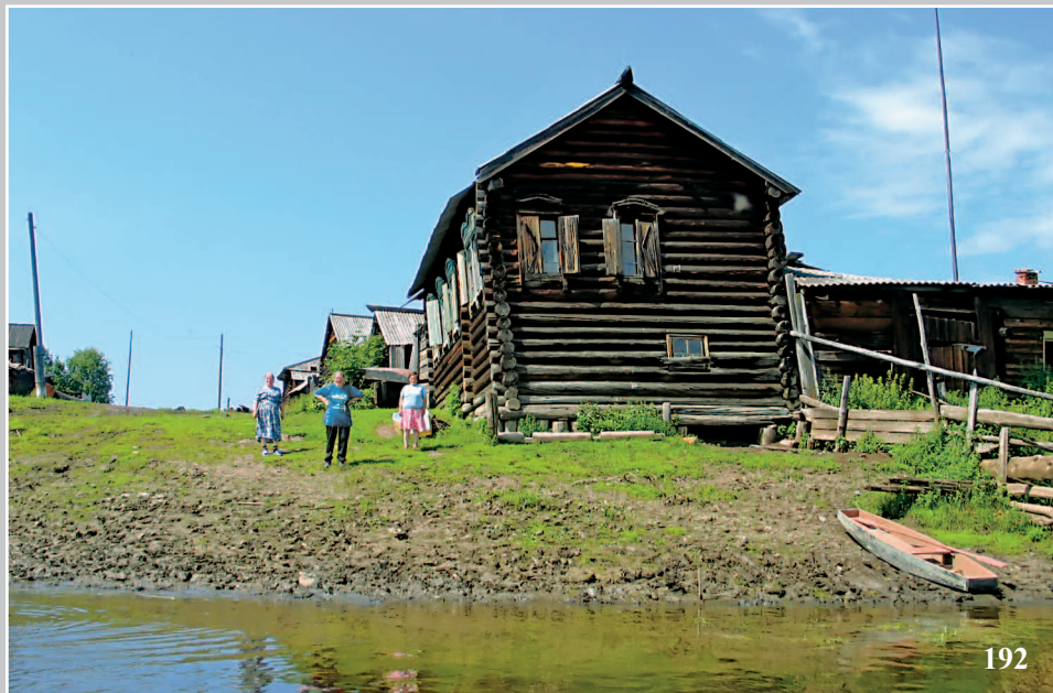
192. Дом на подклети. Село Бедёя Кежемского района Красноярского края. Фото 1984 г.