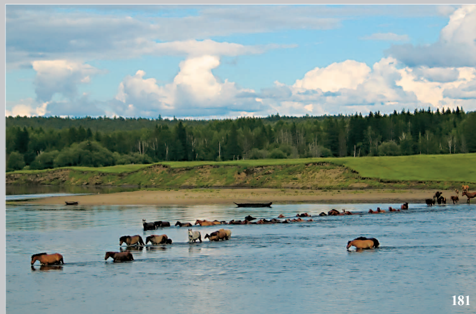
181. Река Му́ра — левый приток реки Ангары. Село Бедёя Кежемского района Красноярского края. Фото 1982 г.