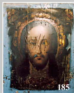
185. Икона «Спас». Село Исток Кабанского района Бурятии. Фото 1980 г.