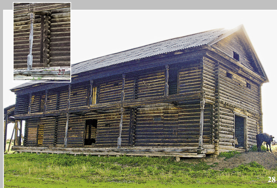
27–28. Мангазёя — общественный склад, амбар для хранения зерна. Село Заледёево Кежемского района Красноярского края. Фото 1981 г.