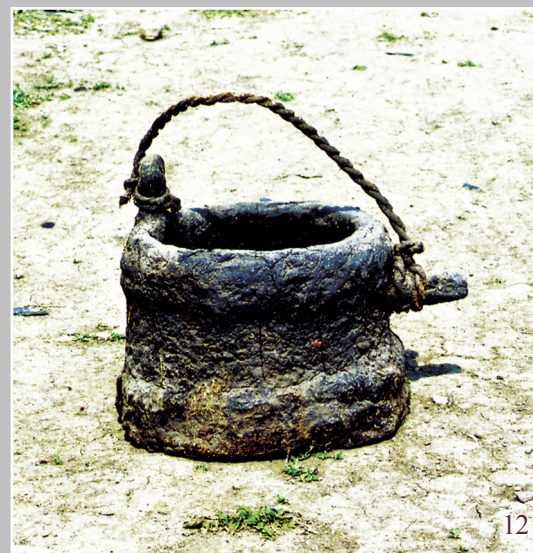
12. Дегтýрка — деревянный бочонок для хранения дёгтя. Село Кéуль Усть-Илимского района Иркутской области. Фото 1993 г.