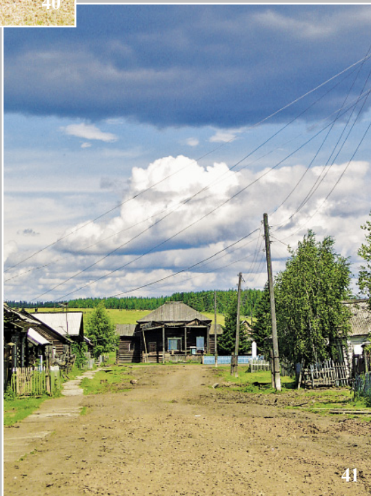
41. Деревянная церковь в селе Яркино Кежемского района Красноярского края. Фото 2005 г.