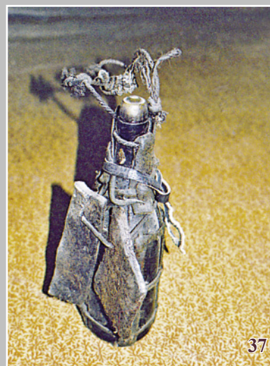
37. Дегтярная бутылка — укрепляемая на боку лошади бутылка с дёгтем, который используется как защитное средство от мошки. Село Кéуль Усть-Илимского района Иркутской области. Фото 1983 г.