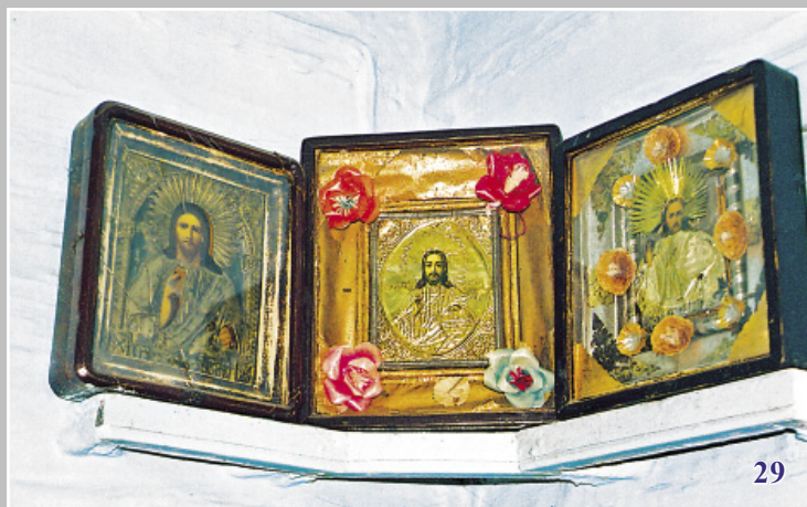
29. «Красный угол». Село Дашкачын Северо-Байкальского района Республики Бурятия. Фото 1997 г.