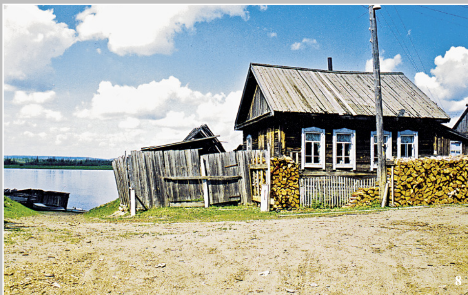
8. Спуск к Пановскому прилۇку. Село Паново Кежемского района Красноярского края. Фото 1982 г.