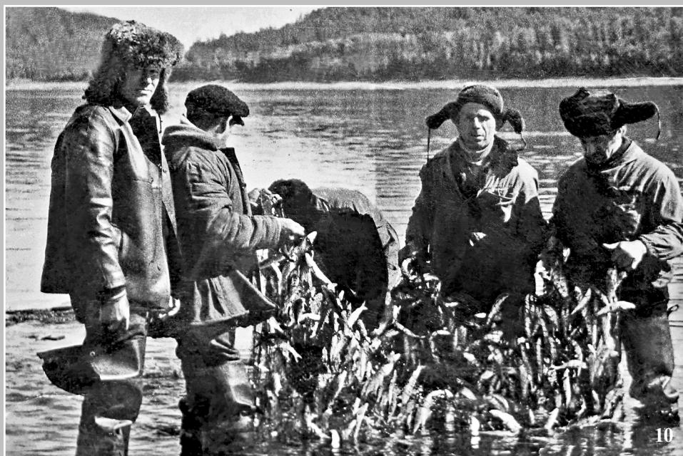
10. Ангарские рыбаки. Поселок Кéжма Кежемского района Красноярского края. Фото 1981 г.