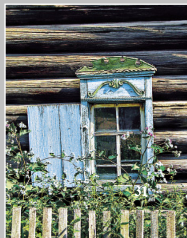
31. Одностворчатое окно с луковым очельем и накладной резьбой лобани. Село Заледеево Кежемского района Красноярского края. Фото 1986 г.