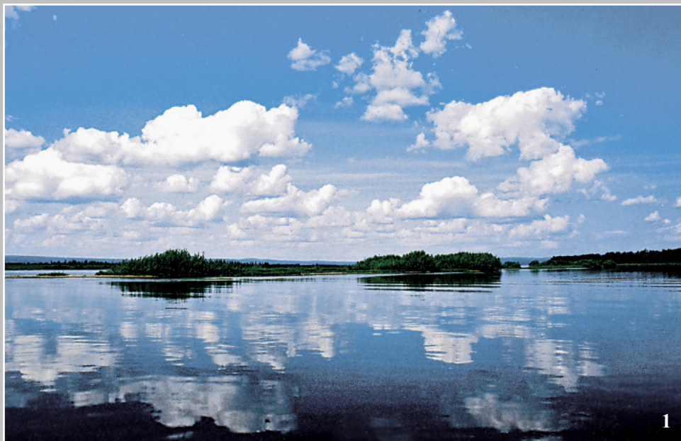
1. Нижнее течение реки Ангара. Фото 1981 г.