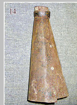
14. Бот — приспособление, которым загоняют рыбу в ловушку или сеть, ударяя по воде или льду. Село Горбица Сретенского района Читинской области. Фото 1984 г.