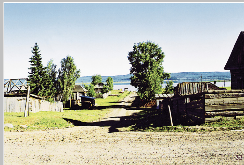
33. Улица, ведущая к реке. Село Паново Кежемского района Красноярского края. Фото 1998 г.