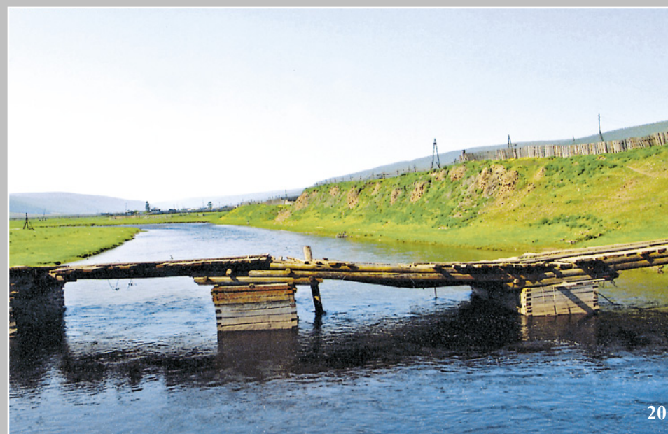
20. Мост на лиственничных срубам (быках/боровках/свинках). Село Белоусово Качугского района Иркутской области. Река Куленга — левый приток реки Лена. Фото 1980 г.