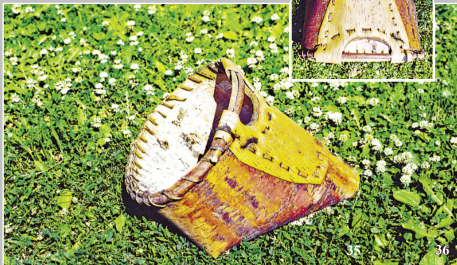
35–36. Алánки/алúnки — берестяной совок для сбора ягод; биток. Село Ермаки Казачинско-Ленского района Иркутской области. Фото 1984 г.