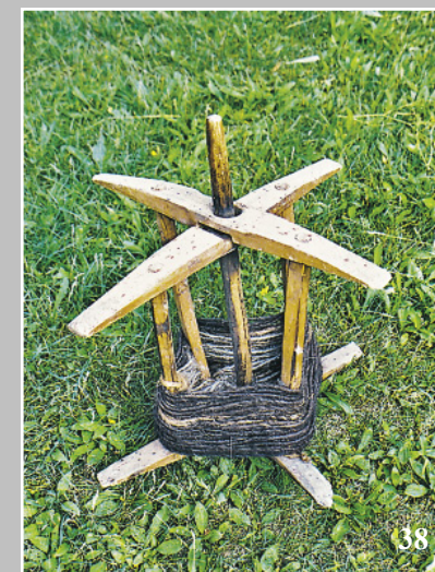
38. Мужская вьюшка — приспособление для сматывания пряжи/веревки. Село Усть-Карск Сретенского района Читинской области. Фото 1981 г.