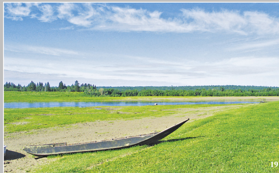
19. Ангарка — деревянная лодка. Река Чадобец — правый приток реки Ангара. Село Яркино Кежемского района Красноярского края. Фото 1982 г.