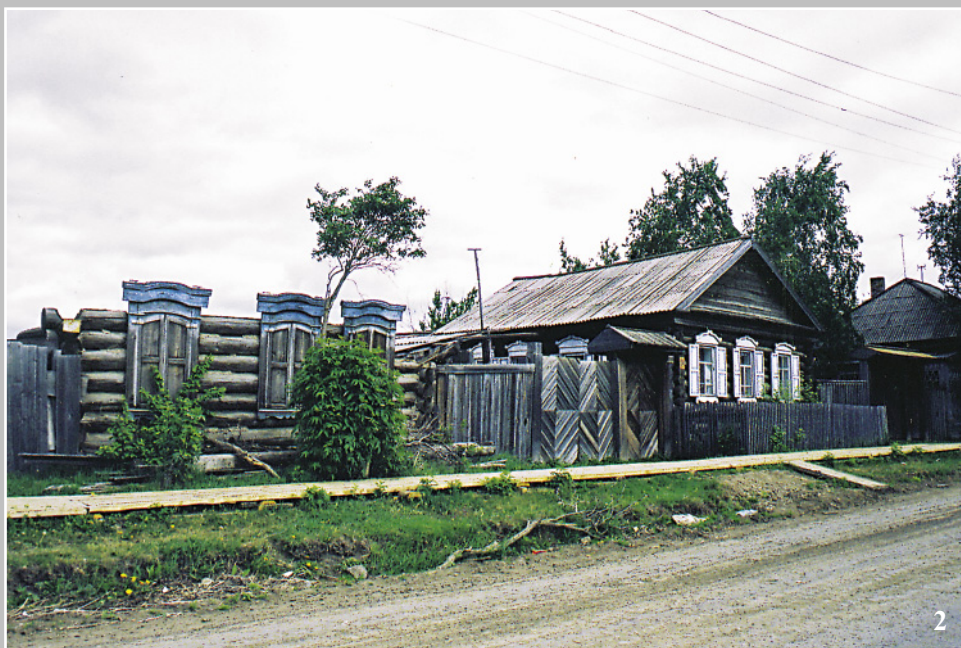
2. Поселок Кéзма Кежемского района Красноярского края. Фото 1998 г.