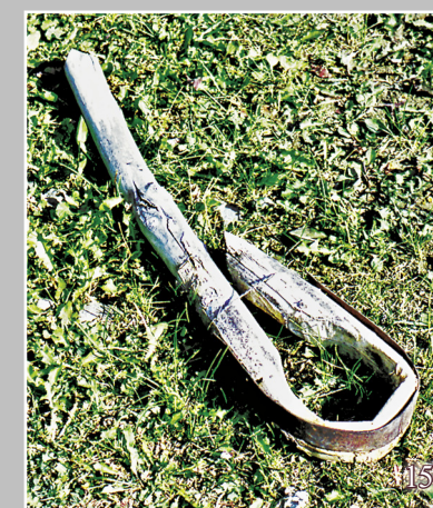
15. Башмак/гасканiна — препятствующая быстрому ходу колодка, надеваемая на ногу лошади во время пастьбы. Село Ягё Шелопугинского района Читинской области. Фото 1982 г.