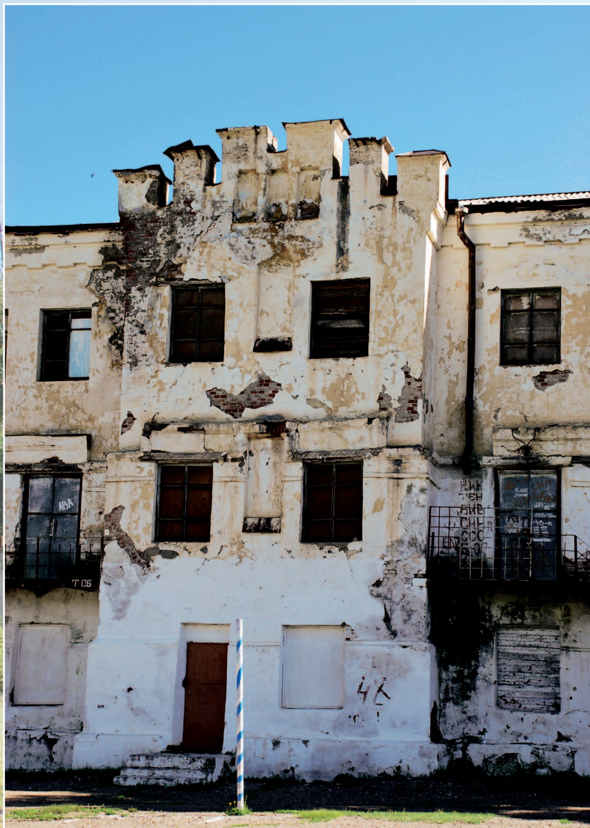
62 (16). Зерентуйская каторжная тюрьма — центральная тюрьма Нерчинской каторги (в 1827 г. сюда была доставлена группа декабристов /членов Южного общества/, организовавших Зерентуйский заговор, который возглавил декабрист Иван Сухинов). Село Горный Зерентуй Нерчинско-Заводского района Читинской области. Фото 2011 г.