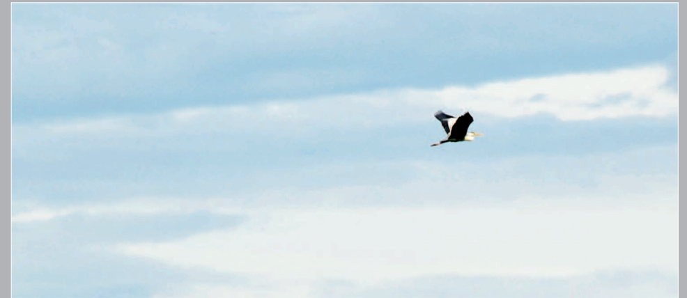
58–61 (16). Серая цапля в полёте над селом Батакан. Газимуро-Заводский район Читинской области. Фото 1998 г.