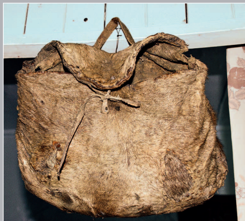
75 (16). Потаёк — охотничья сумка, сделанна из шкуры лобной части оленя. Село Карам Казачинско-Ленского района Иркутской области. Фото 1997 г.