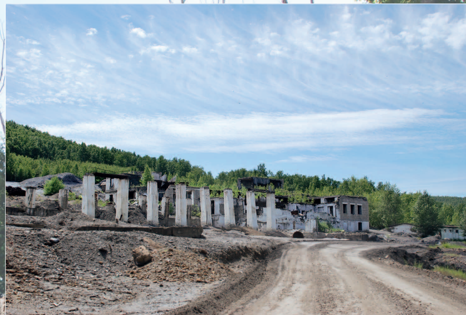
63–64 (16). Руины Зерентуйского рудника по добыче серебряно-свинцовой руды. Село Горный Зерентуй Нерчинско-Заводского района Читинской области. Фото 2011 г.