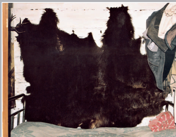
78 (16). Шкура медведя, используемая в качестве настенного ковра. Деревня Ихинигуй Качугского района Иркутской области. Фото 1994 г.