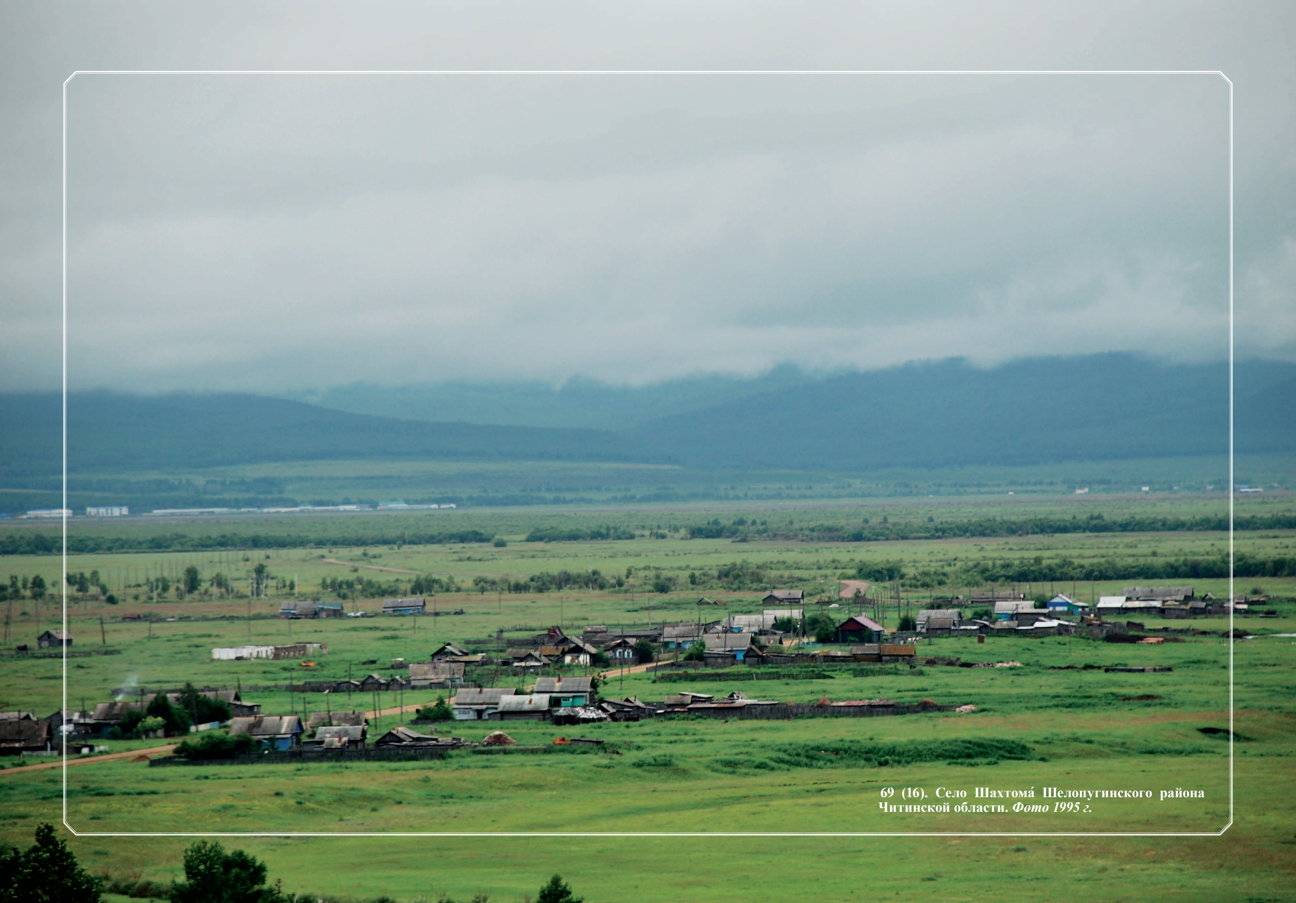
69 (16). Село Шахтомá Шелопугинского района Читинской области. Фото 1995 г.