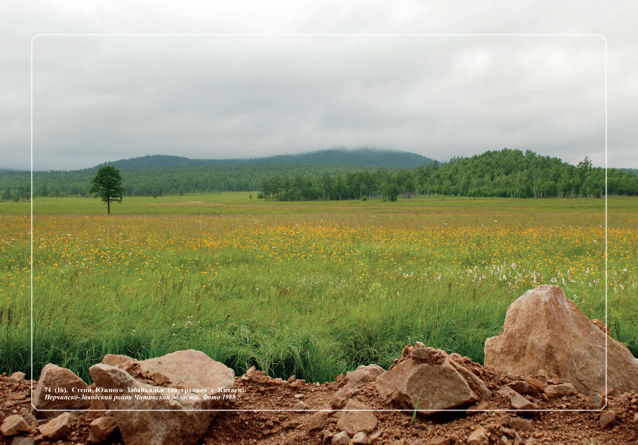
74 (16). Степи Южного Забайкалья (на границе с Китаем). Нерчинско-Заводский район Читинской области. Фото 1988 г.