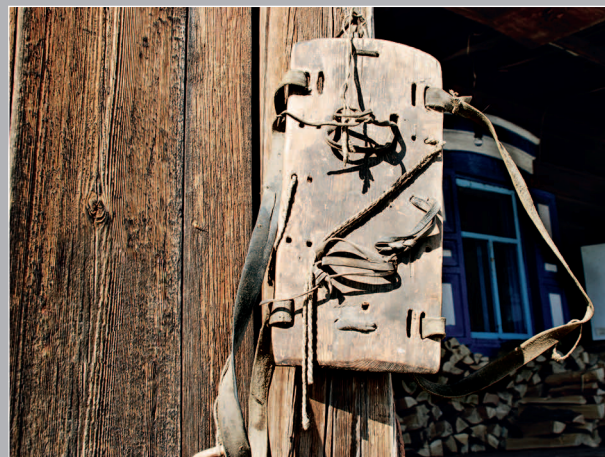
79 (16). Жучеры / поняга / крошни — охотничьи носилки, надеваемые на спину, — дощечка с ремешками для укрепления груза. Село Дубынино Братского района Иркутской области. Фото 1996 г.