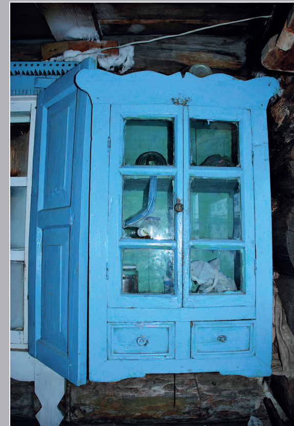
72 (16). Поставец — стенной шкафчик с полочками. Село Явленка Нерчинско-Заводского района Читинской области. Фото 1986 г.