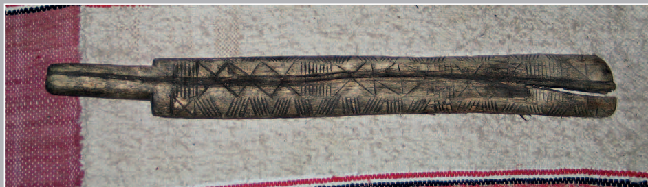
71 (16). Палица / валёк (с геометрическим орнаментом) для стирки белья. Деревня Недокуры Кежемского района Красноярского края. Фото 1989 г.