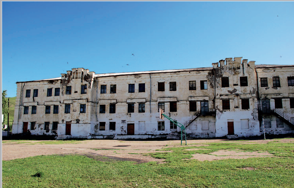
65–68 (16). Зерентуйская каторжная тюрьма — центральная тюрьма Нерчинской каторги (в 1827 г. сюда была доставлена группа декабристов /членов Южного общества/, организовавших Зерентуйский заговор, который возглавил декабрист Иван Сухинов). Село Горный Зерентуй Нерчинско-Заводского района Читинской области. Фото 2011 г.