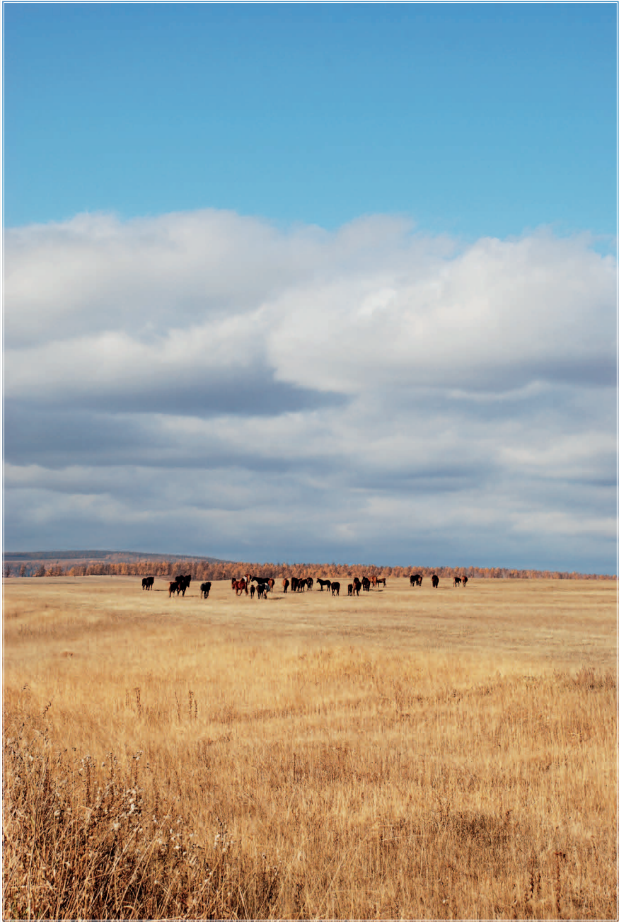
81 (16). Табун лошадей на «вóльном выпасе». Эхирит-Булагатский район Иркутской области. Фото 1997 г.