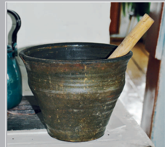
73 (16). «Муравка» — глиняный горшок. Село Катяево Петровск-Забайкальского района Читинской области. Фото 1998 г.