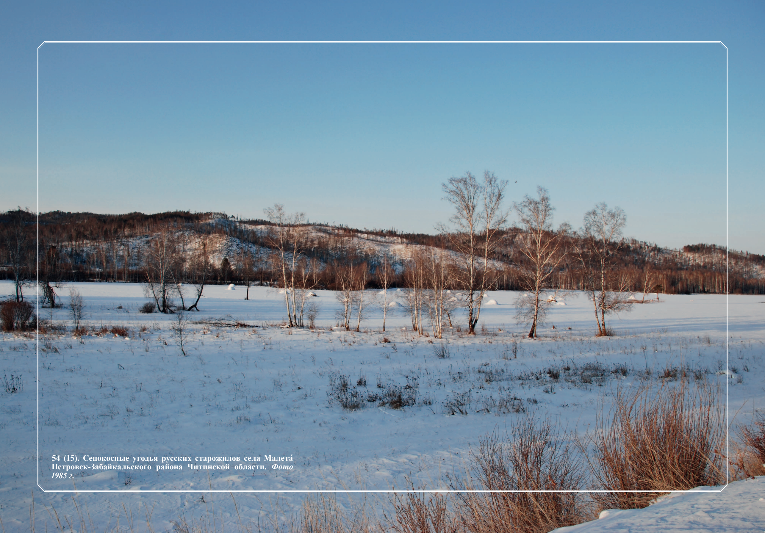
54 (15). Сенокосные угодья русских старожилов села Малетá Петровск-Забайкальского района Читинской области. Фото 1985 г.