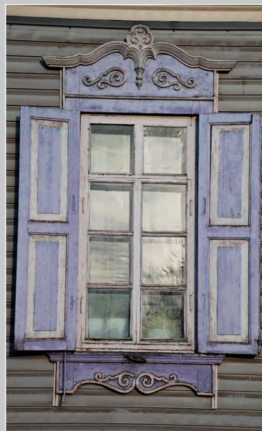
48–50 (15). Элементы фасадного декора пятистенного дома в г. Кяхта Кяхтинского района Республики Бурятия. Фото 2007 г.