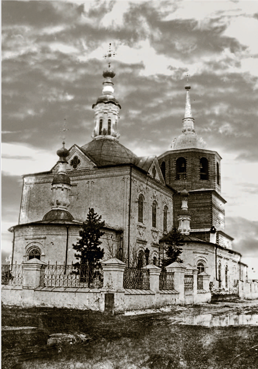
67 (15). Церковь Покрова Пресвятой Богородицы в с. Нижнеилимское Киренского уезда Иркутской губернии. Фото 1913 г. (ГАИО. Р-2732, оп. 1, д. 2)