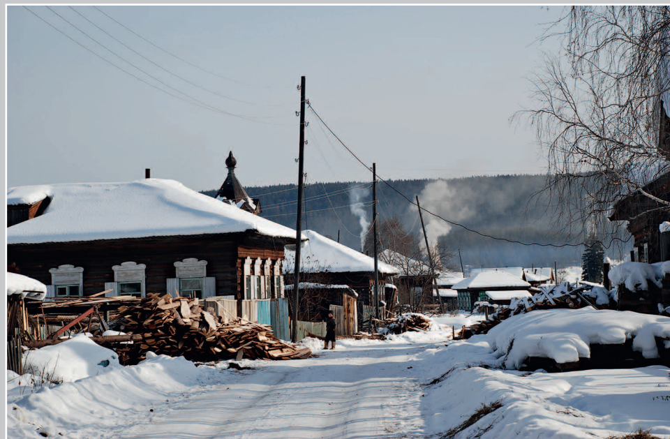
65 (15). Село Марково, расположенное на реке Лена. Усть-Кутский район Иркутской области. Фото 2001 г.