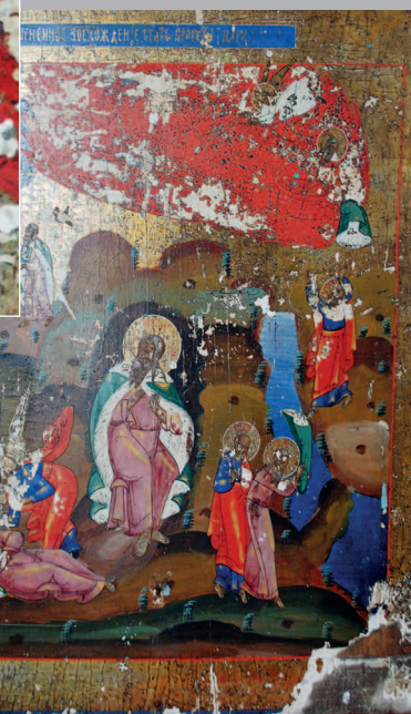
52–53 (15). Икона «Огненное восхождение Ильи Пророка» (2-я пол. XIX в.). Село Альбитуй Красночико́йского района Читинской области. Фото 1998 г.