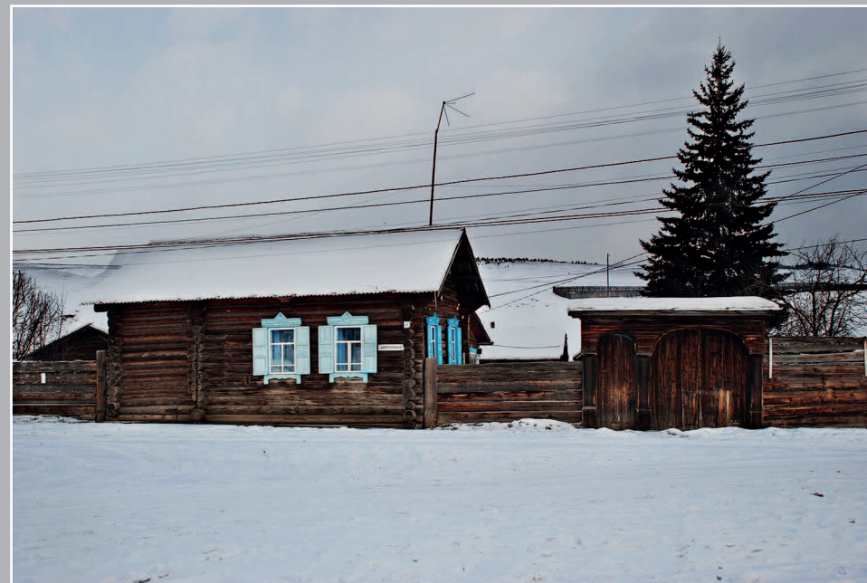
61–62 (15). Трёхверейные ворота с «луковым» завершением под двускатной крышей. Село Альбитуй Красночико́йского района Читинской области. Фото 1987 г.