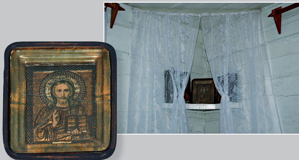
63–64 (15). «Красный» / «цветной» угол с иконой «Спас Вседержитель» (конец XIX — начало XX в.). Село Посольское Кабанского района Республики Бурятия. Фото 1998 г.