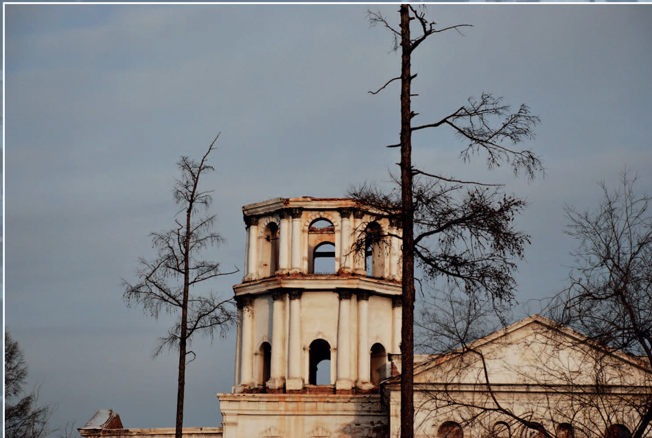
45–47 (15). Троицкий собор (1807–1817 гг.) в г. Кяхта Кяхтинского района Республики Бурятия. Фото 2006 г.