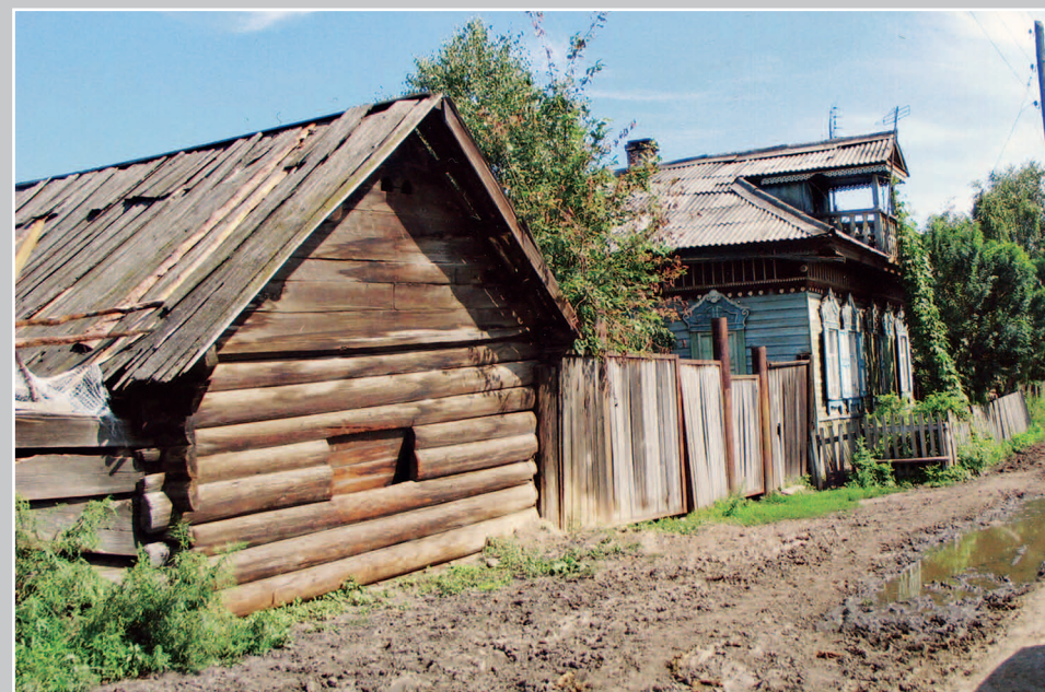
18 (15). Бревенчатый амбар под двускатной одранённой крышей. Село Тальяны Усольского района Иркутской области. Фото 2010 г.