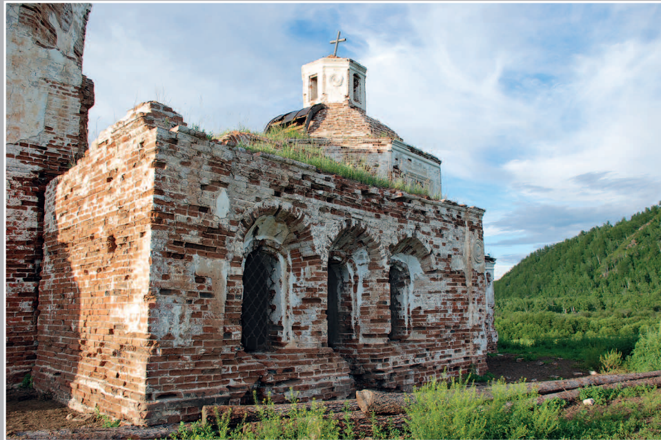
3–8 (15). Покровский храм (1815 г.) в селе Волочаевка Нерчинского района Читинской области. Фото 2007 г.