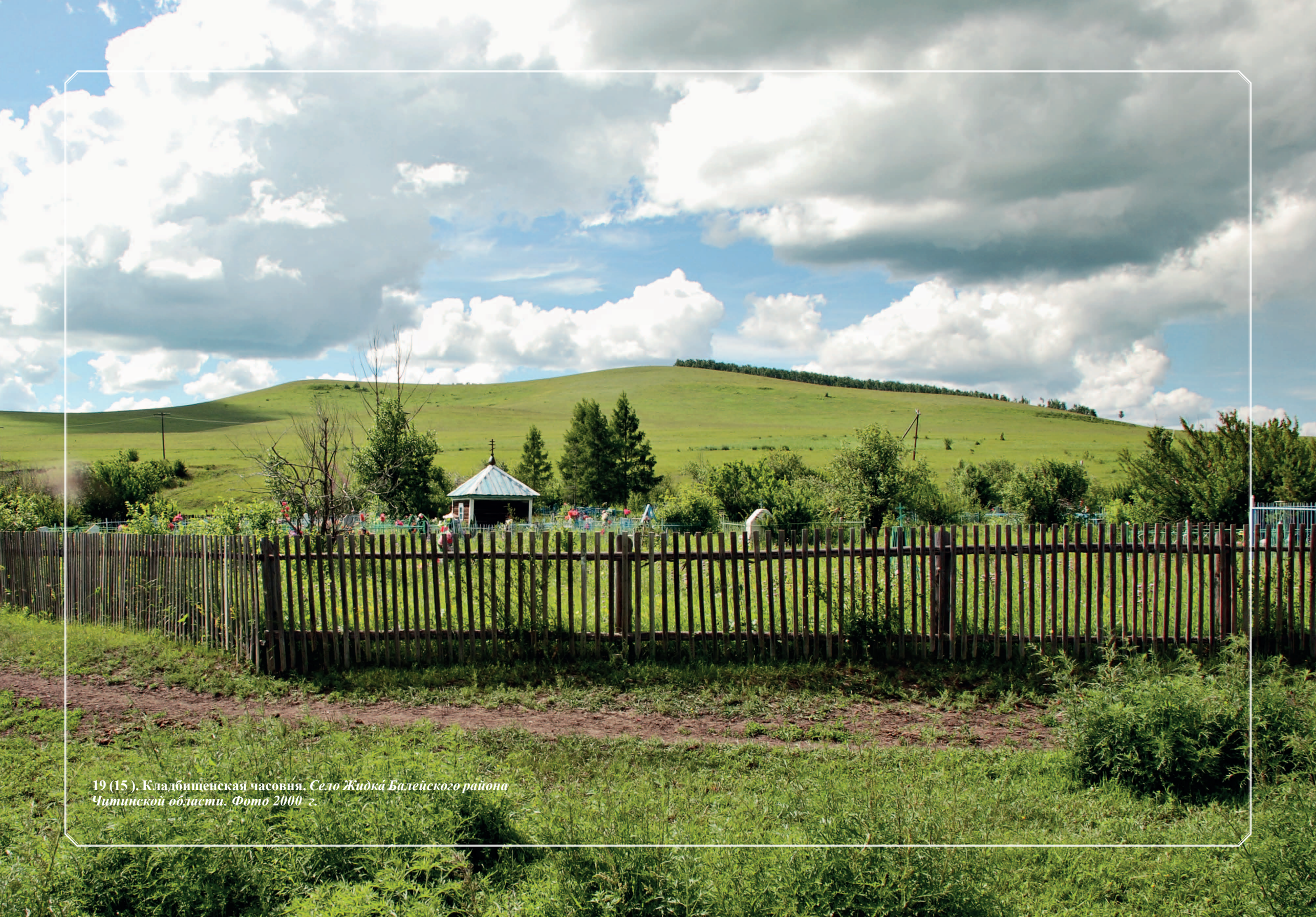
19 (15). Кладбищенская часовня. Село Жидка Балецкого района Читинской области. Фото 2000 г.