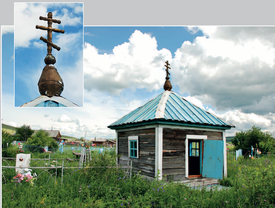
20–23 (14). Кладбищенская часовня; в левом углу — икона Божией Матери «Владимирская». Село Жидка́ Балейского района Читинской области. Фото 2000 г.