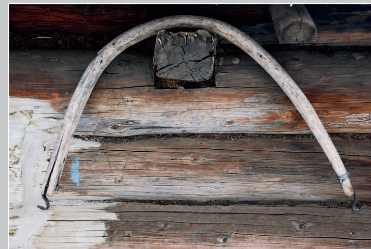
17 (15). Дугообразное деревянное приспособление для ношения двух вёдер с водой; разновидность коромысла. Деревня Дунгуй Кяхтинского района Республики Бурятия. Фото 1985 г.