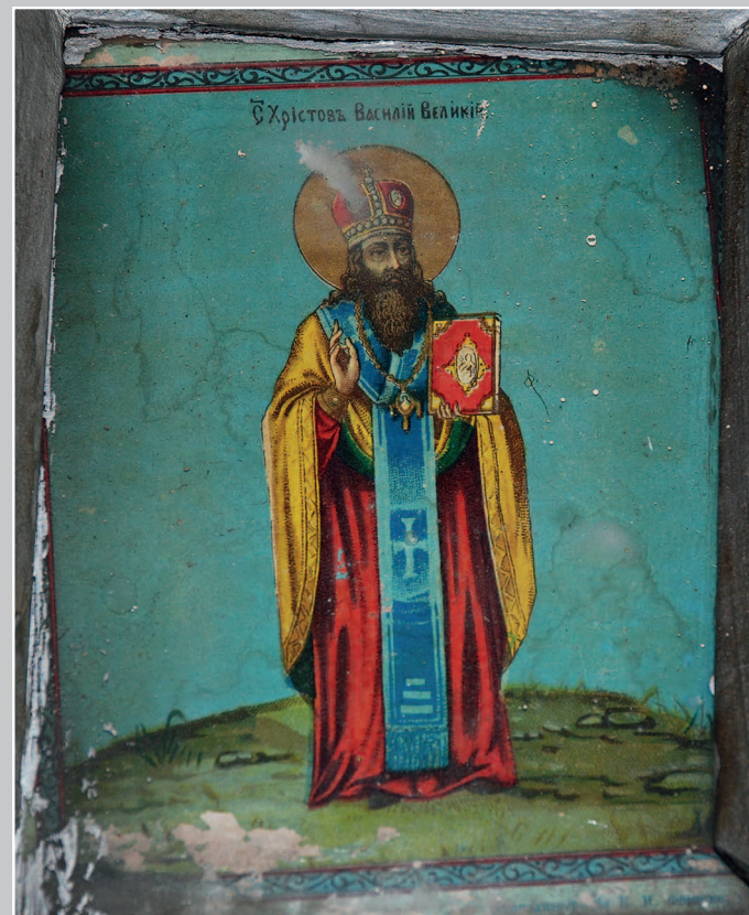
14 (15). Икона «Святитель Христов Василий Великий». (2-я пол. XIX в.). Село Горбуновка Нерчинско-Заводского района Читинской области. Фото 1998 г.