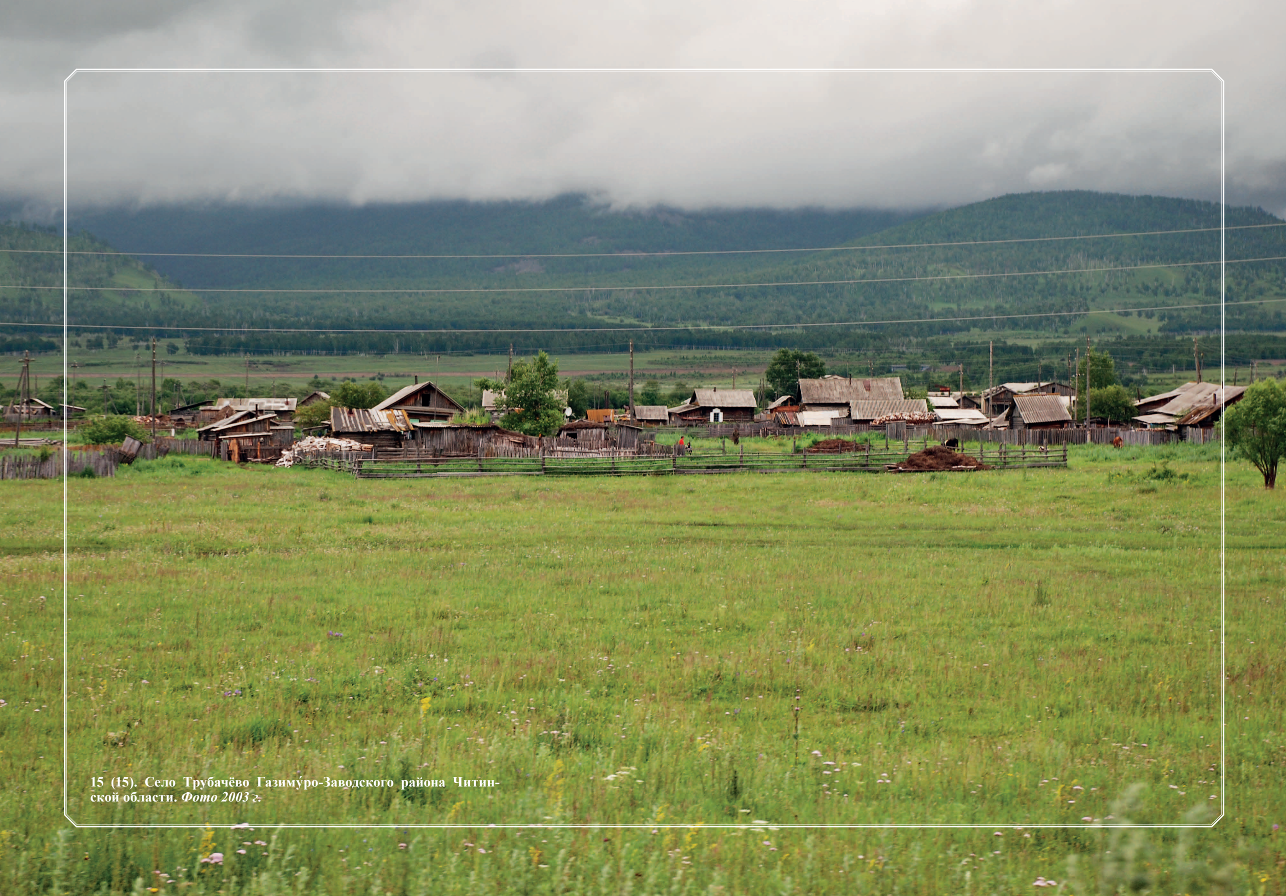
15 (15). Село Трубочёво Газимуро-Заводского района Читинской области. Фото 2003 г.