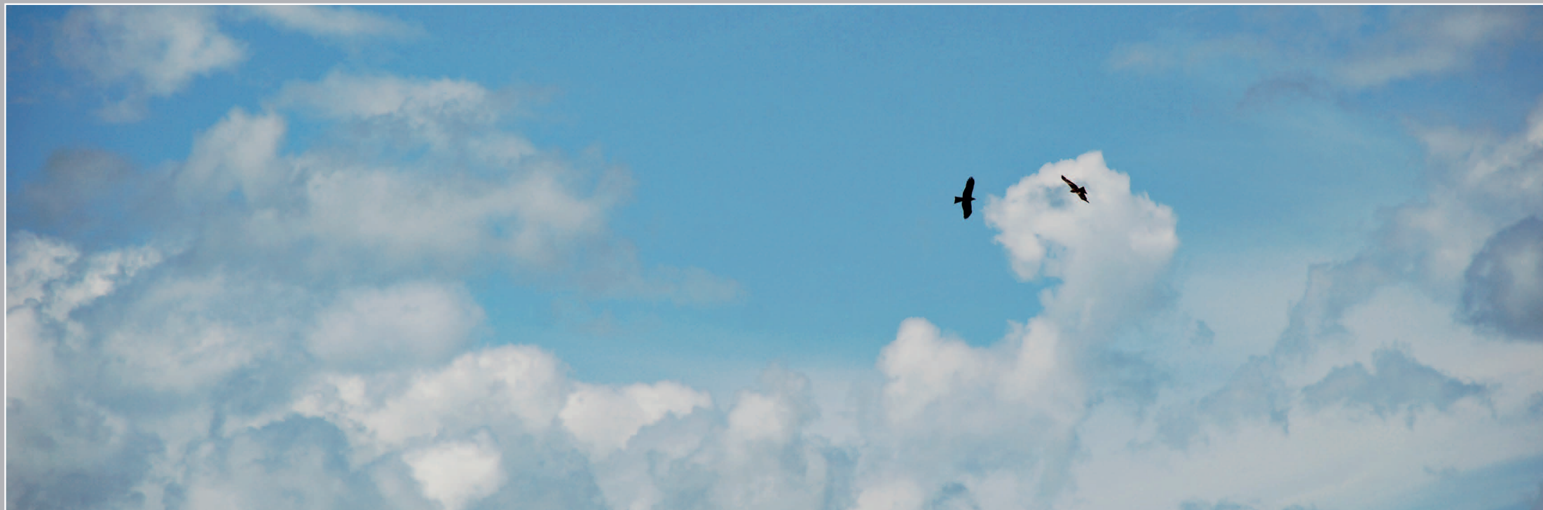
9–11 (15). Коршуны в полёте над селом Горный Зерентуй (на границе с Китаем). Нерчинско-Заводский район Читинской области. Фото 2011 г.