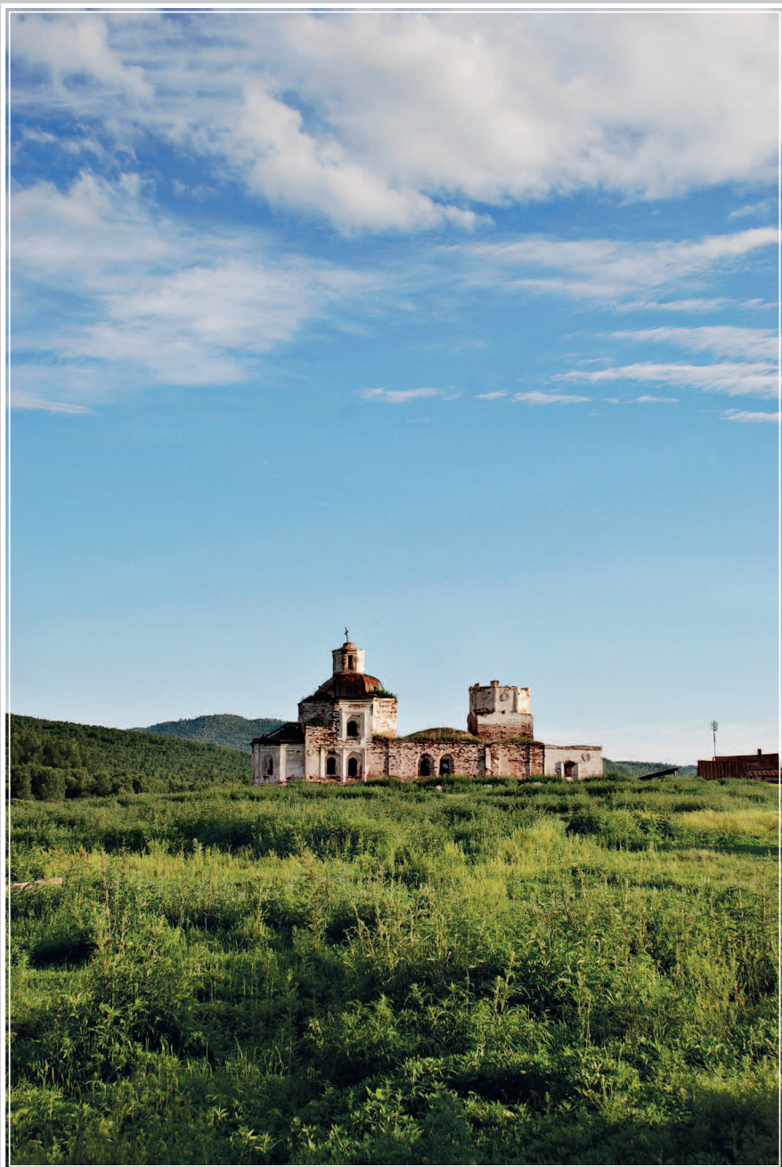
1 (15). Покровский храм (1815 г.) в селе Волочаевка Нерчинского района Читинской области. Фото 2007 г.