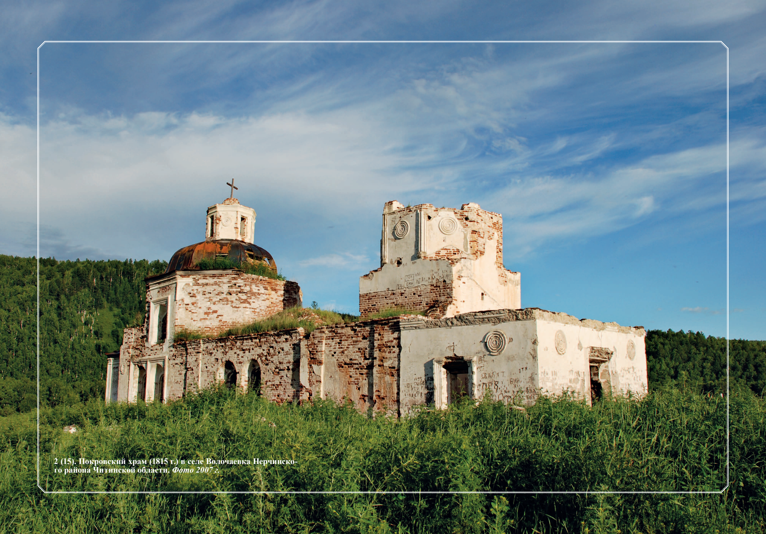
2 (15). Покровский храм (1815 г.) в селе Волочаевка Нерчинского района Читинской области. Фото 2007 г.