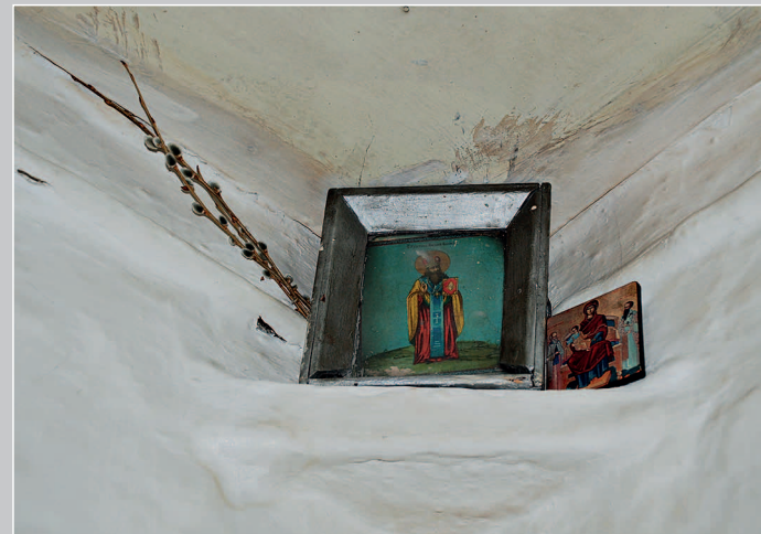
13 (15). «Красный» / «цветной» угол. Село Горбуновка Нерчинско-Заводского района Читинской области. Фото 1998 г.