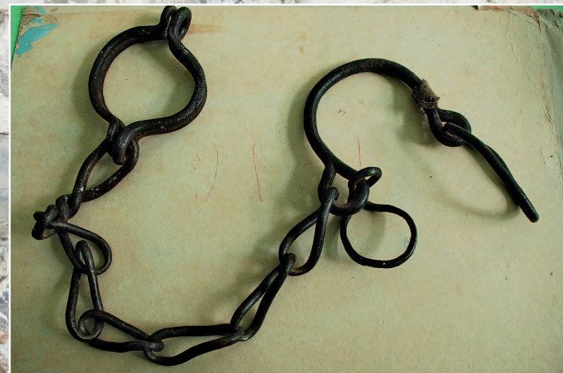
38–40 (14). Кованые кандалы, найденные на территории Акатуйской каторжной тюрьмы. Село Акатуй Александровского района Читинской области. Фото 1998 г.