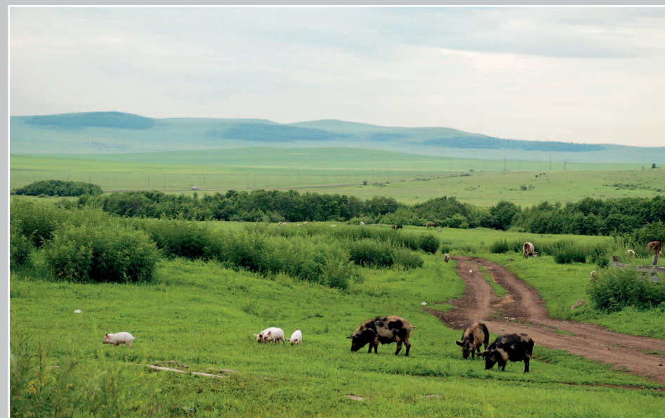
44 (14). На границе с Китаем. Село Горбуновка Нерчинско-Заводского района Читинской области. Фото 1997 г.