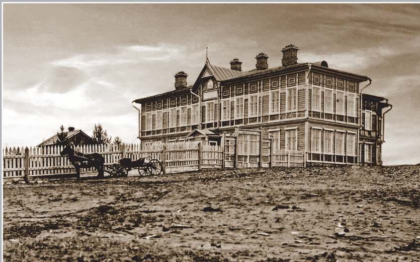
53 (14). Киренская второклассная школа. Фото 1913 г.