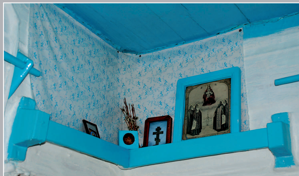
51–52 (14). «Красный угол», обитый тканью, называемой «божья рубашка» или «пелена» / «пеленá». Село Урлук Красночикойского района Читинской области. Фото 1999 г.