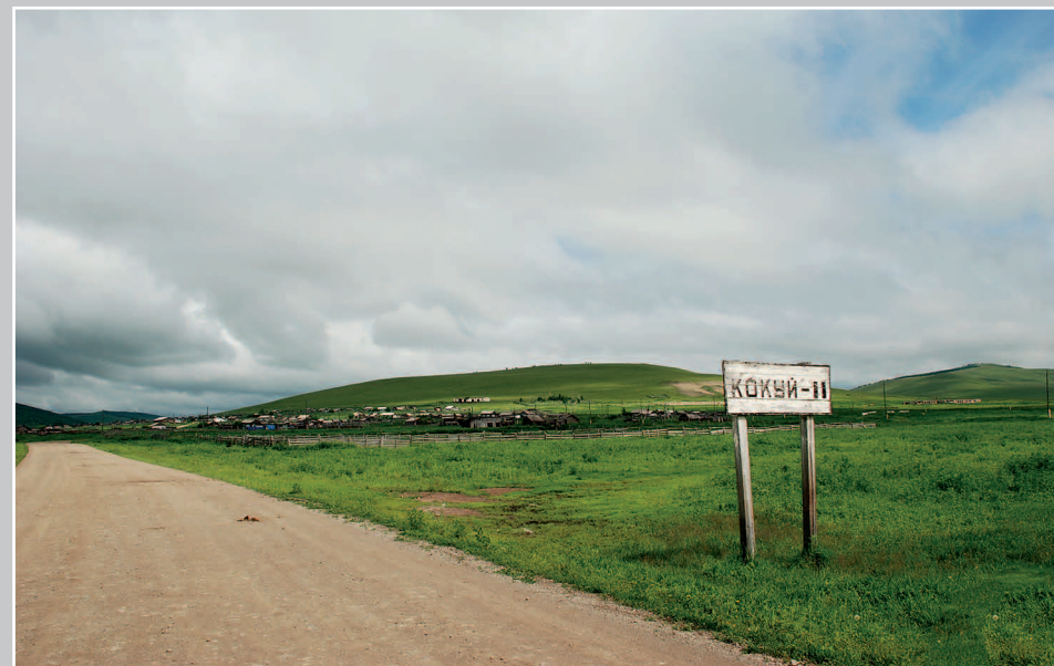
43 (14). Село Кокуй-2 Александрово-Заводского района Читинской области. Фото 1998 г.