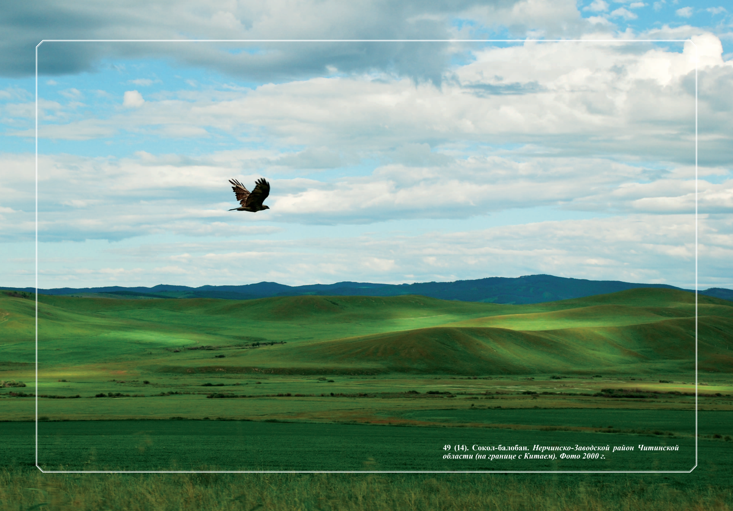
49 (14). Сокол-балобан. Нерчинско-Заводской район Читинской области (на границе с Китаем). Фото 2000 г.