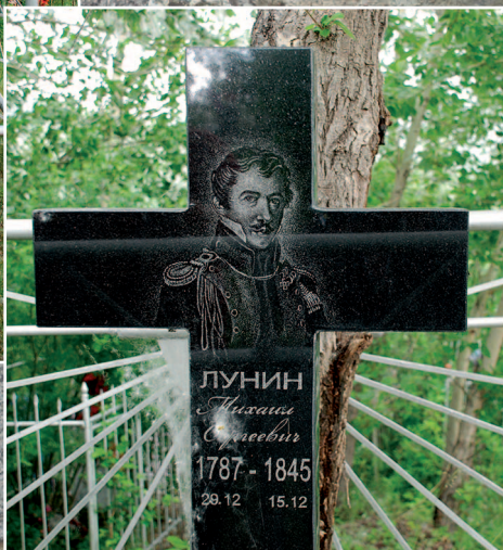
35–37 (14). Могила декабриста Михаила Сергеевича Лунина (1787–1845) в селе Акатуй Александровского района Читинской области. Фото 2008 г.

Последнее зрелище мое в пустынях Сибири, скажи, Чтоб мысли мои, по мере истины, в них заключавшейся, Распространялись и разбивались в сердца соотечественников.