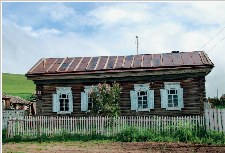
45–46 (14). Дом-пятистенок в селе Бурукан Газимуро-Заводского района Читинской области. Фото 1996 г.