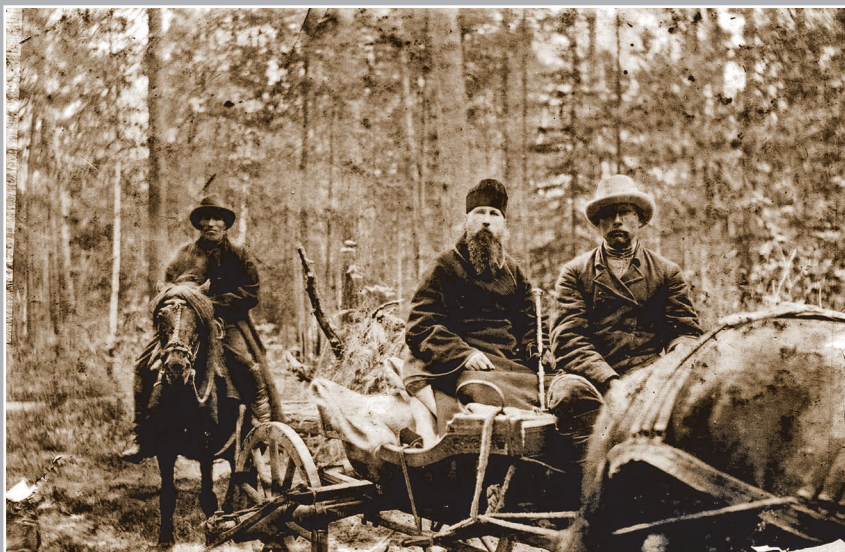
54 (14). Епископ Евгений (Зернов) во время поездки в Киренский уезд Иркутской губернии в июне-июле 1913 г. Фото 1913 г. (ГАИО. Р-2732, оп. 1, д. 2)