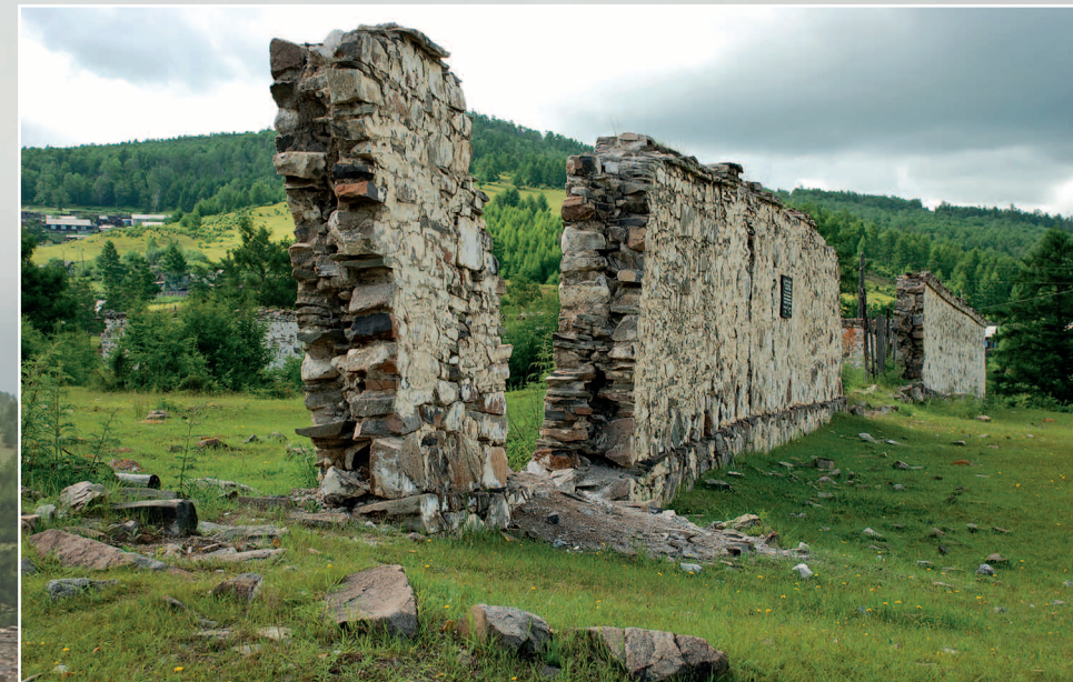
31-34 (14). Акатуйская каторжская тюрьма. Село Акатуй Александровского района Читинской области. Фото 2008 г.