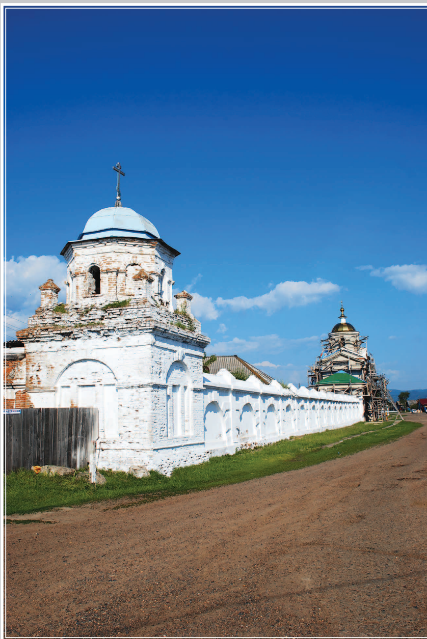
55 (13). Свято-Троицкий Селенгинский мужской монастырь (основан в конце XVII в.). Село Троицкое Прибайкальского района Республики Бурятия. Фото 2013 г.