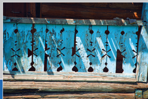
61–62 (13). Крыльцо дома (на «лиственничном окладе») с пропиленной резьбой. Село Чалбучи-Килга Нерчинско-Заводского района Читинской области (граница с Китаем). Фото 2011 г.