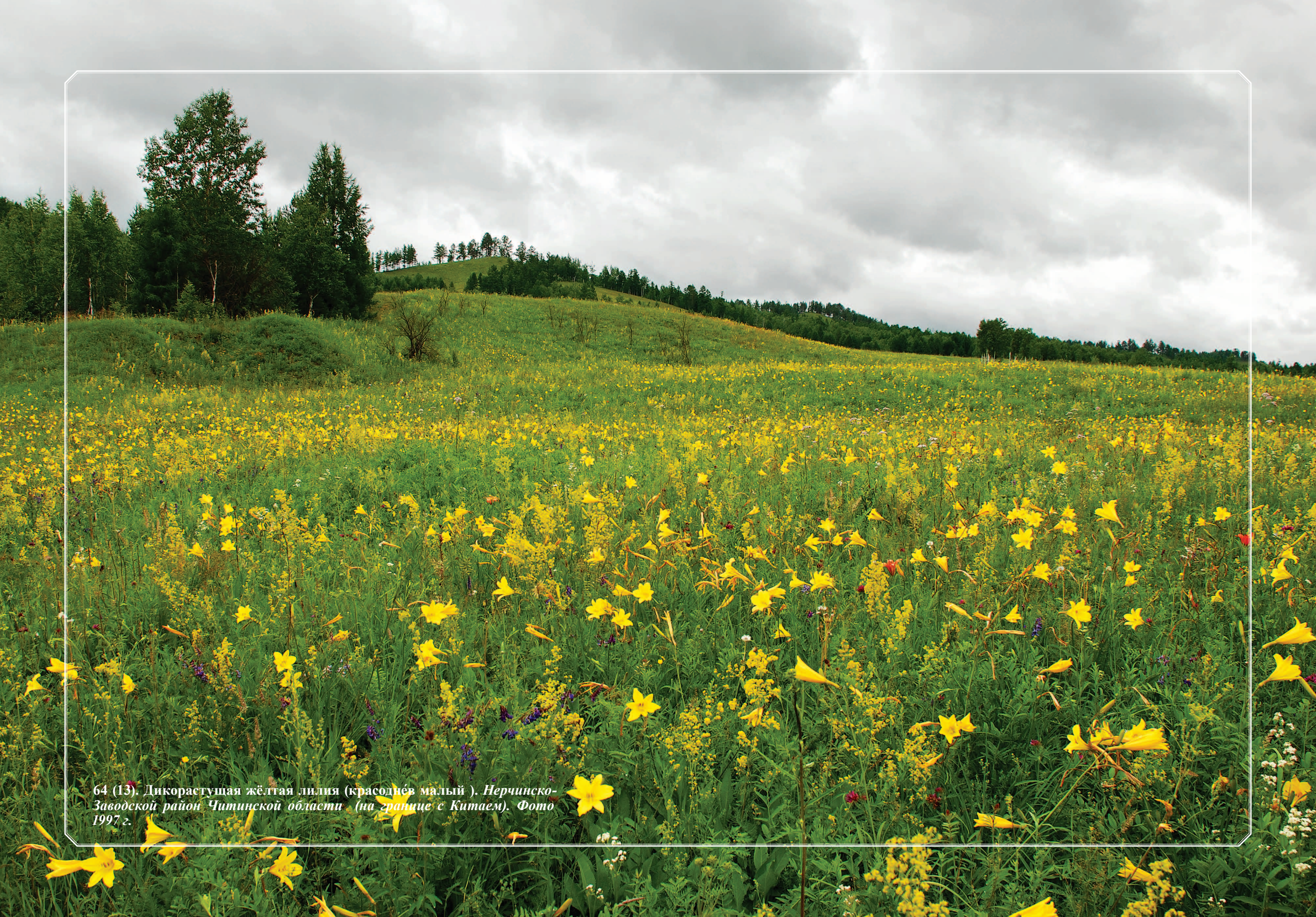
64 (13). Дикорастущая жёлтая лилия (красоднёв малый). Нерчинско-Заводской район Читинской области (на границе с Китаем). Фото 1997 г.