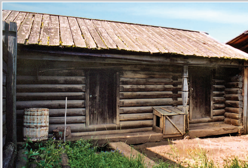
76 (13). Двухкамерный «хлебный» амбар, крытый «дранкой» — тонкими деревянными досками. Село Карам Казачинско-Ленского района Иркутской области. Фото 1986 г.