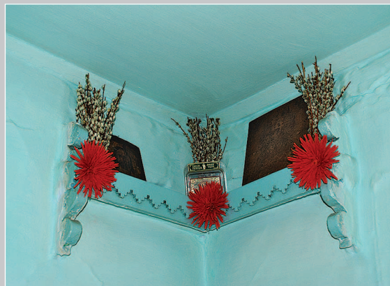
60 (13). «Красный угол». Село Колмогорово Енисейского района Красноярского края. Фото 1995 г.