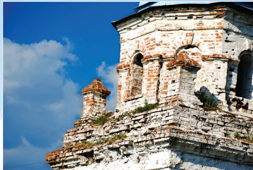
56–59 (13). Свято-Троицкий Селенгинский мужской монастырь (основан в конце XVII в.). Село Троицкое Прибайкальского района Республики Бурятия. Фото 2013 г.