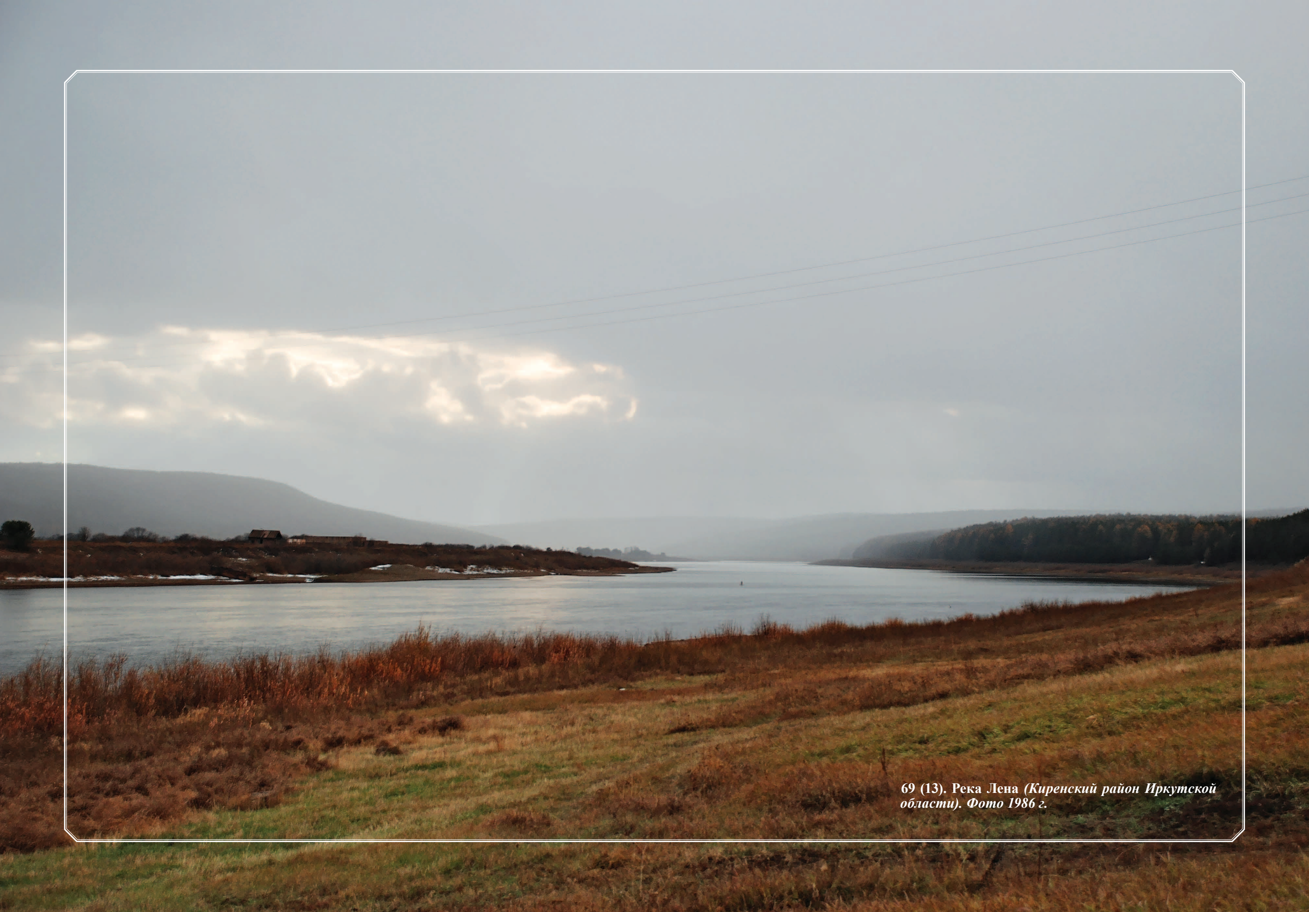
69 (13). Река Лена (Киренский район Иркутской области). Фото 1986 г.