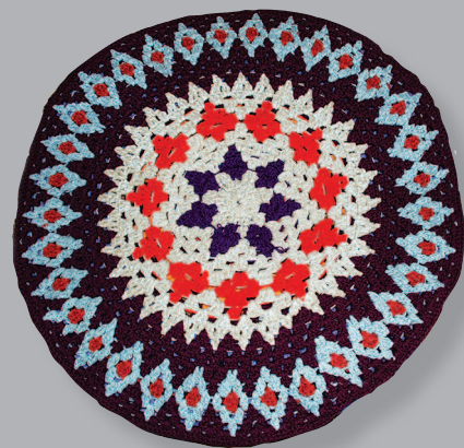
65–66 (13). «Кружки» — круглые коврики, связанные крючком. Село Вершина Шахтомы Шелопугинского района Читинской области. Фото 2001 г.