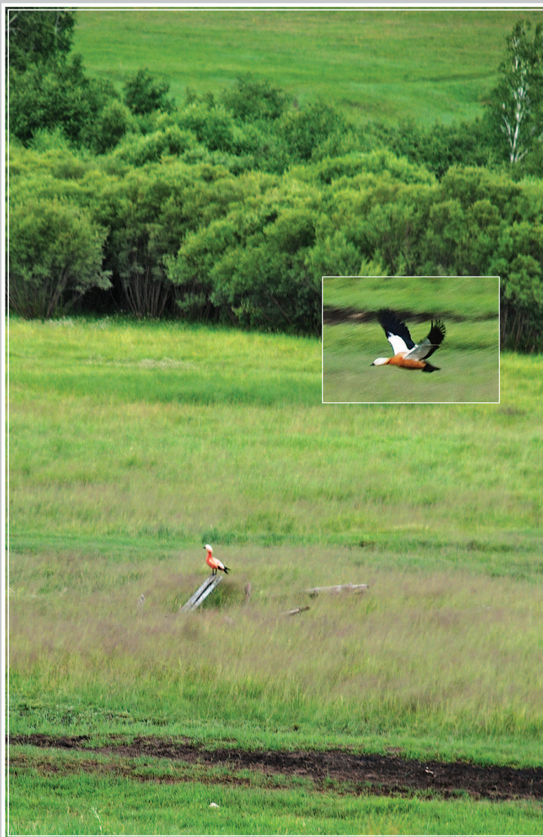
82–83 (13). Красная утка, огарь. Деревня Булдуруй-1 Нерчинско-Заводского района Читинской области (на границе с Китаем). Фото 1989 г.