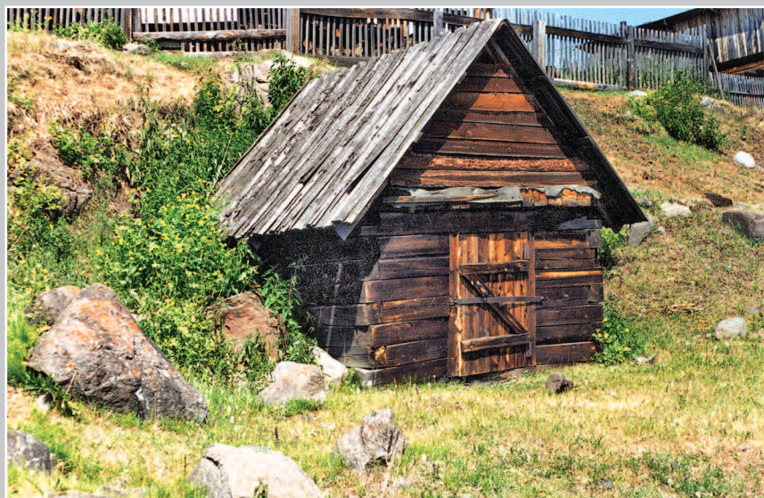
77 (13). Самолóвник — строение (избушка) для хранения рыболовных снастей, расположенное на берегу реки Ангары. Село Коблякóво Братского района Иркутской области. Фото 1997 г.