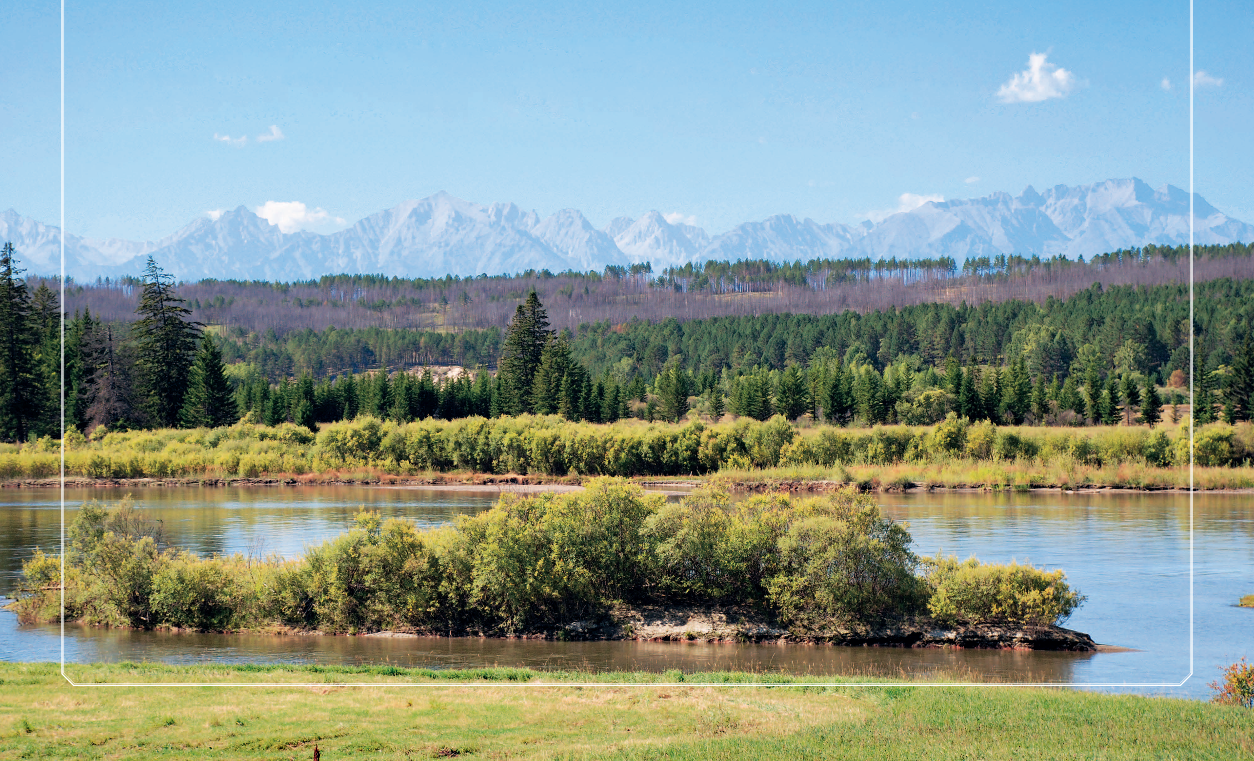
70 (12). Долина реки Иркут. Тункинский район Республики Бурятия. Фото 1998 г.