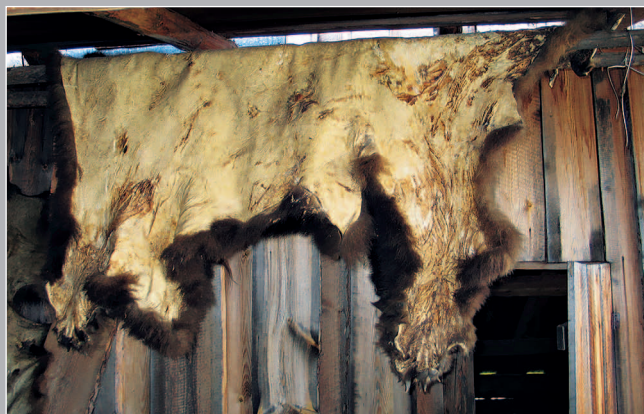
81 (12). Сушка шкуры медведя. Село Яркино Кежемского района Красноярского края. Фото 1987 г.