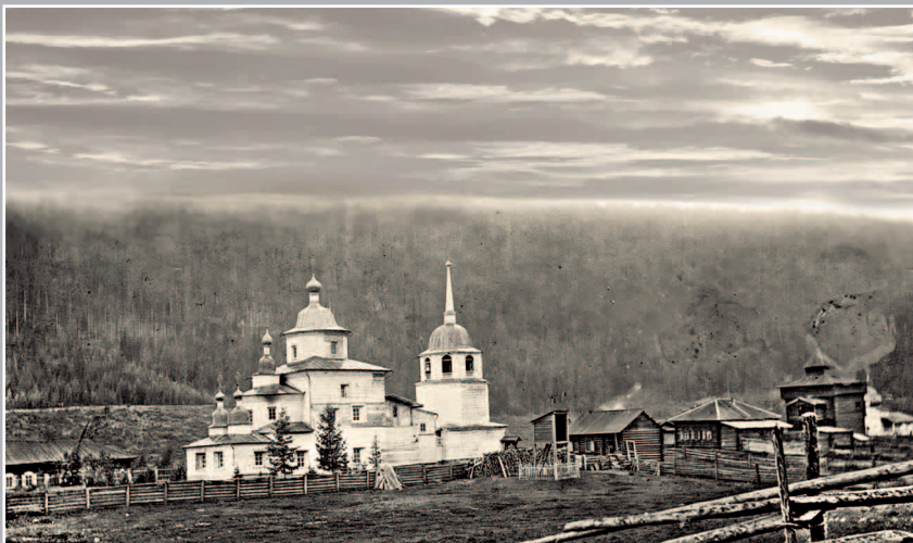
89 (12). Спасский храм в г. Илимске. Фото 1913 г. (ГАИО. Р-2732, оп. 1, д. 2)