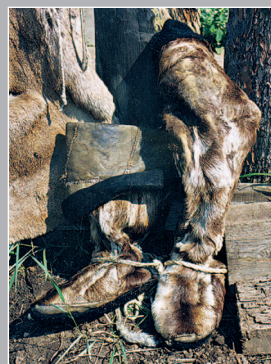
78 (12) Торбазá — обувь с удлиненными (выше колен) голенищами из камаса (шкуры с ног оленя, мехом наружу). Село Ключи-Булак Братского района Иркутской области. Фото 2004 г.