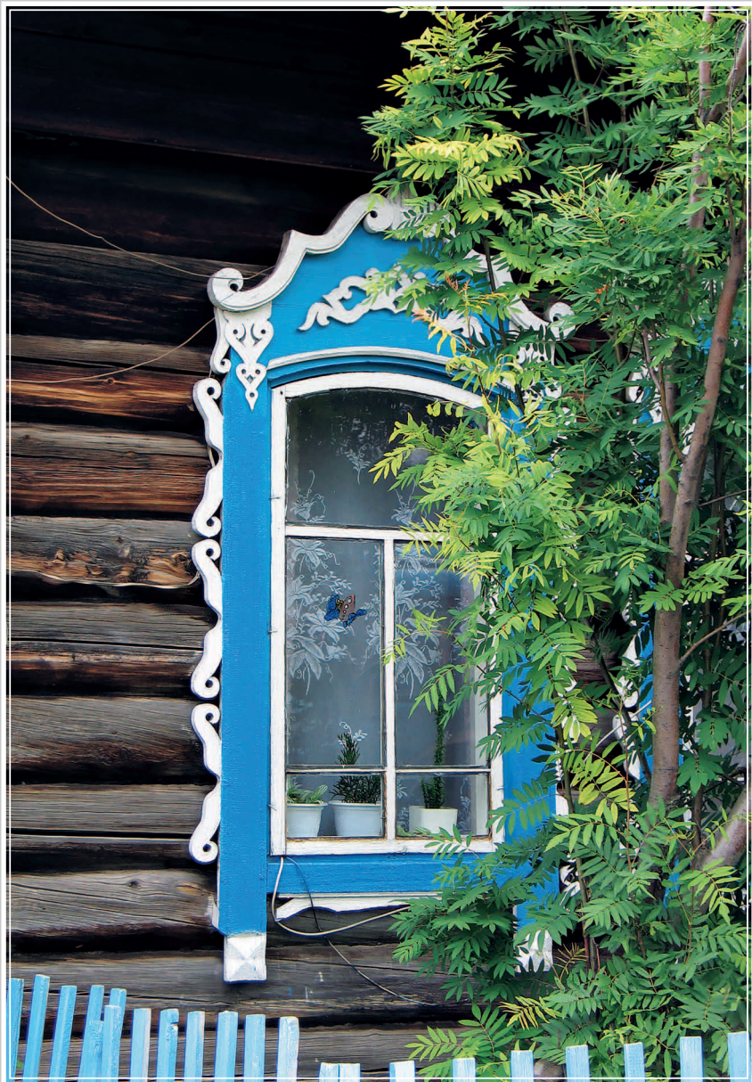
65 (12). Окно с накладной резьбой. Село Панóво Кежемского района Красноярского края. Фото 1987 г.