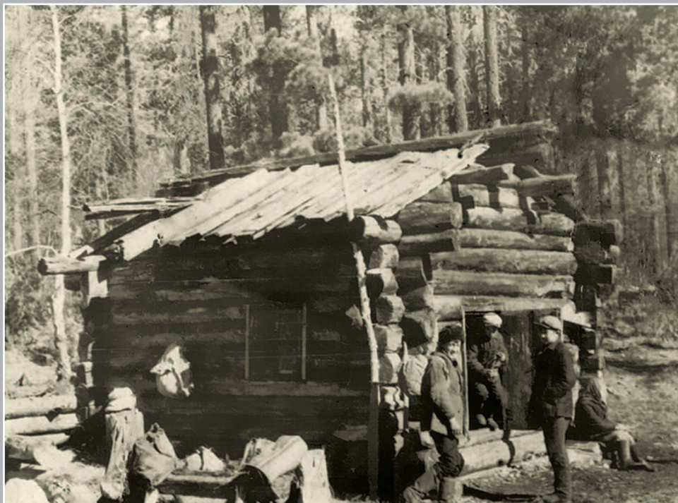
80 (12). Охотничье зимовье. Кежемский район Красноярского края. Фото 1979 г.