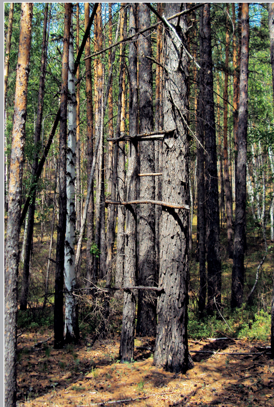
83 (12). Засидка / сидка — специально сооруженное и замаскированное укрытие на дереве (на солонцах), используемое для подкарауливания зверя или птицы во время охоты. Село Менза Красночикойского района Читинской области. Фото 2000 г.