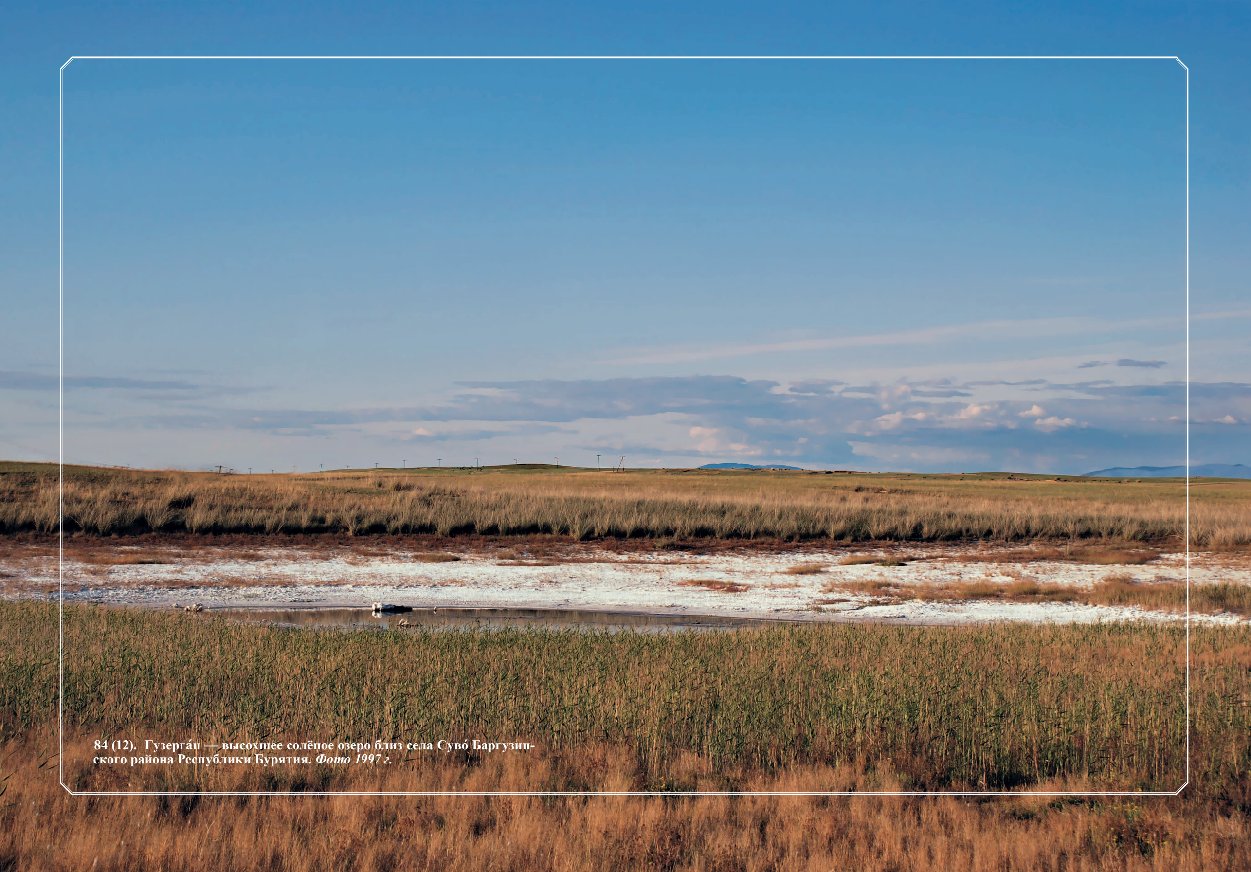
84 (12). Гузерган — высохшее солёное озеро близ села Суво́ Баргузинского района Республики Бурятия. Фото 1997 г.