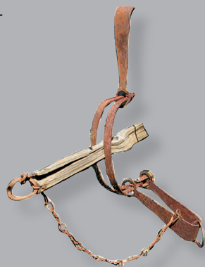
82 (12). Кованый капкан на дикого зверя. Село Юрхота Кежемского района Красноярского края. Фото 1987 г.