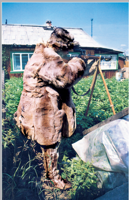
77 (12) Сóшки — приспособление для обеспечения устойчивого положения ручья во время выстрела. Село Ключи-Булак Братского района Иркутской области. Фото 2004 г.