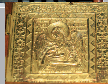
86–88 (12). «Красный угол» с иконами и меднолитыми складнями. Село Безьянка Енисейского района Красноярского края. Фото 1987 г.