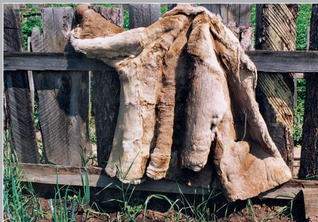
76 (12). Парка — охотничья куртка из шкуры сохагого / оленя. Село Ключи-Булак Братского района Иркутской области. Фото 2004 г.