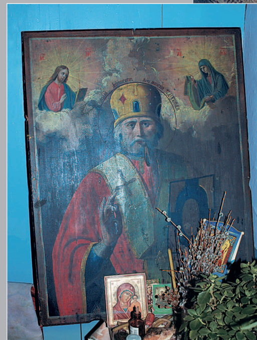
59 (11). Икона «Святитель Николай Чудотворец» (вторая половина XIX в.). Село Карам Казачинско-Ленского района Иркутской области. Фото 1998 г.