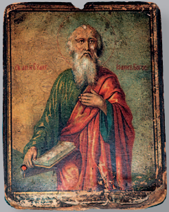
75 (11). Икона «Святой апостол и евангелист Иоанн Богослов» (нач. XX в.). Село Архангельское Красночико́йского района Читинской области. Фото 1999 г.