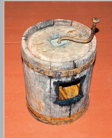
63–64 (11). Маслобойки. Поселок Кежма Кежемского района Красноярского края. Фото 1986 г.