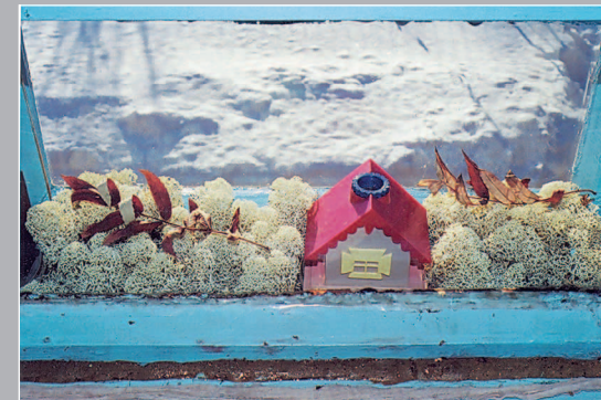
71–72 (11). «Межоконники» — фигурки и другие предметы, украшающие пространство между рамами окон в зимний период. Поселок Пинцуга Богучанского района Красноярского края. Фото 1987 г.