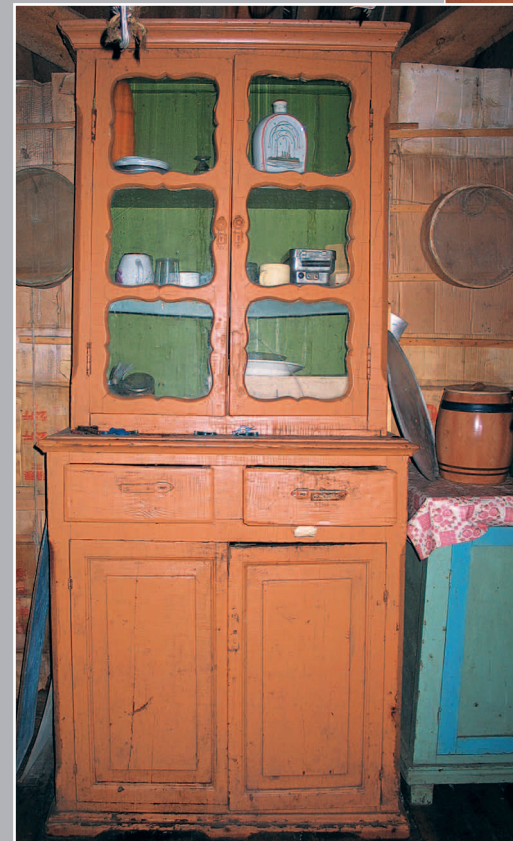
65 (11). Буфет, сделанный мастером из села Усть-Вихорево Братского района. Село Кобляково Братского района Иркутской области. Фото 1986 г.