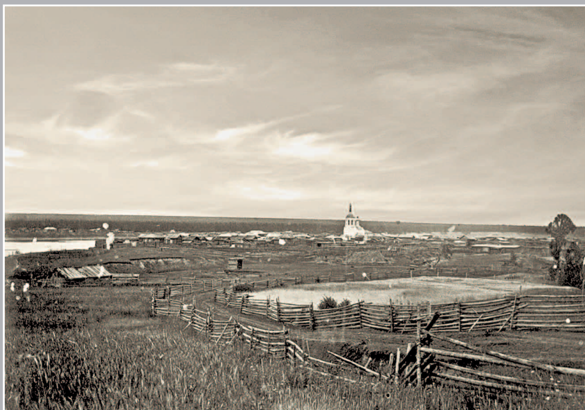
81 (11). [Панорама г. Илимска]. Фото 1913 г. (ГАИО. Р-2732, оп. 1, д. 2)