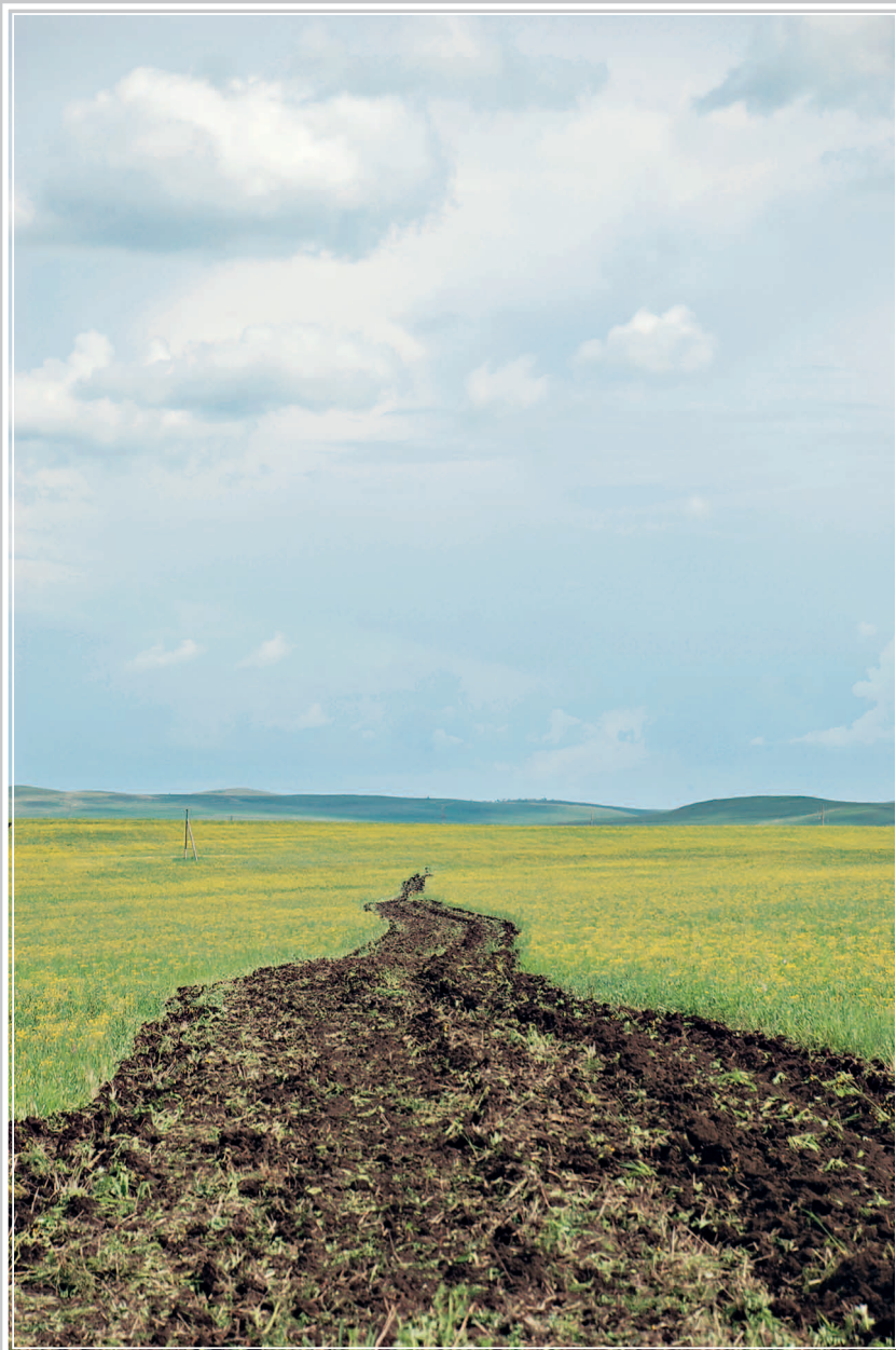
55 (11). Свежевспаханная межевая борозда (Кыринский район Читинской области). Фото 1998 г.