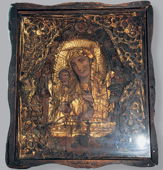
77 (11). Икона «Богоматерь с младенцем» в фольговом окладе (нач. XX в.). Село Архангельское Красночико́йского района Читинской области. Фото 1994 г.