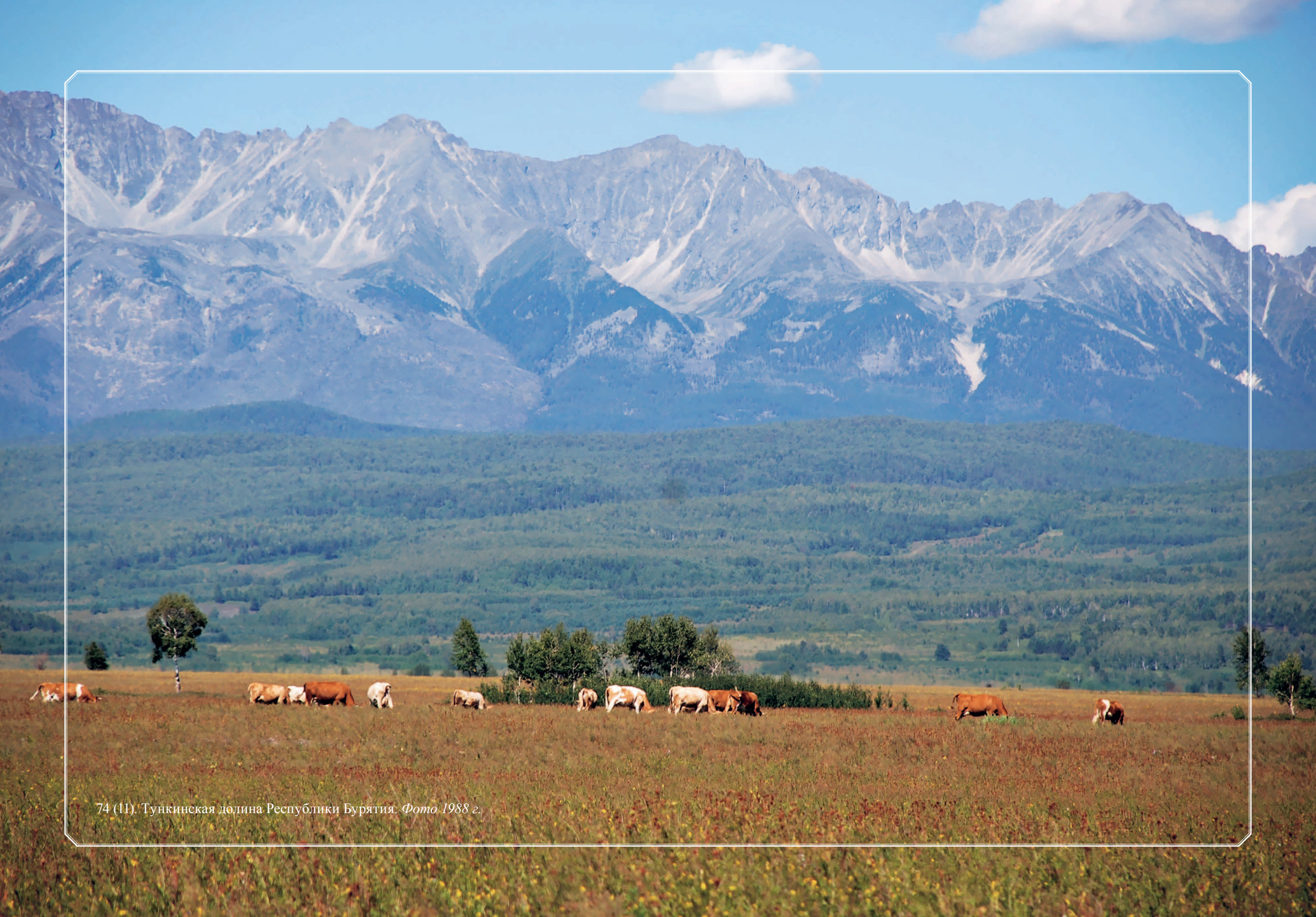
74 (11). Тункинская долина Республики Бурятия. Фото 1988 г.