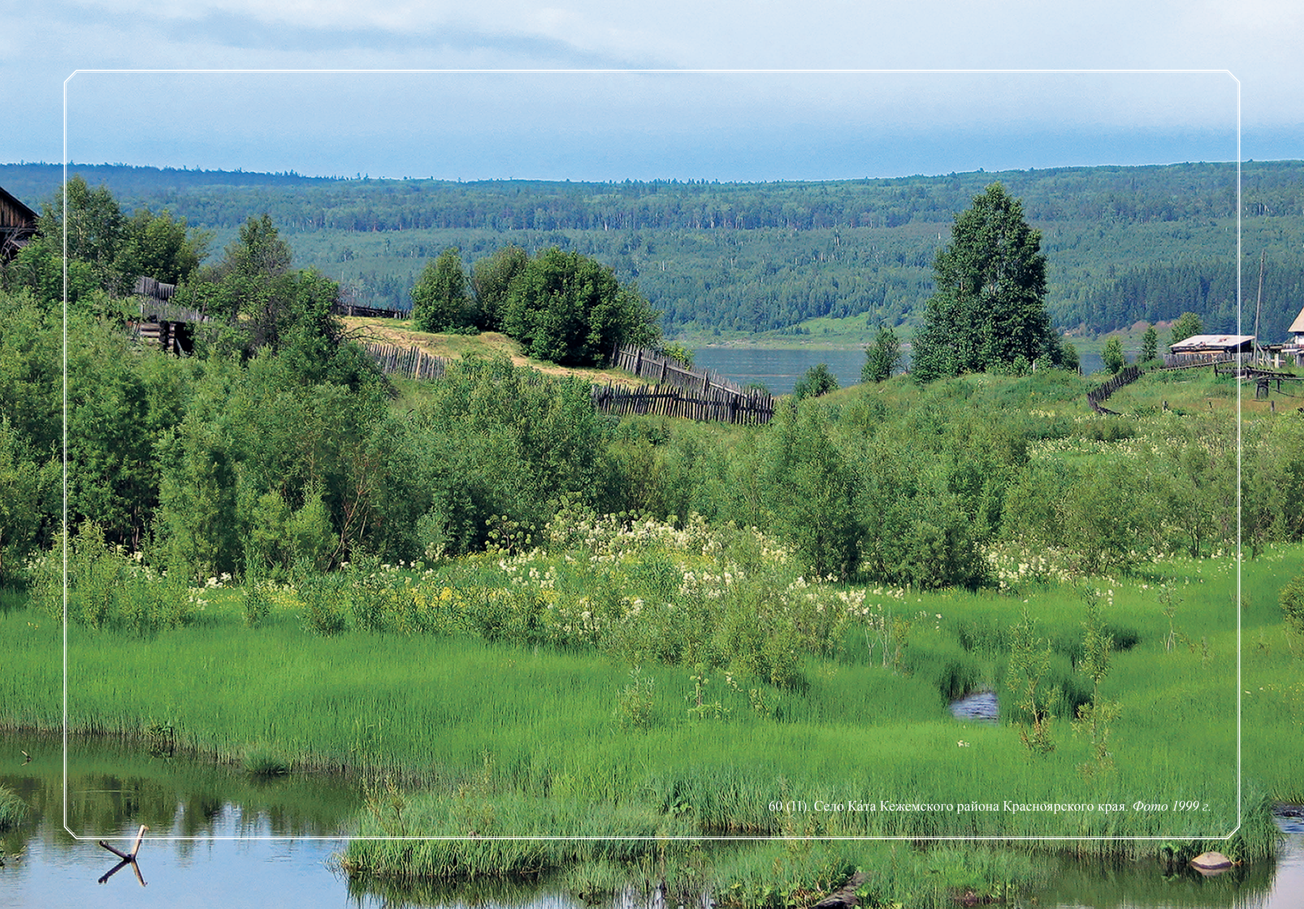
60 (11). Село Кáга Кежемского района Красноярского края. Фото 1999 г.