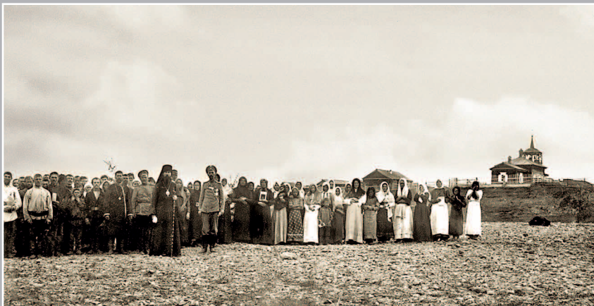
80 (11). Приписной храм в селе Бубновском Тубинского прихода. Фото 1913 г. (ГАИО. Р-2732, оп. 1, д. 2)