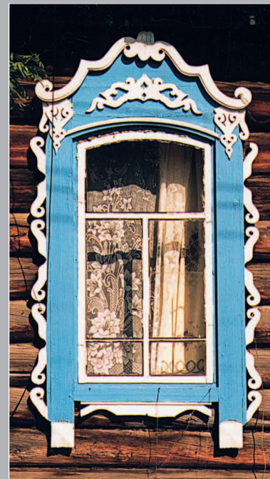
70 (11). Окно, украшенное накладной резьбой. Село Паново Кежемского района Красноярского края. Фото 1987 г.