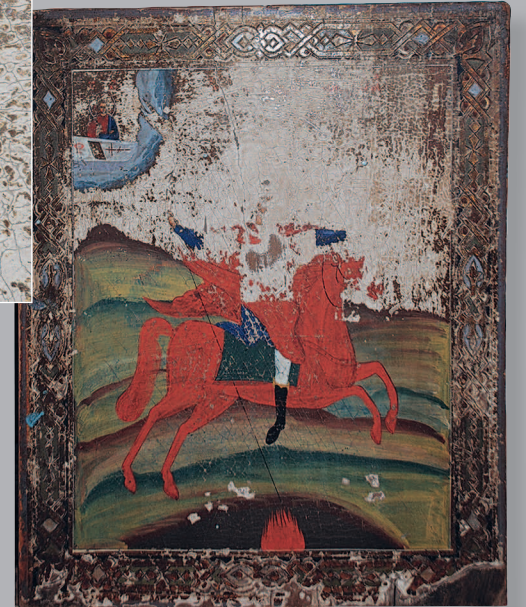
78–79 (11). Икона «Святой Архангел Гавриил — грозных сил воевода» (нач. XX в.) и ее фрагмент (слева). Село Чикой Красночико́йского района Читинской области. Фото 1997 г.