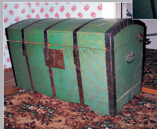
41 (11). Сундук для хранения вещей, обитый жостью. Село Моисеевка Заларинского района Иркутской области. Фото 1996 г.