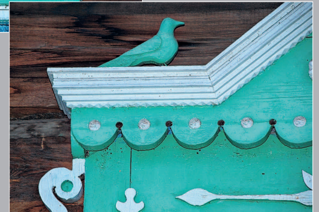
45–48 (11). Очелья окон, украшенные деревянными фигурами птиц. Село Карам Казачинско-Ленского района Иркутской области. Фото 1996 г.