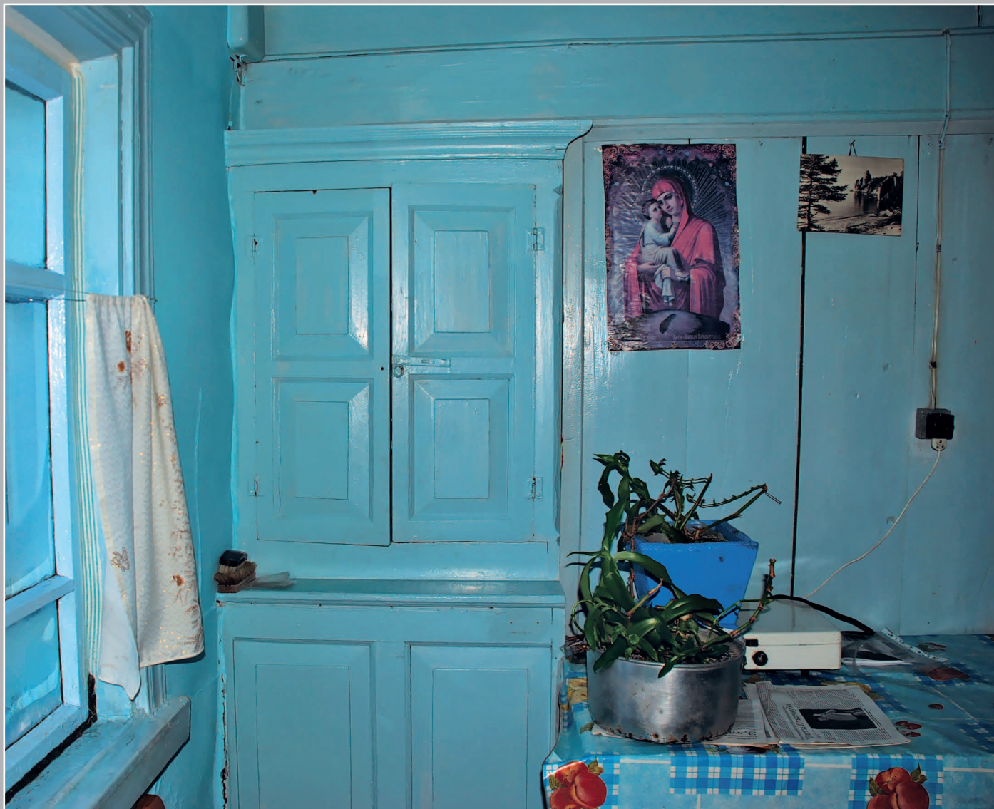
36 (11). Буфет, встроенный в стену дома. Справа: печатная икона Богородицы с младенцем. Село Карам Казачинско-Ленского района Иркутской области. Фото 1997 г.