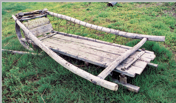
51 (11). Сани-ро́звальни. Село Усольцево Кежемского района Красноярского края. Фото 1987 г.