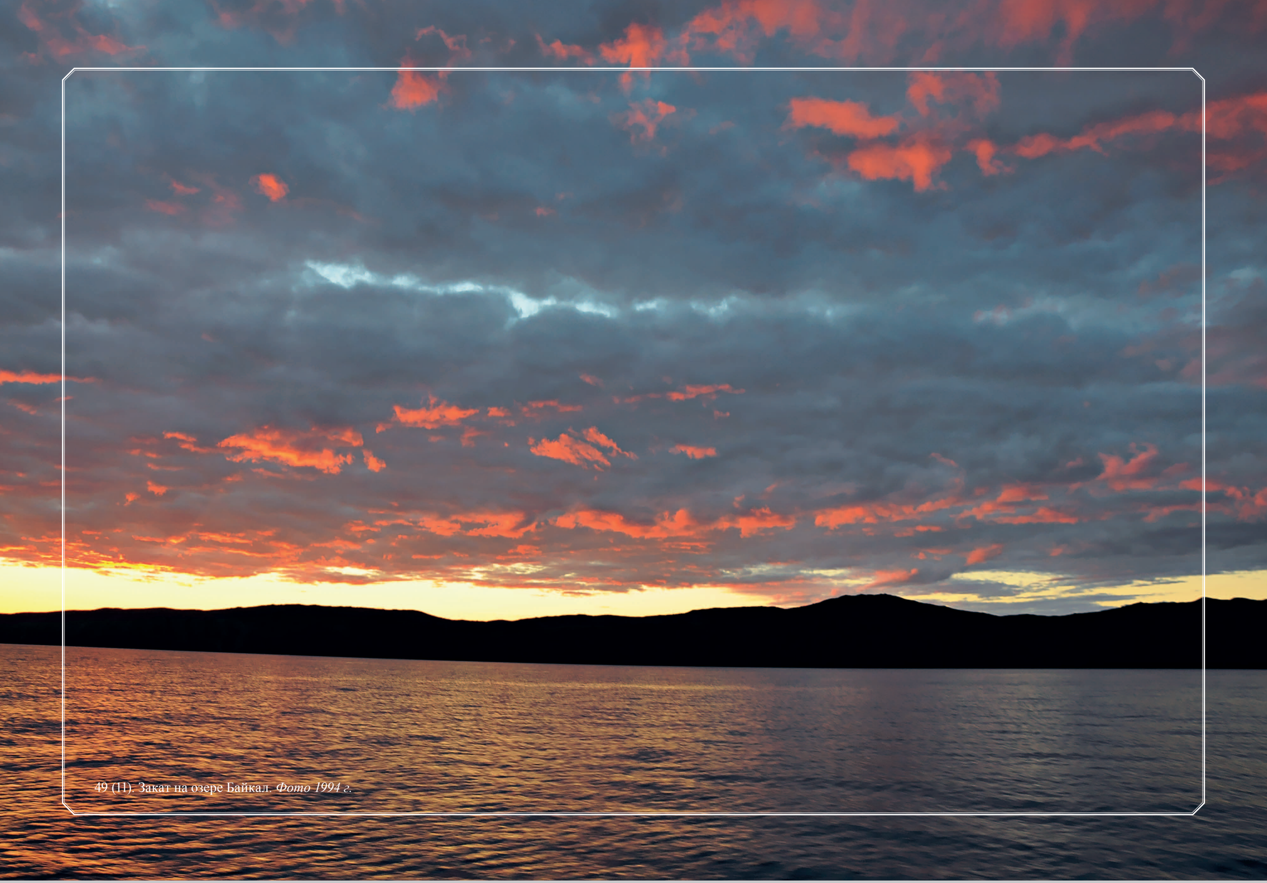
49 (11). Закат на озере Байкал. Фото 1994 г.