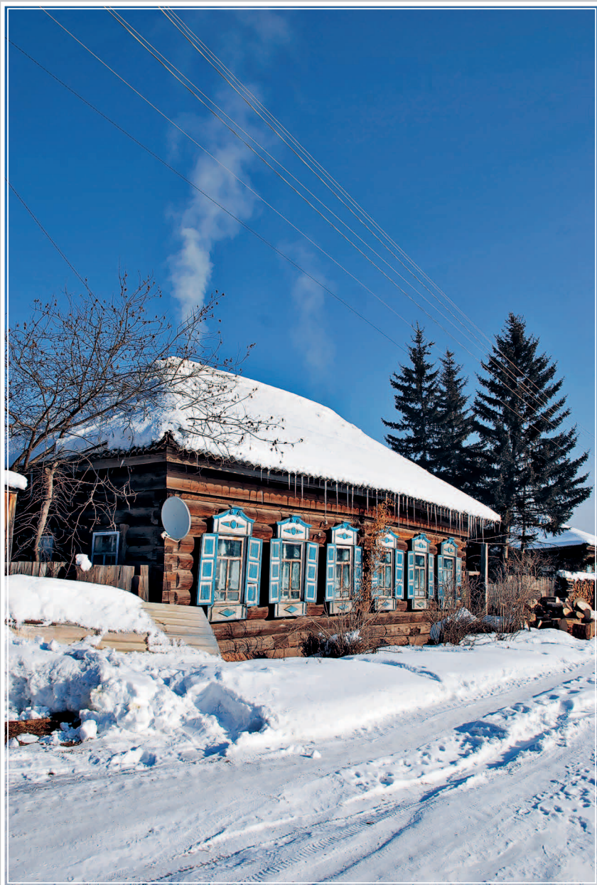
34 (11). Дом-пятистенок в селе Верхнемарково Усть-Кутского района Иркутской области. Фото 2001 г.