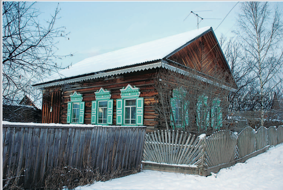
43–44 (11). Дома с двухскатной крышей. Село Карам Казачинско-Ленского района Иркутской области. Фото 1997 г.