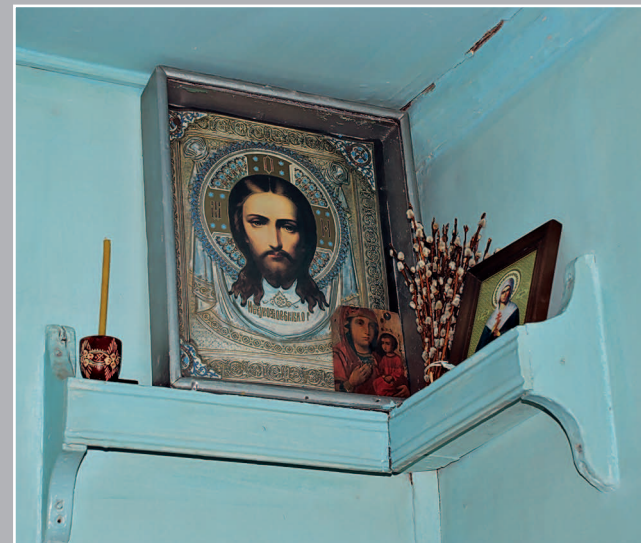
37 (11). Красный угол с иконами Спаса Нерукотворного и Богородицы (XX в.). Село Карам Казачинско-Ленского района Иркутской области. Фото 1996 г.