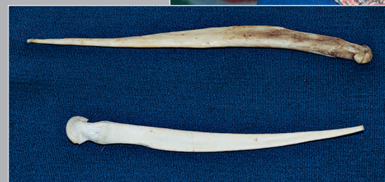
40 (11). Вязальные крючки, сделанные из бедренной кости оленя. Село Карам Казачинско-Ленского района Иркутской области. Фото 2010 г.