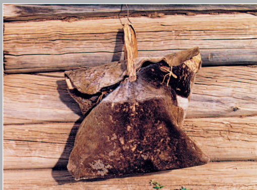
50 (11). Охотничья сумá из выделанной кожи байкальской нерпы. Село Дашикачан Северобайкальского района Республики Бурятия. Фото 1987 г.