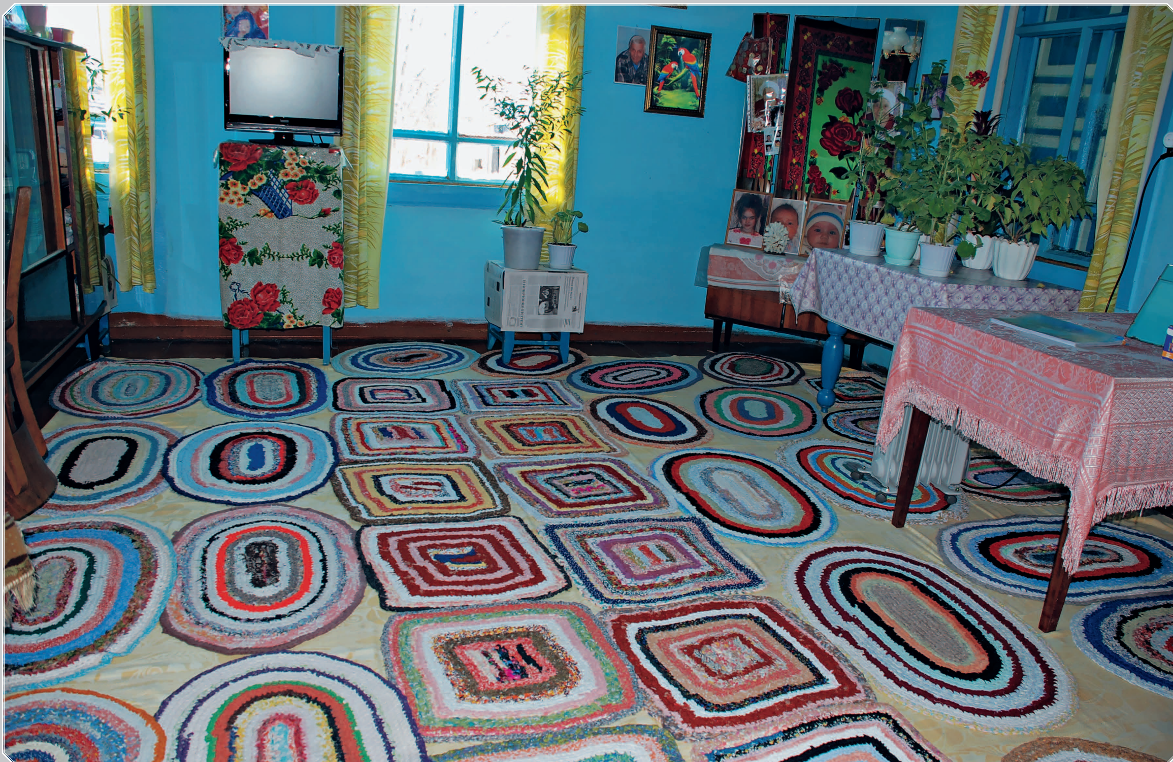
42 (11). Вязаные «кружки» из драпок (лоскутков, узких полосок ткани от старых вещей). Село Карам Казачинско-Ленского района Иркутской области. Фото 2010 г.