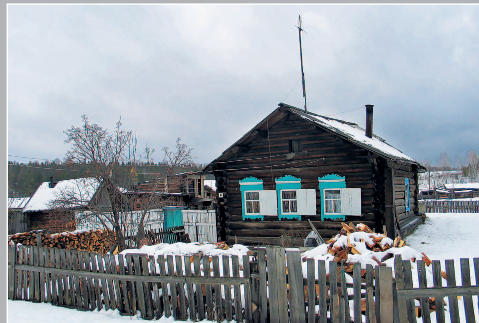
35 (11). Дом с окнами-«одноставешками». Село Карам Казачинско-Ленского района Иркутской области. Фото 1996 г.