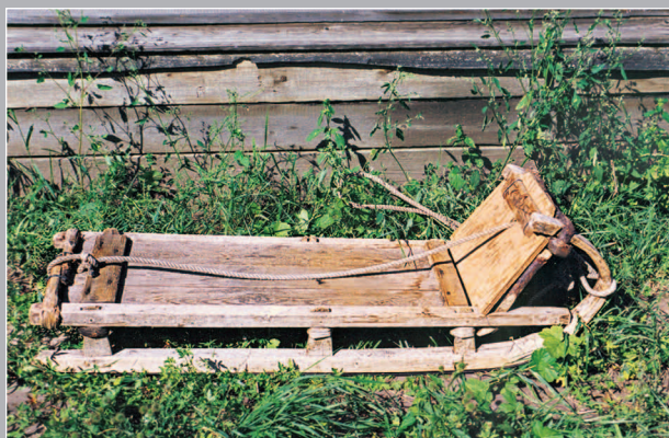
52 (11). Сани, служащие для перевозки дров — «дровянички». Село Усольцево Кежемского района Красноярского края. Фото 1987 г.