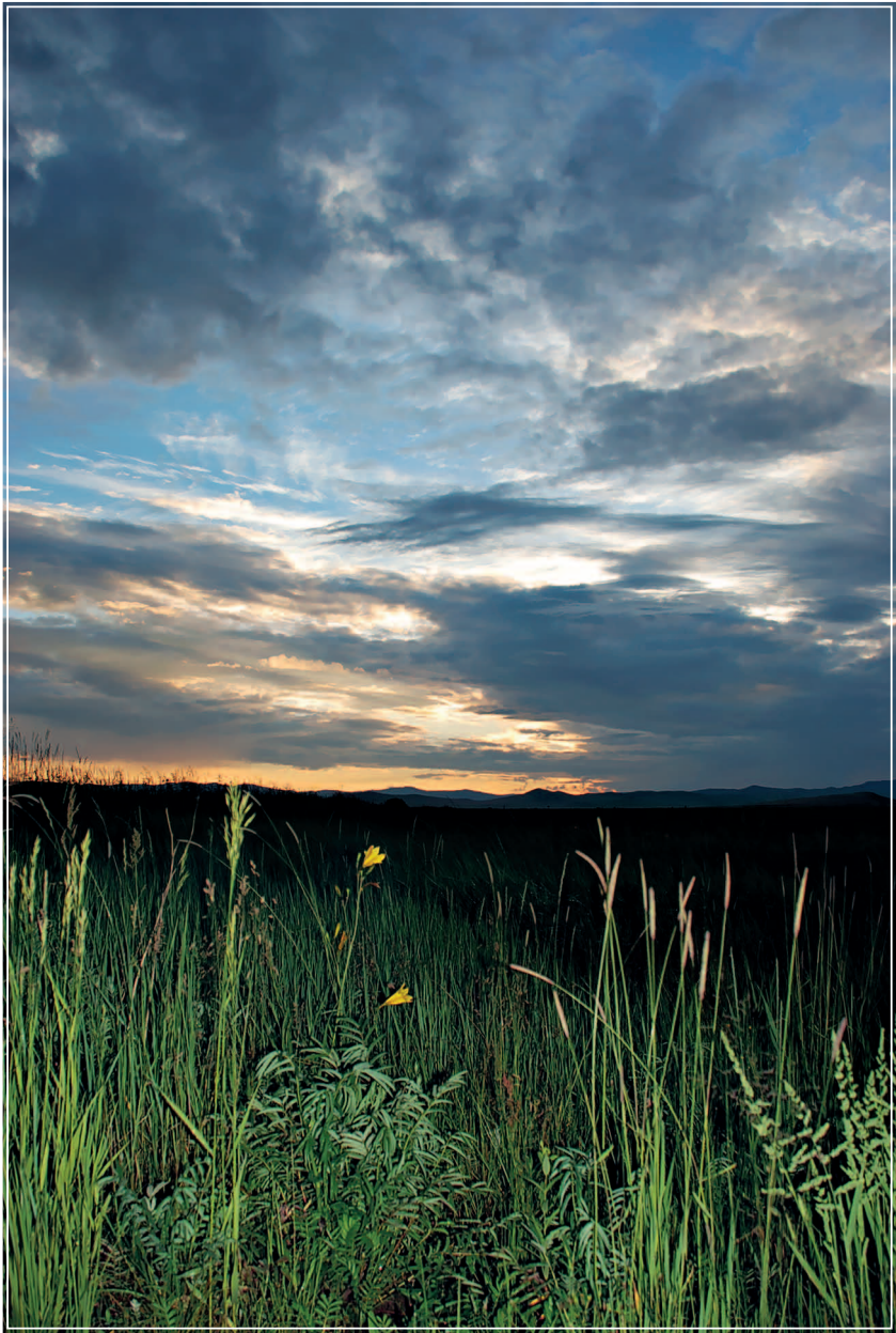
54 (11). Закат в южных степях Забайкалья (Калганский район Читинской области). Фото 2008 г.