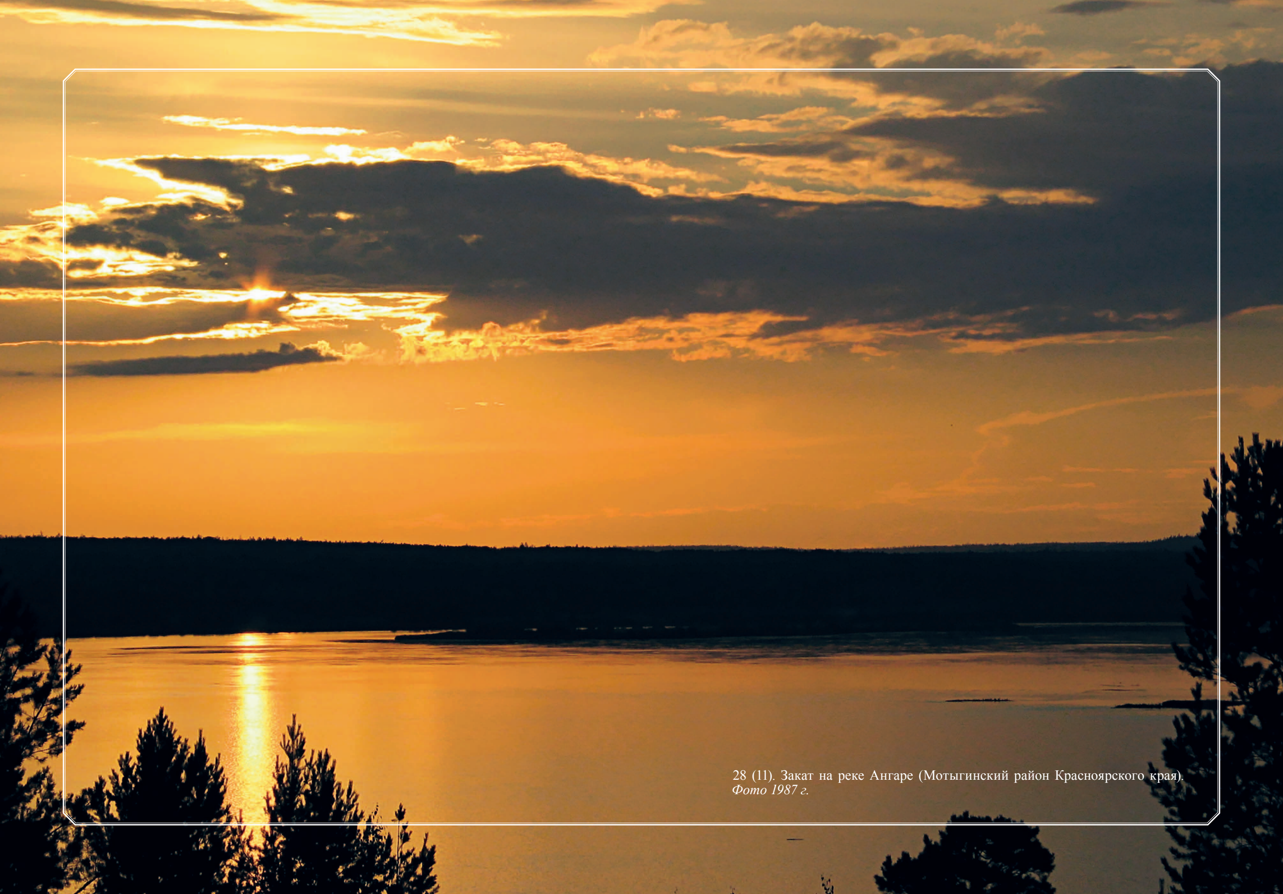
28 (11). Закат на реке Ангаре (Мотыгинский район Красноярского края). Фото 1987 г.