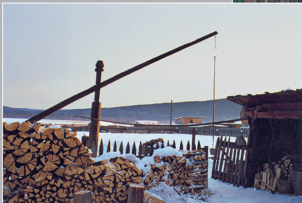
21 (11). Колодец-журавль с длинным шестом (бечепом), применяемым для подъёма воды. Село Мангут Кыринского района Читинской области. Фото 1987 г.