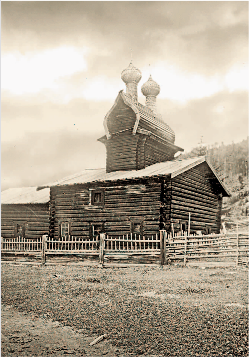
33 (11). Приписной Введенский храм (в 2-х верстах от Илимска). Фото 1913 г. (ГАИО. Р-2732, оп. 1, д. 2)