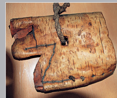
32 (11). «Натопорник» — берестяной футляр для лезвия топора. Село Верхнемарково Усть-Кутского района Иркутской области. Фото 1996 г.