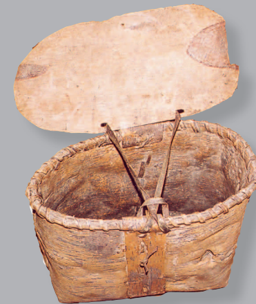
27 (11). Берестяной короб для сбора и переноски ягод. Село Верх-Усугли Тунгокоченского района Читинской области. Фото 1989 г.