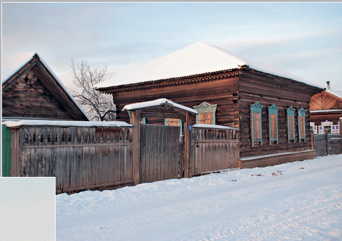
20 (11). Дом с четырёхскатной крышей в селе Карам Казачинско-Ленского района Иркутской области. Фото 2003 г.