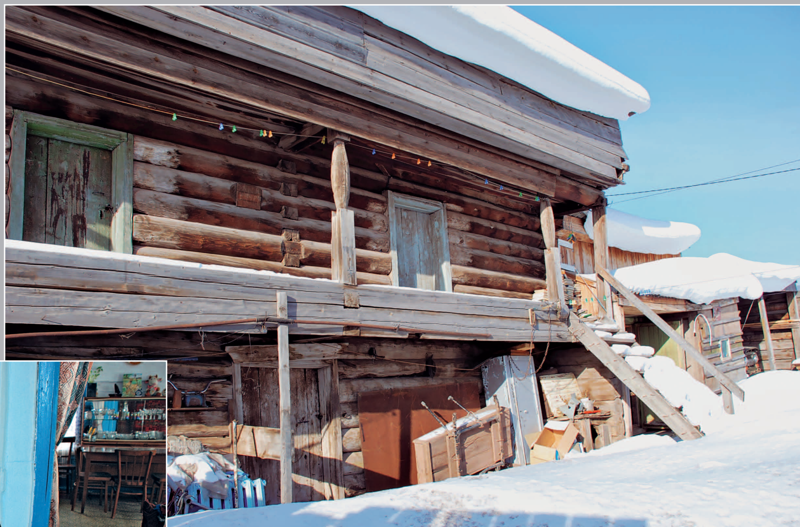
31 (11). Двухэтажный амбар в селе Верхнемарково Усть-Кутского района Иркутской области. Фото 1998 г.