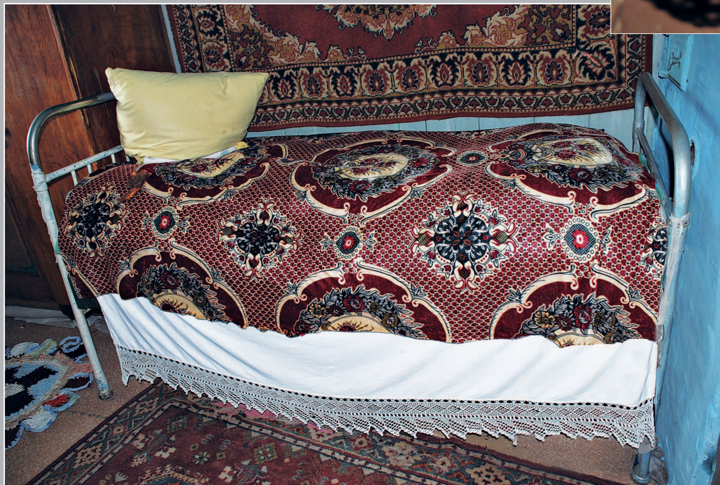
24 (11). Свадебное полотенце. Село Крупянка Нерчинского района Читинской области. Фото 1986 г.