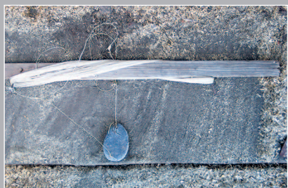
29 (11). «Выкидушка» — рыболовная снасть (с крючком и «камешком» — грузилом). Село Подтёсово Енисейского района Красноярского края. Фото 1987 г.