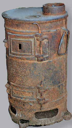
19 (11). Калёнка — чугуная печь. Село Анга Качугского района Иркутской области. Фото 2003 г.