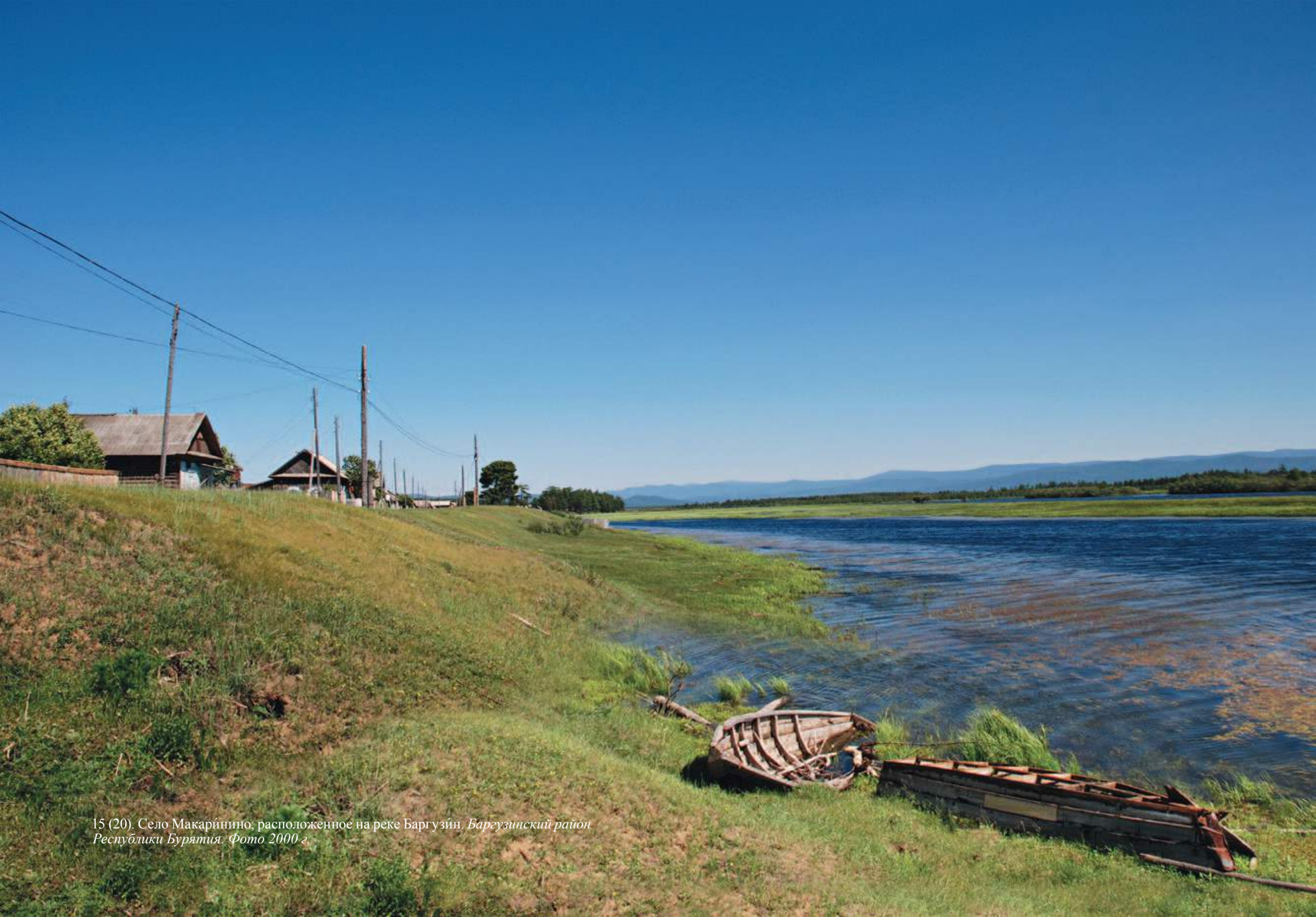
15 (20). Село Макарино, расположенное на реке Баргузин. Баргузинский район Республики Бурятия. Фото 2000 г.