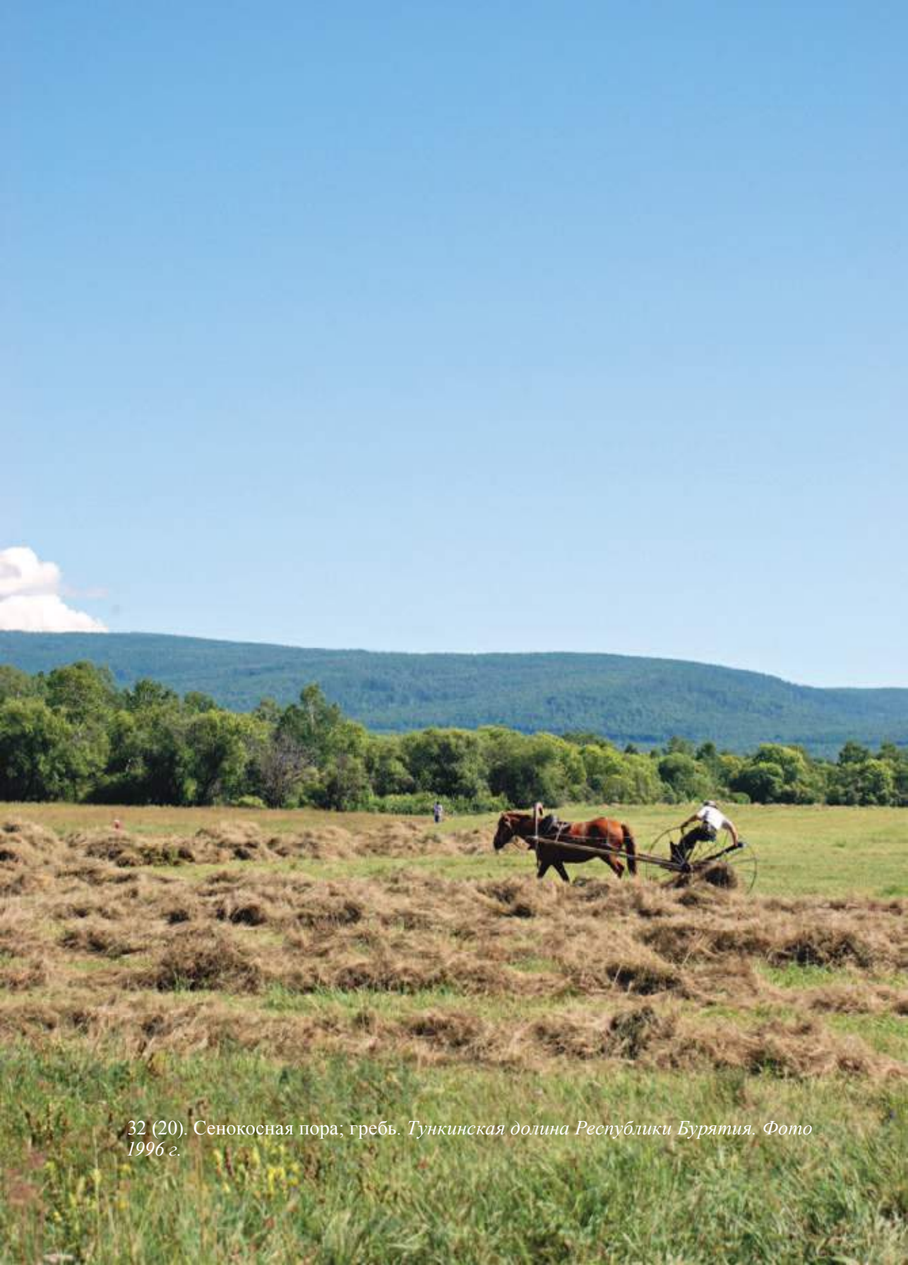
32 (20). Сенокосная пора; гребь. Тункинская долина Республики Бурятия. Фото 1996 г.