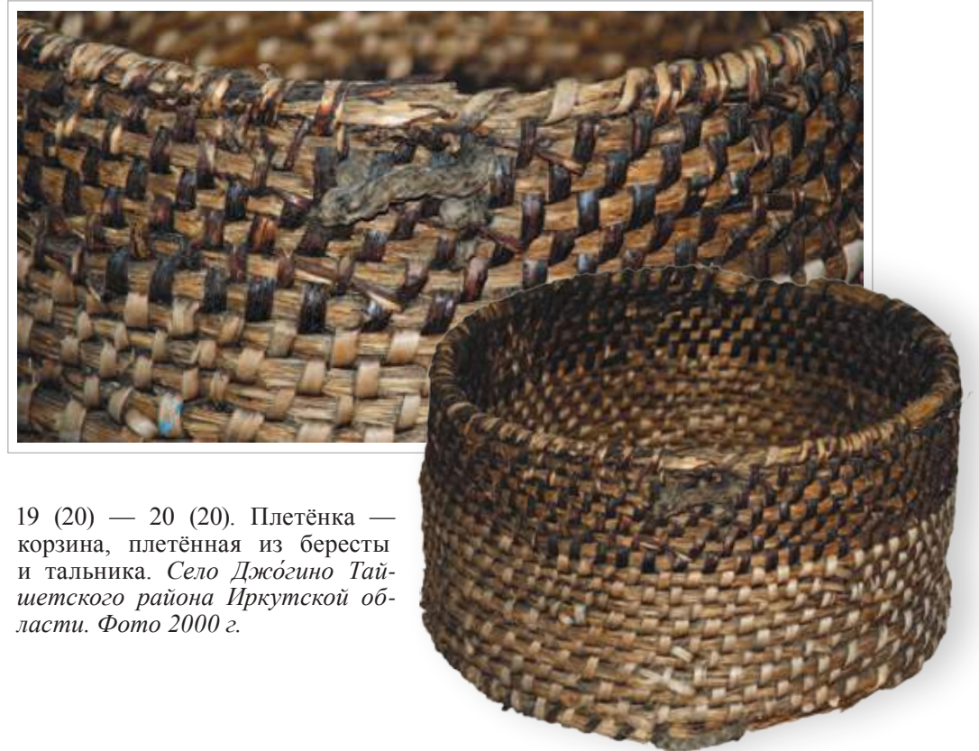
19 (20) — 20 (20). Плетёнка — корзина, плетённая из бересты и тальника. Село Джóгино Тайшетского района Иркутской области. Фото 2000 г.