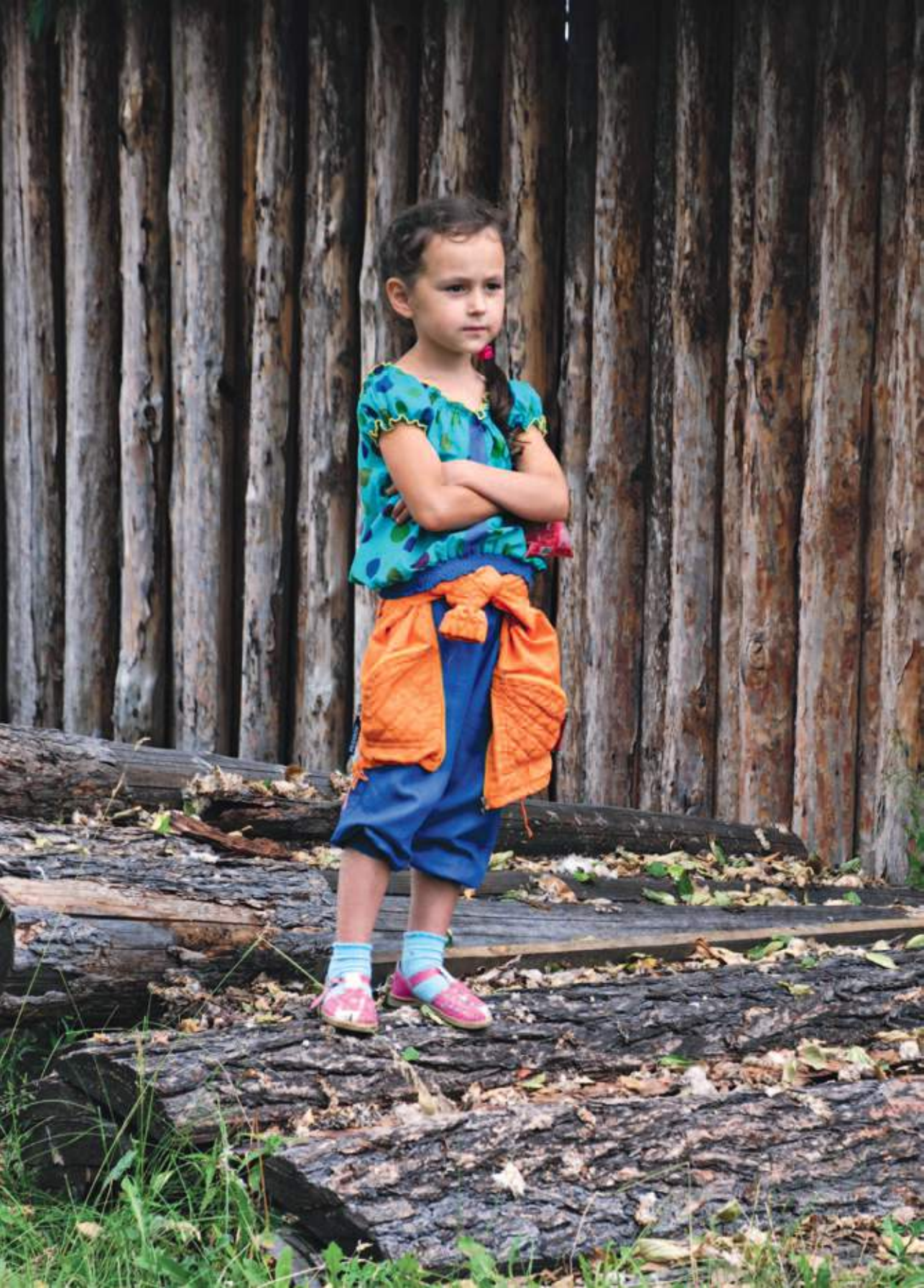
17 (20). Внучка слушает рассказы своей бабушки. Деревня Едогón Тулунского района Иркутской области. Фото 2016 г.