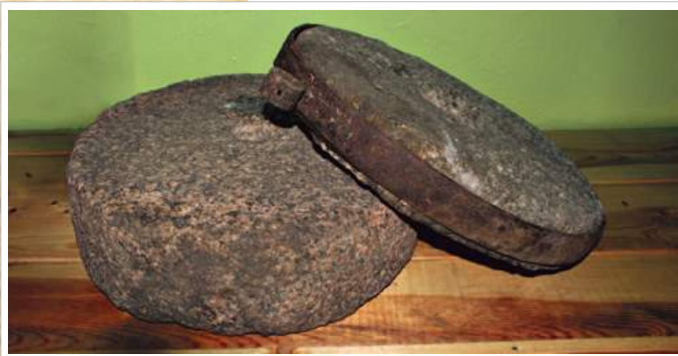
25 (20). Ручное жёрно / жёрнов / жёрново — каменный парный круг, служащий для раздробления (помола) зерна. Деревня Аталанка Усть-Удинского района Иркутской области. Фото 1997 г.