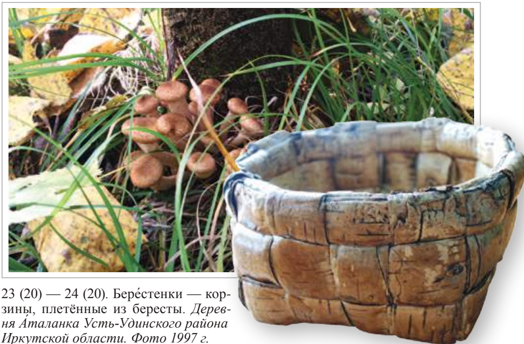
23 (20) — 24 (20). Берёстенки — корзины, плетённые из бересты. Деревня Аталанка Усть-Удинского района Иркутской области. Фото 1997 г.