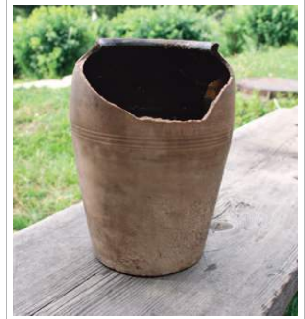
18 (20). Глиняный горшок. Село Ишидэй Тулунского района Иркутской области. Фото 1998 г.