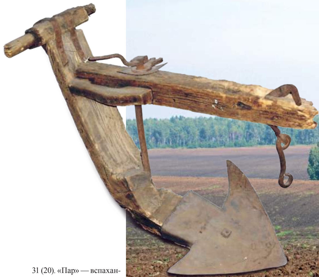
31 (20). «Пар» — вспаханное поле, оставленное на одно лето незасеянным. Деревня Аталанка Усть-Удинского района Иркутской области. Фото 1995 г.