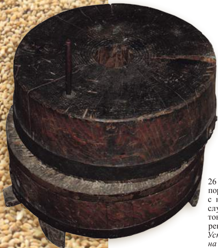
26 (20). Жерновáя крупорúшка / крупорúша с набитыми гвоздями, служащая для приготовления крупы из зёрен. Деревня Аталанка Усть-Удинского района Иркутской области. Фото 1997 г.