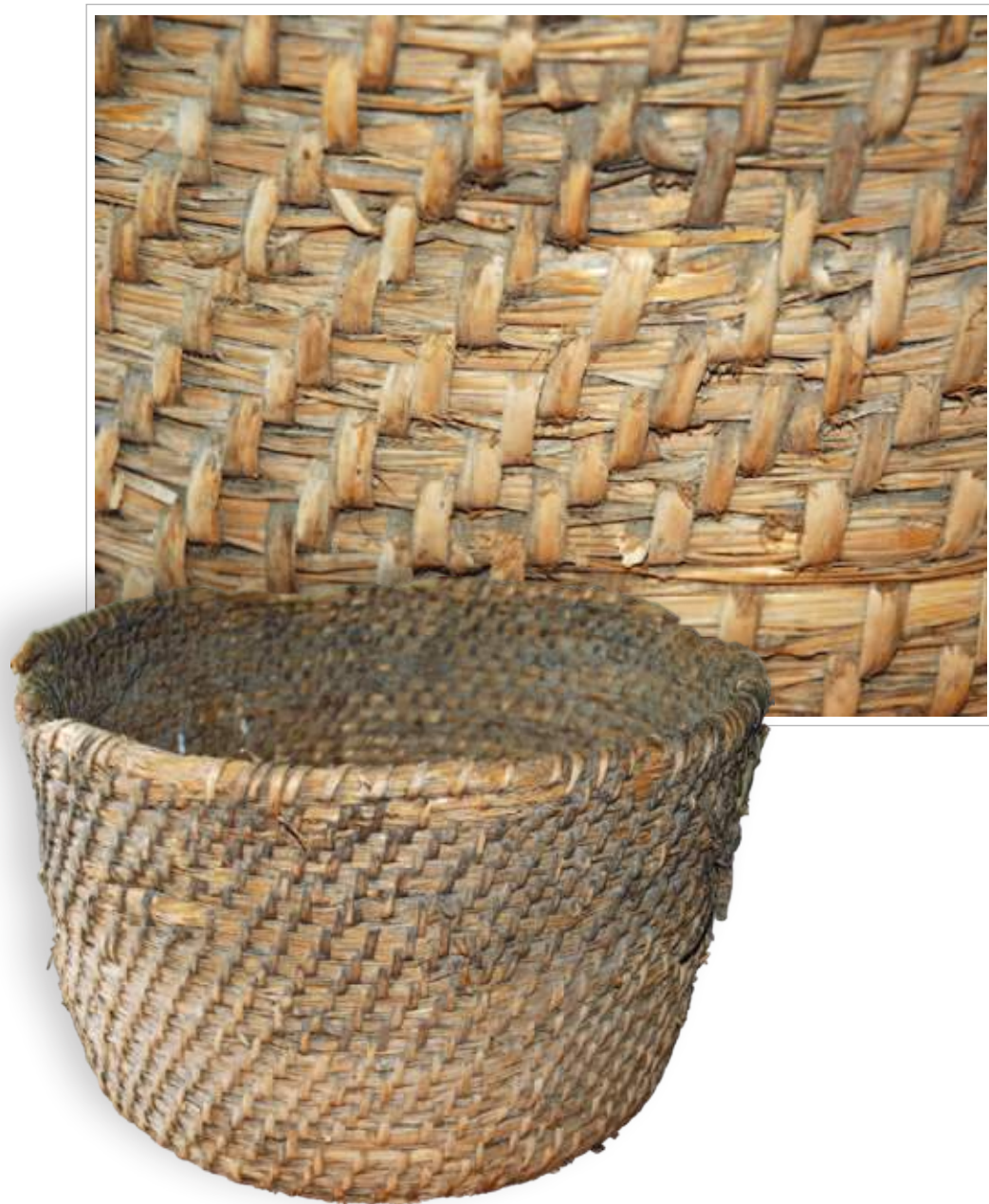
21 (20) — 22 (20). Плетёнка — корзина, плетённая из тальника. Село Бузыкá-ново Тайшетского района Иркутской области. Фото 2000 г.