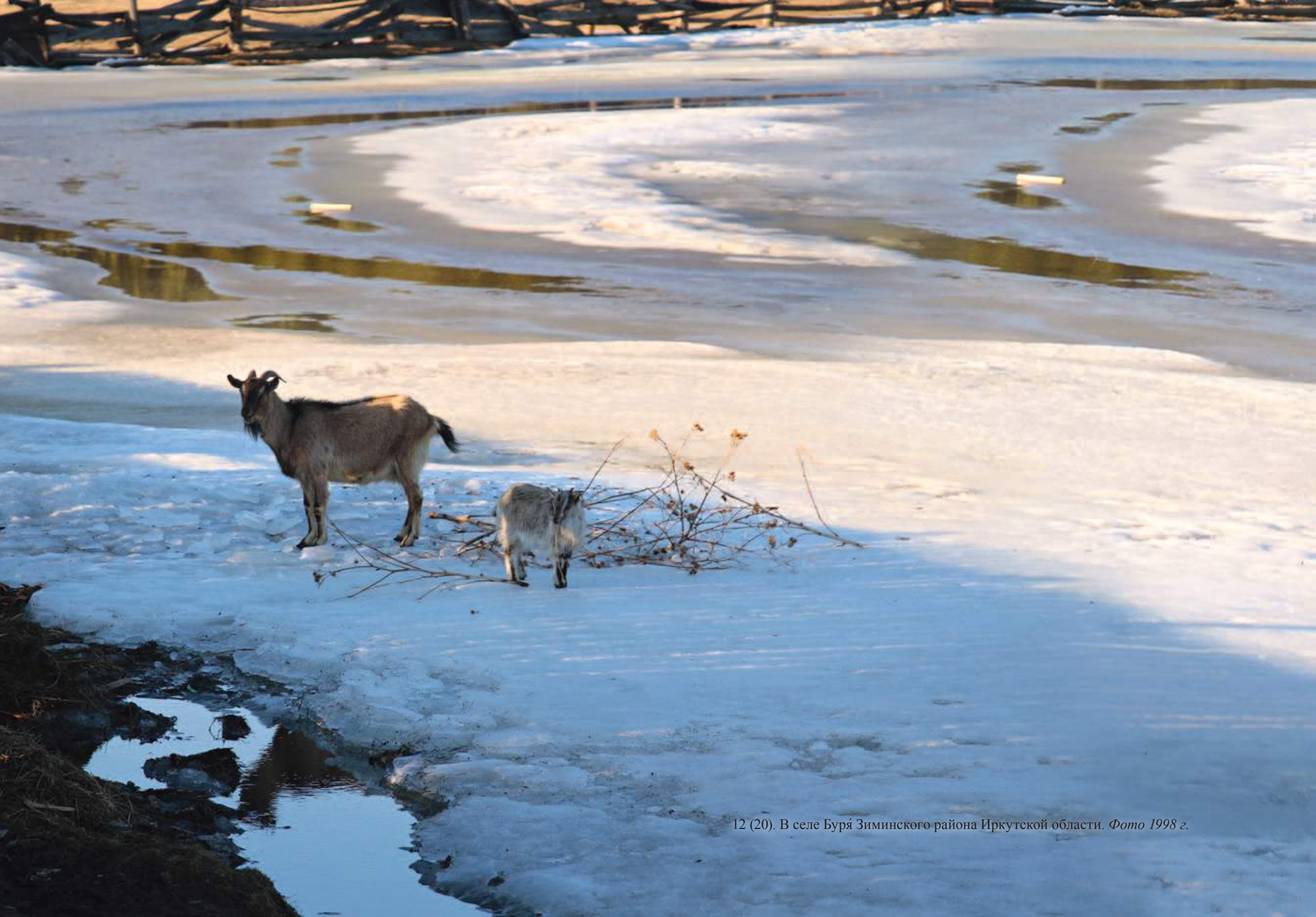
12 (20). В селе Буря Зиминского района Иркутской области. Фото 1998 г.