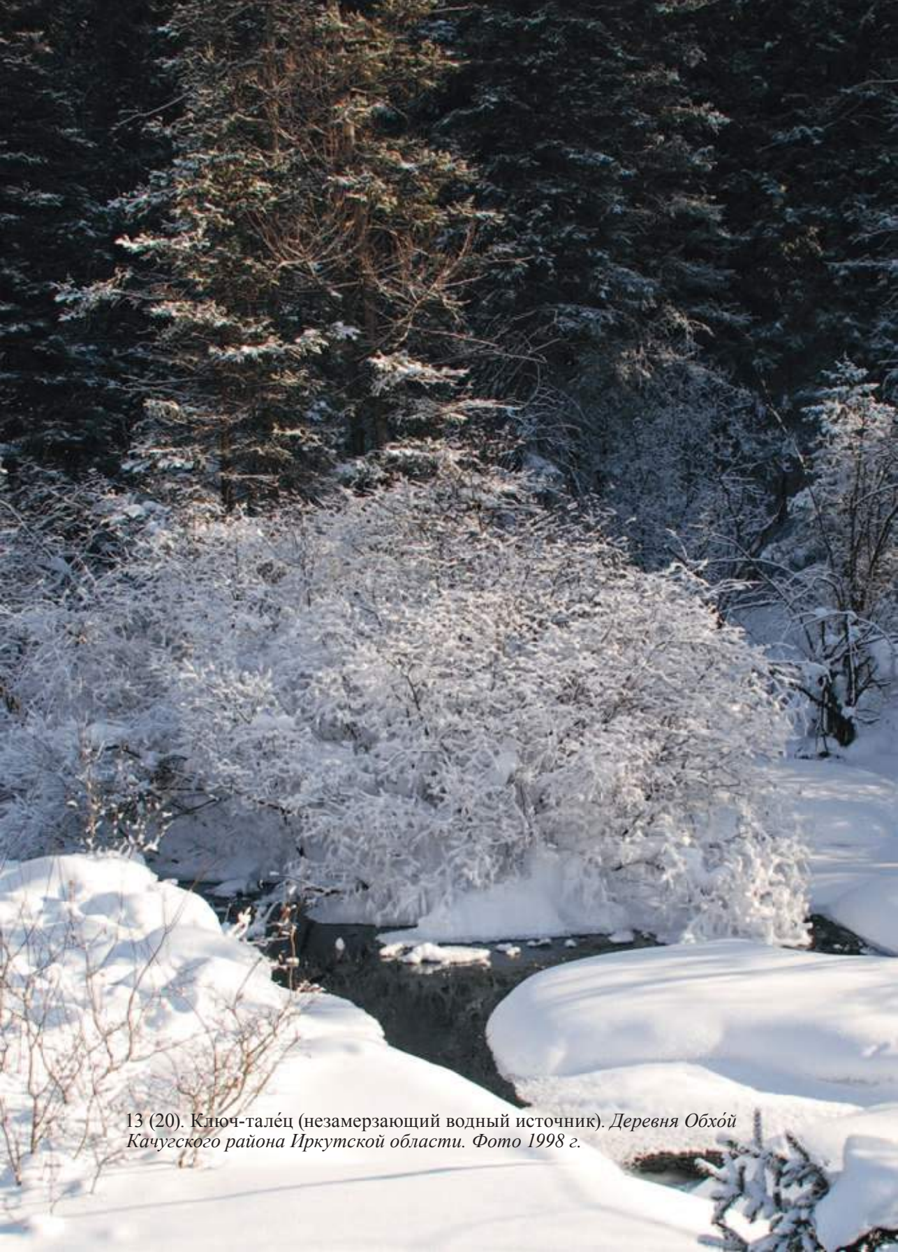
13 (20). Ключ-талёц (незамерзающий водный источник). Деревня Обхой Качугского района Иркутской области. Фото 1998 г.