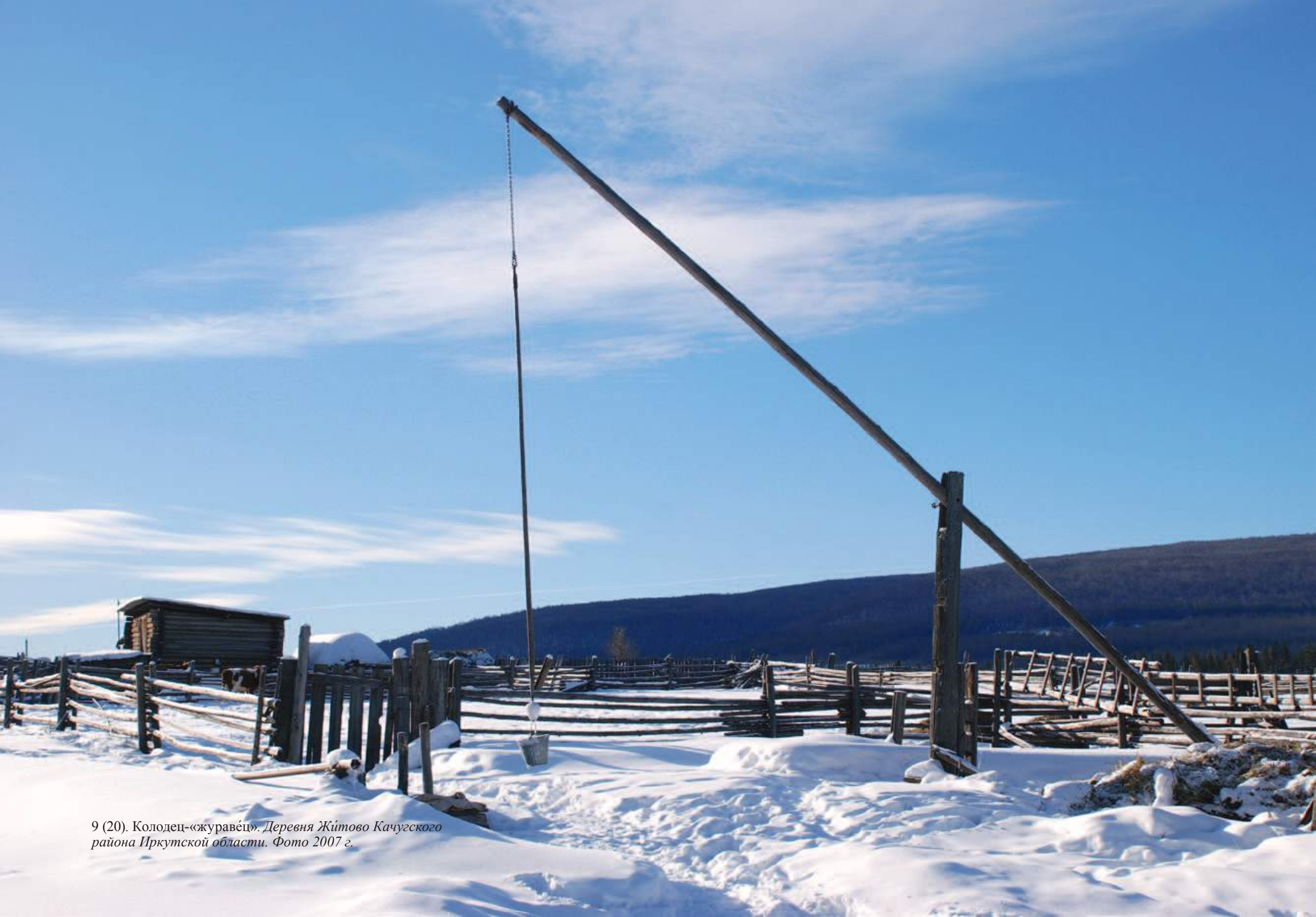
9 (20). Колодец-«журавец». Деревня Жітово Качугского района Иркутской области. Фото 2007 г.