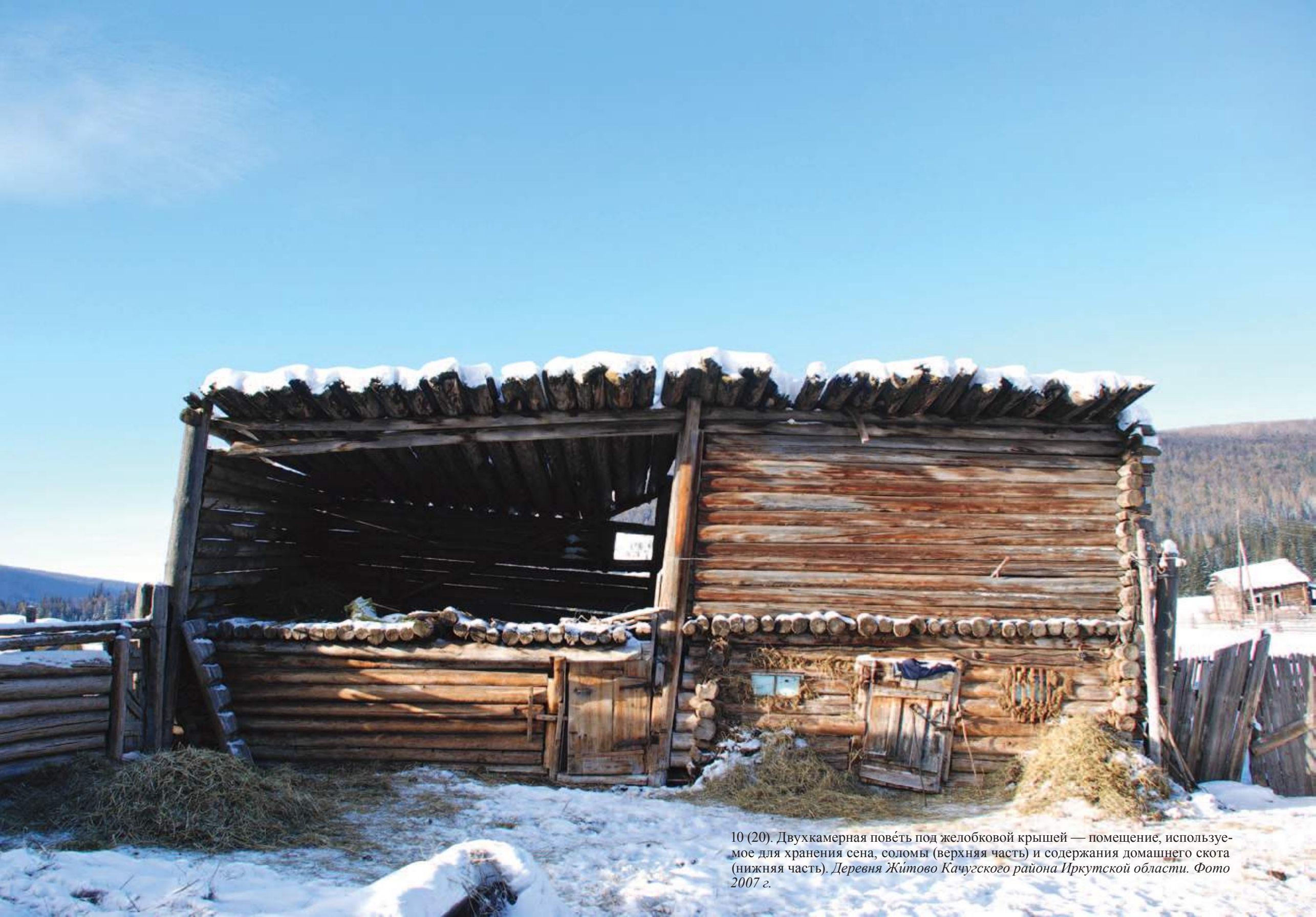
10 (20). Двухкамерная пове́ть под желобковой крышей — помещение, используемое для хранения сена, соломы (верхняя часть) и содержания домашнего скота (нижняя часть). Деревня Житово Качугского района Иркутской области. Фото 2007 г.