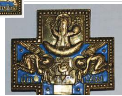
3 (20) — 4 (20). Крест «Распятие Христово» (медный сплав, литьё, эмаль). Посёлок Гремячинск Прибайкальского района Республики Бурятия. Фото 1998 г.