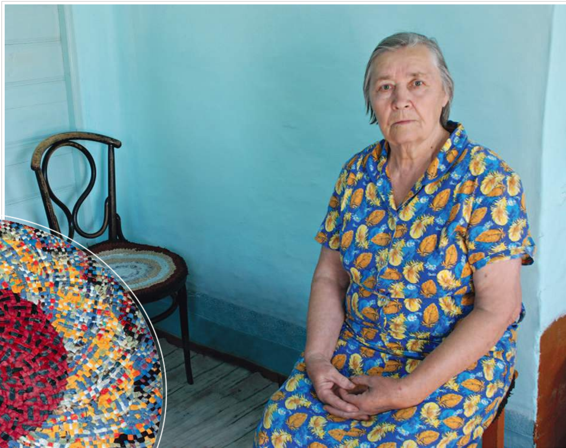
7 (20). Тряпичный коврик, изготовленный в технике «чич- кóвское плетение». Дерев- ня Чичкóво Усть-Удинского района Иркутской области. Фото 1996 г.