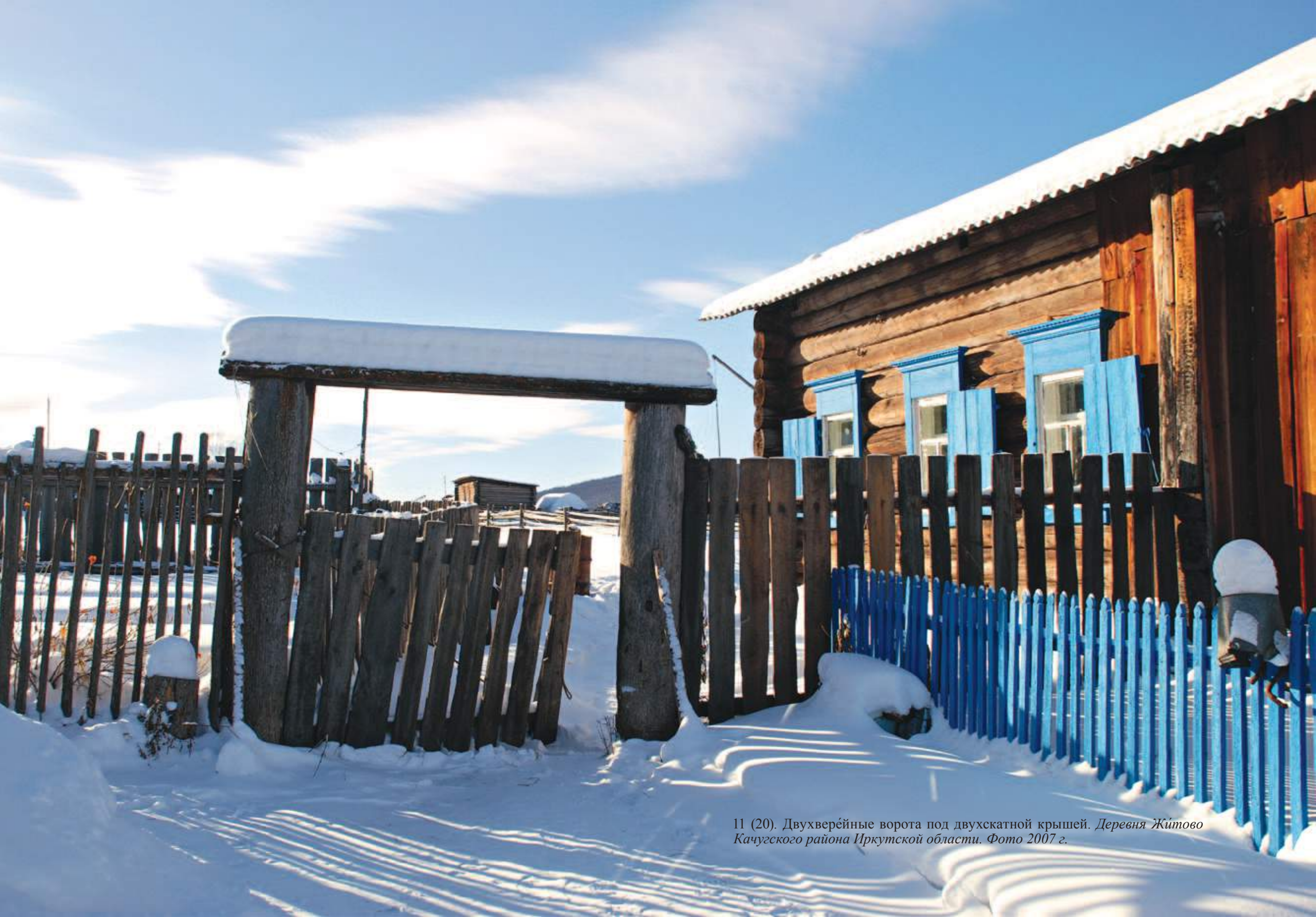
11 (20). Двухверейные ворота под двухскатной крышей. Деревня Житово Качугского района Иркутской области. Фото 2007 г.