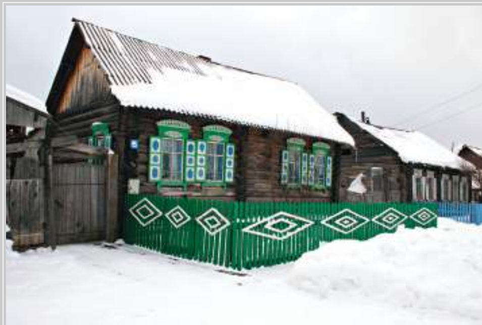
15 (18). Дом-пятистенок с двускатной крышей. Село Кондратьево Тайшетского района Иркутской области. Фото 1998 г.