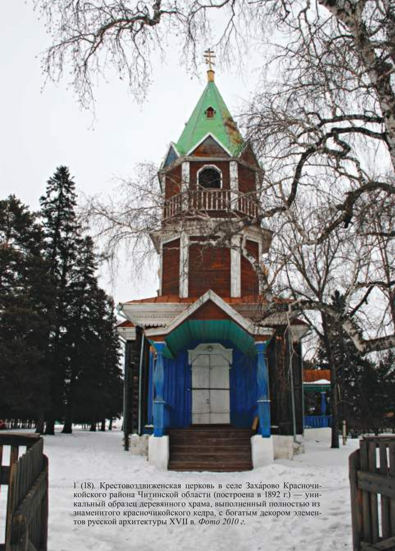
1 (18). Крестовоздвиженская церковь в селе Захарово Красноярского района Читинской области (построена в 1892 г.) — уникальный образец деревянного храма, выполненный полностью из знаменитого красночичкойского кедра, с богатым декором элементов русской архитектуры XVII в. Фото 2010 г.