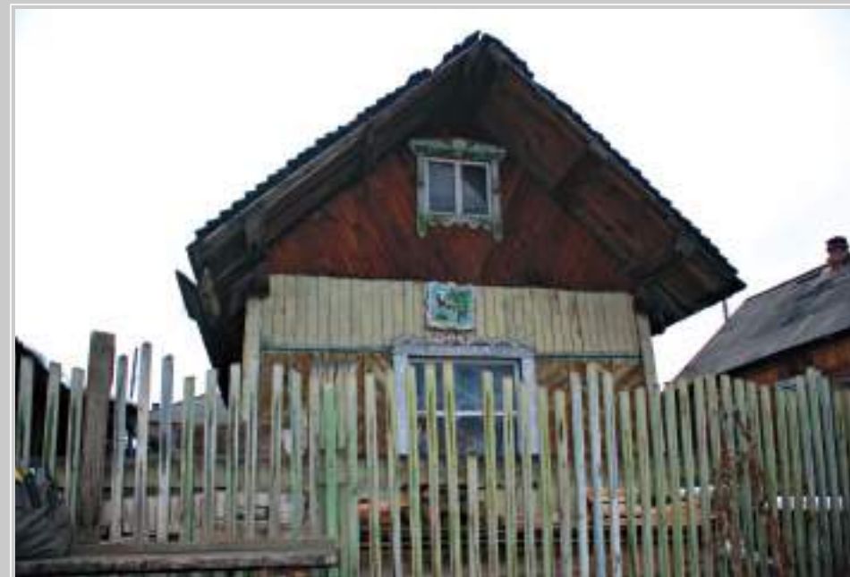
17 (18). Дом с двускатной крышей. Село Средняя Муя Усть-Удинского района Иркутской области. Фото 1997 г.