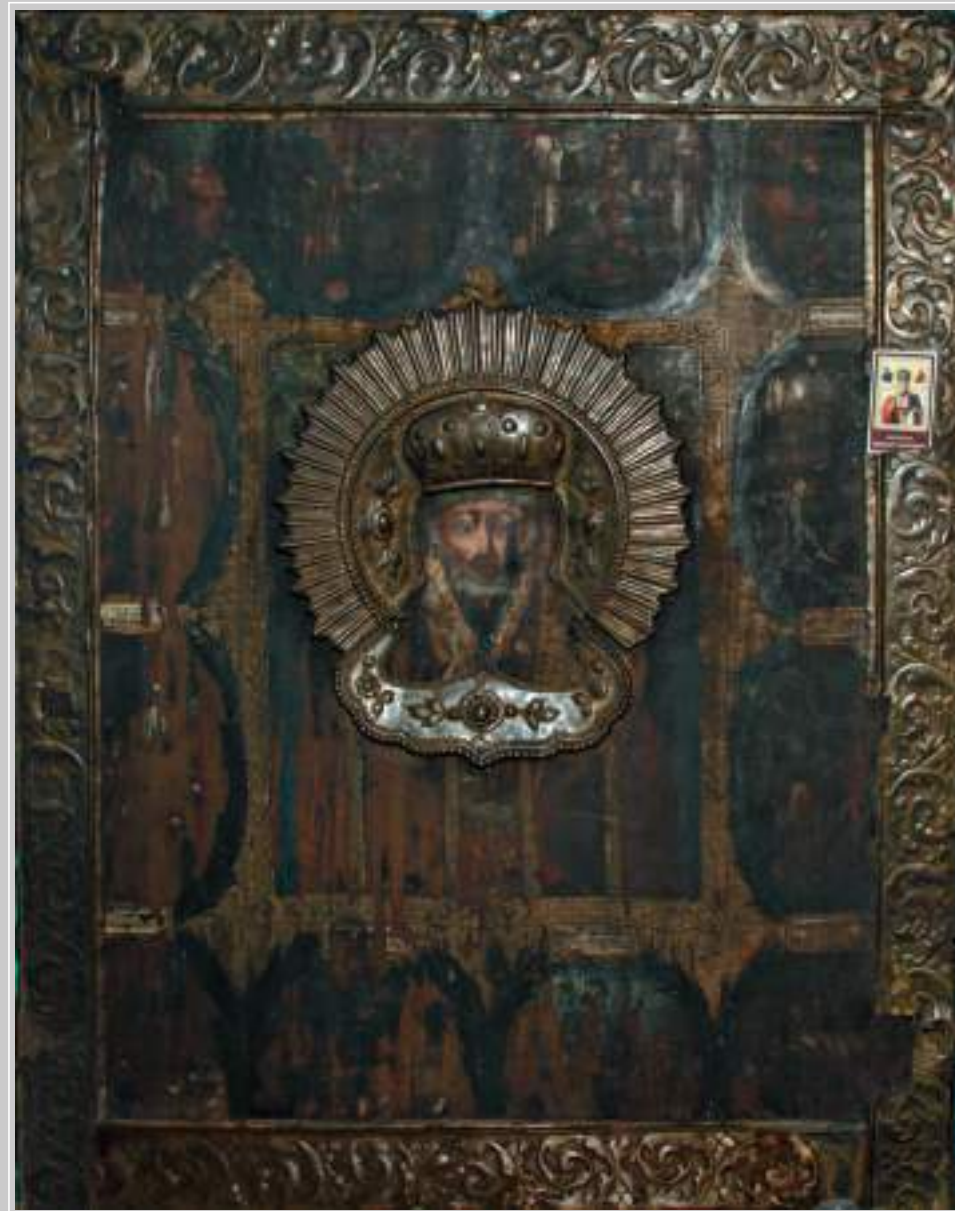
8 (18). Икона «Николай Чудотворец с клеймами жития» (XIX в.). Село Кондратьево Тайшетского района Иркутской области. Фото 2012 г.