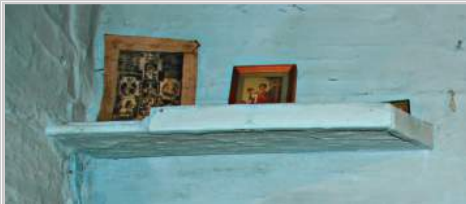
6 (18). «Красный» угол. Село Кондратьево Тайшетского района Иркутской области. Фото 1996 г.