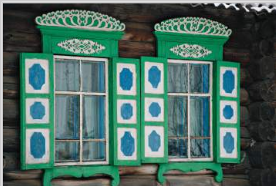
16 (18). Оконные ставни и наличники с элементами накладной резьбы. Село Кондратьево Тайшетского района Иркутской области. Фото 1998 г.