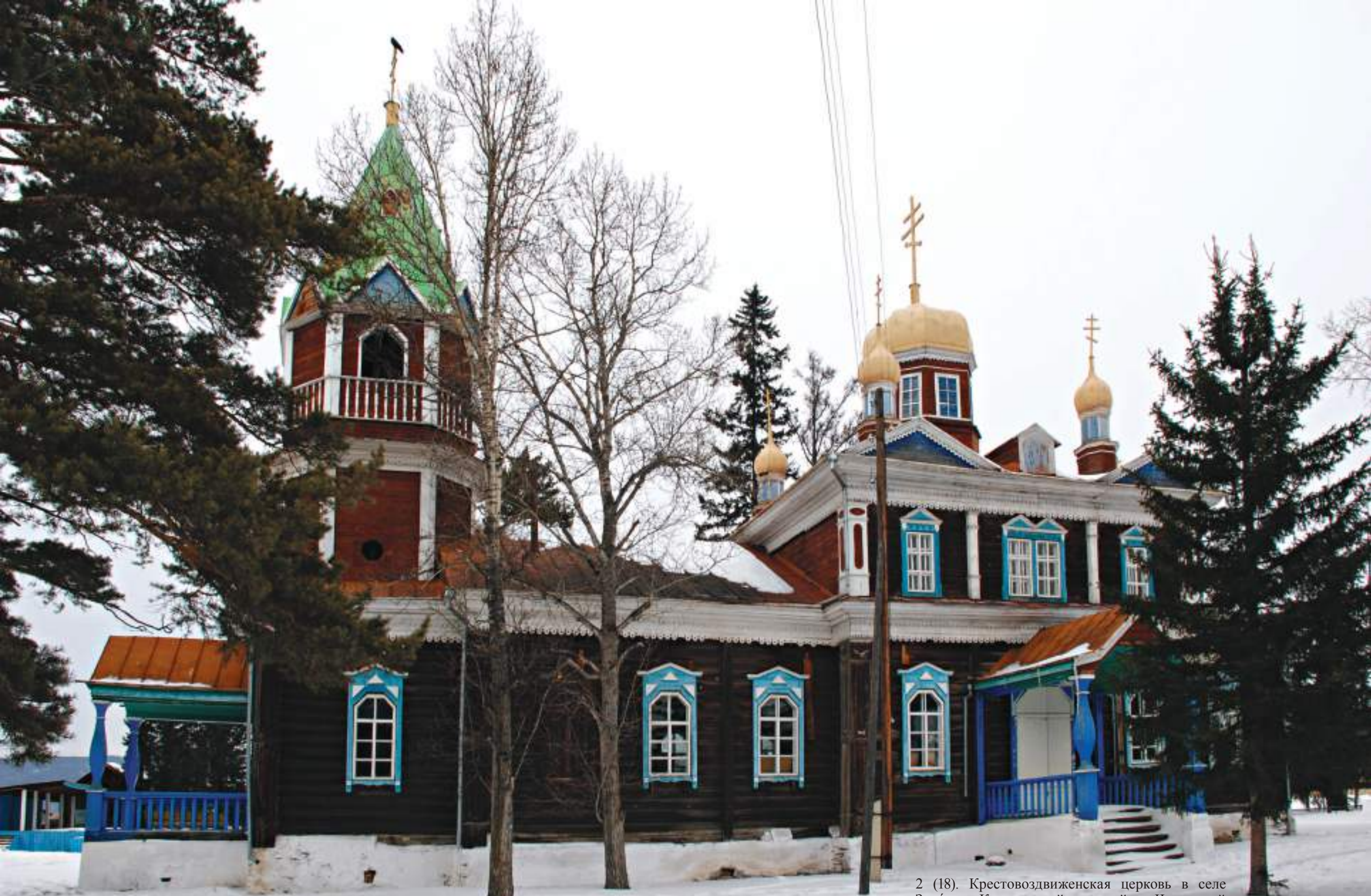
2 (18). Крестовоздвиженская церковь в селе Захарово Красночикойского района Читинской области (построена в 1892 г.). Фото 2010 г.