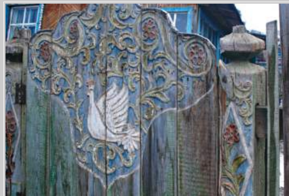
18 (18). Фрагмент калитки с изображением голубя. Село Средняя Муя Усть-Удинского района Иркутской области. Фото 1997 г.