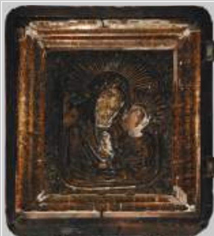
9 (18). Икона Божией Матери «Казанская» в окладе (2-я пол. XIX в.). Село Подволочное Усть-Удинского района Иркутской области. Фото 1990 г.