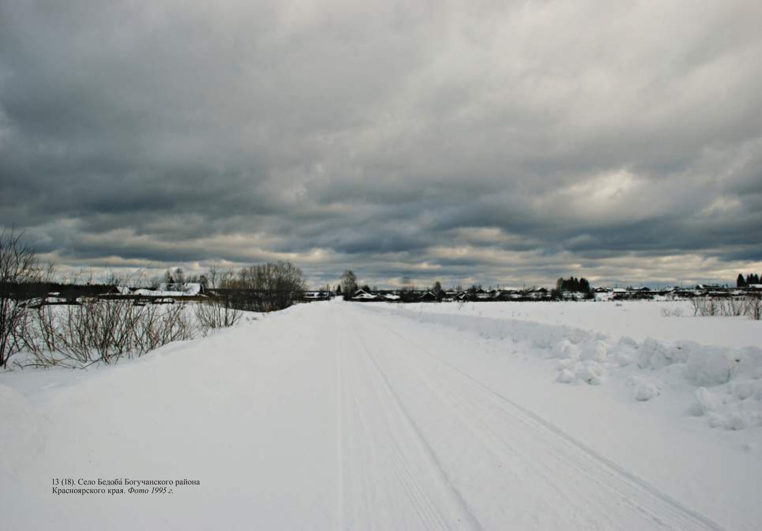
13 (18). Село Бедобá Богучанского района Красноярского края. Фото 1995 г.