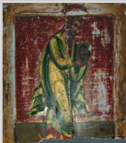
3 (18). Икона «Иоанн Предтеча» (?) (XIX в.). Село Захарово Красночичкойского района Читинской области. Фото 1995 г.