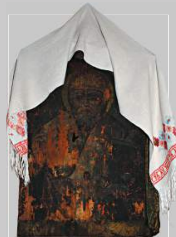
11 (18). Икона «Святитель Николай Чудотворец» (XIX в.). Село Средняя Муя Усть-Удинского района Иркутской области. Фото 2001 г.