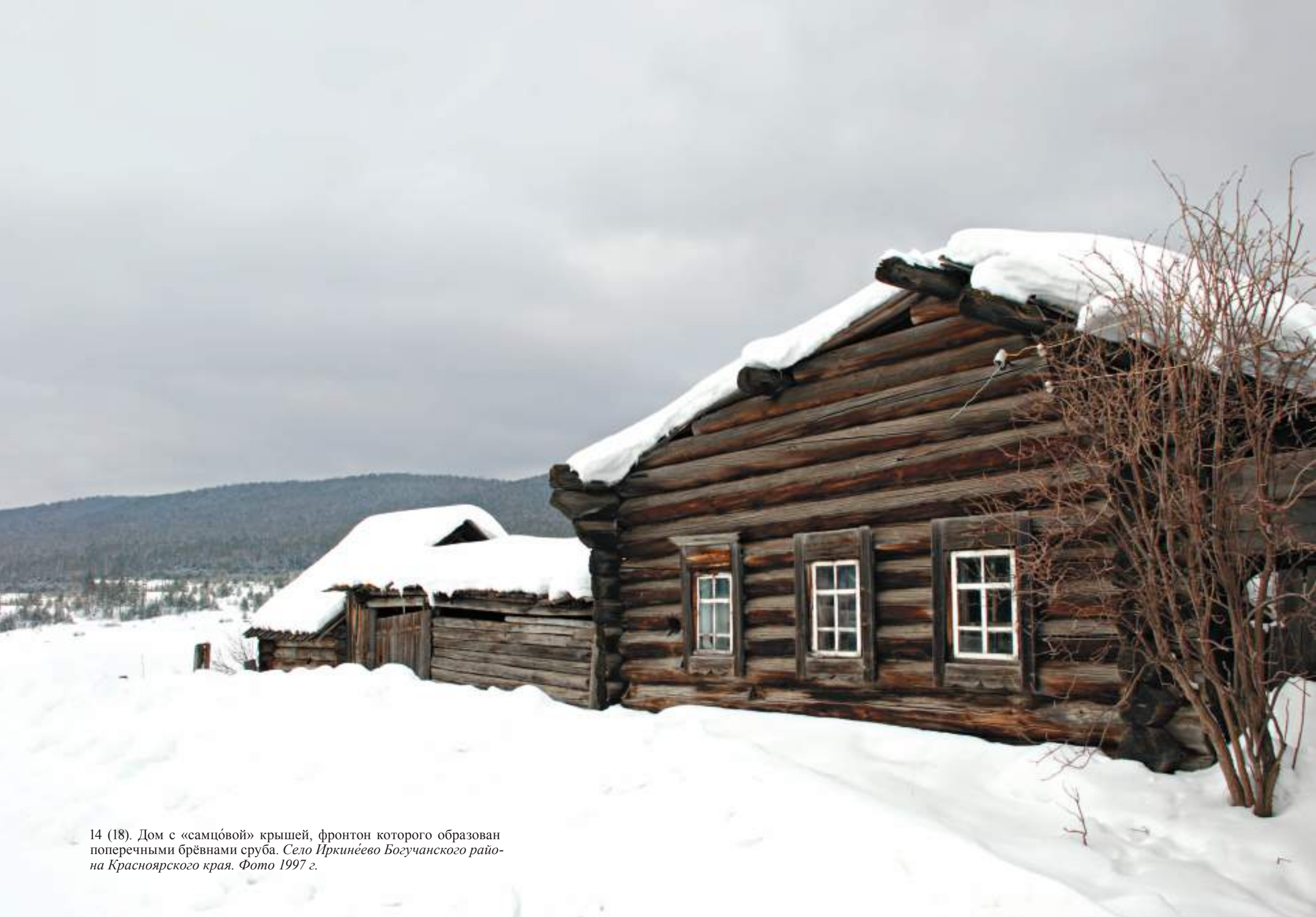
14 (18). Дом с «самцово́й» крышей, фронто́н которого образован поперечными брёвнами сруба. Село Ирки́ннеево Богучанского райо́на Красноярского края. Фото 1997 г.